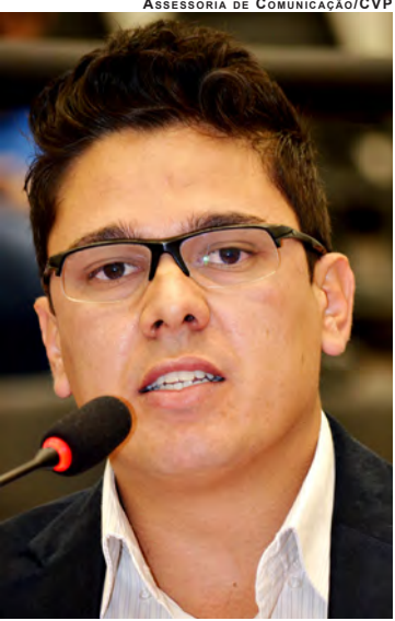
ASSESSORIA DE COMUNICAÇÃO/CVP

havia sabonete líquido para fazer a higienização, os metais dos banheiros estão todos enferrujados, principalmente o mictório do banheiro masculino; não há divisórias para garantir a privacidade das pessoas que estão usando os banheiros e o prédio está com iluminação precária. Além disso, o bebedouro está sujo, precisando de limpeza. “Muitas pessoas passam diariamente pelo velório, sendo necessário que se