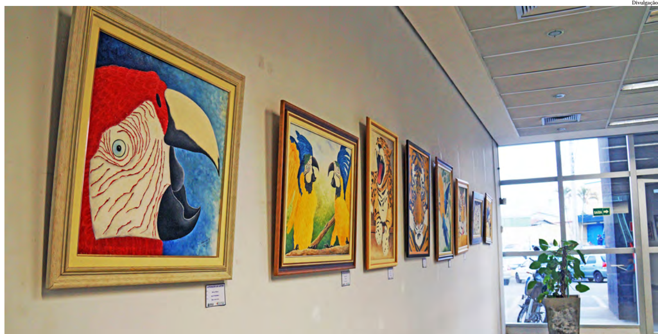
Exposição "Pelos e Penas" segue no saguão da Prefeitura até o final de outubro

Desde 1992, tem realizado exposições em vários estados brasileiros, países da Europa, Ásia, América Central e do Sul.