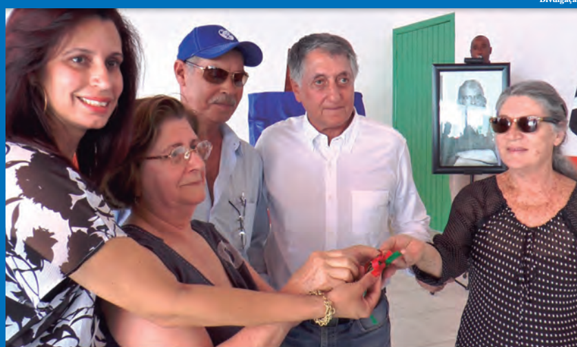
Prefeito participou da cerimônia de inauguração