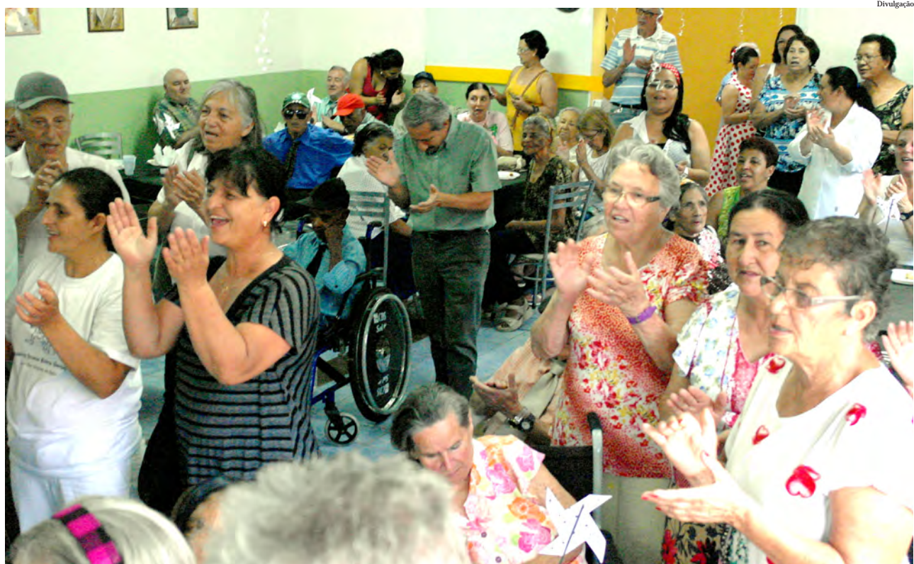
Os residentes do Lar e os convidados se divertiram durante a festa, ao som de Romão