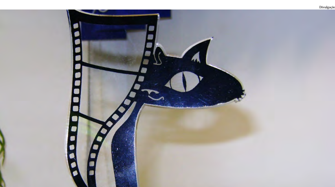
O anúncio dos vencedores acontecerá no dia 30 de outubro

As inscrições para o tradicional Festival Gato Preto, que premia as melhores produções de cinema-amador da região, já estão abertas.