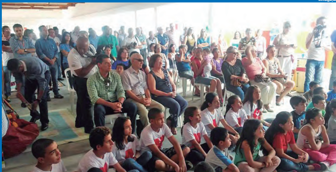
População compareceu em grande número ao evento

vai fazer a preparação do terreno. No bairro Araretama, uma equipe está realizando o estudo e planejamento para fundação da obra.