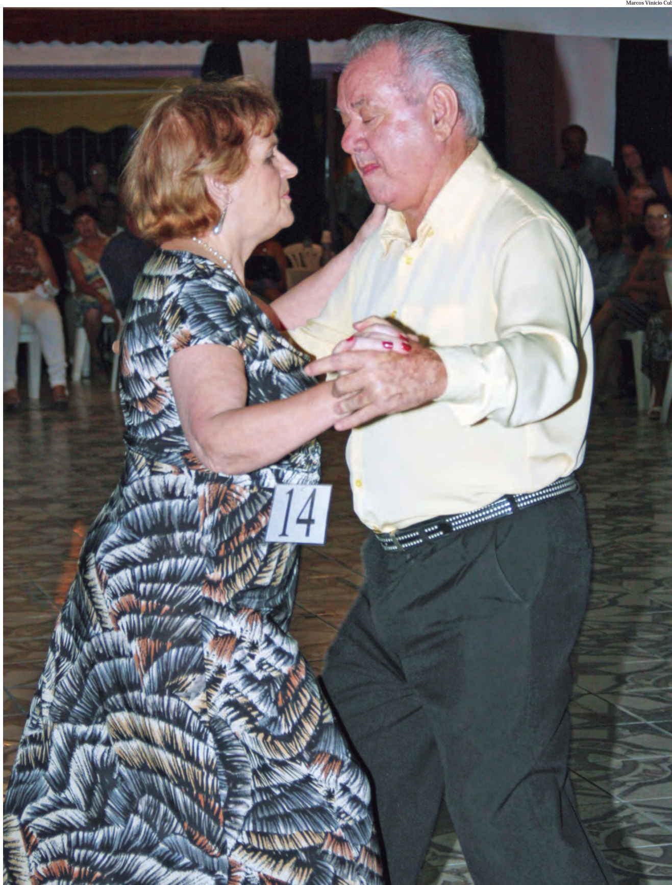
O presidente do CCI e a esposa representam Pinda em competições de dança de salão