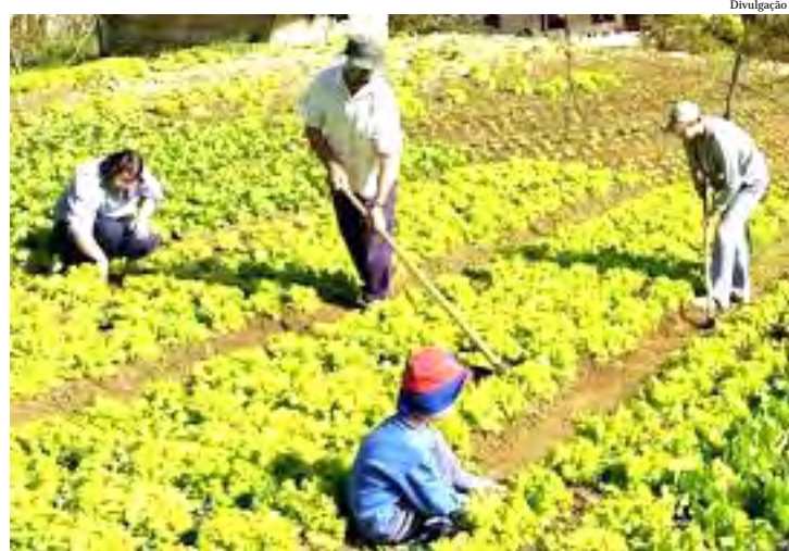
A aquisição desses produtos é determinada por Lei

A lei estabelece que a aquisição pode ser feita por meio de Chamada Pública, assim, não é necessário o procedimento da licitação, determinada pela Lei 8.666/93.