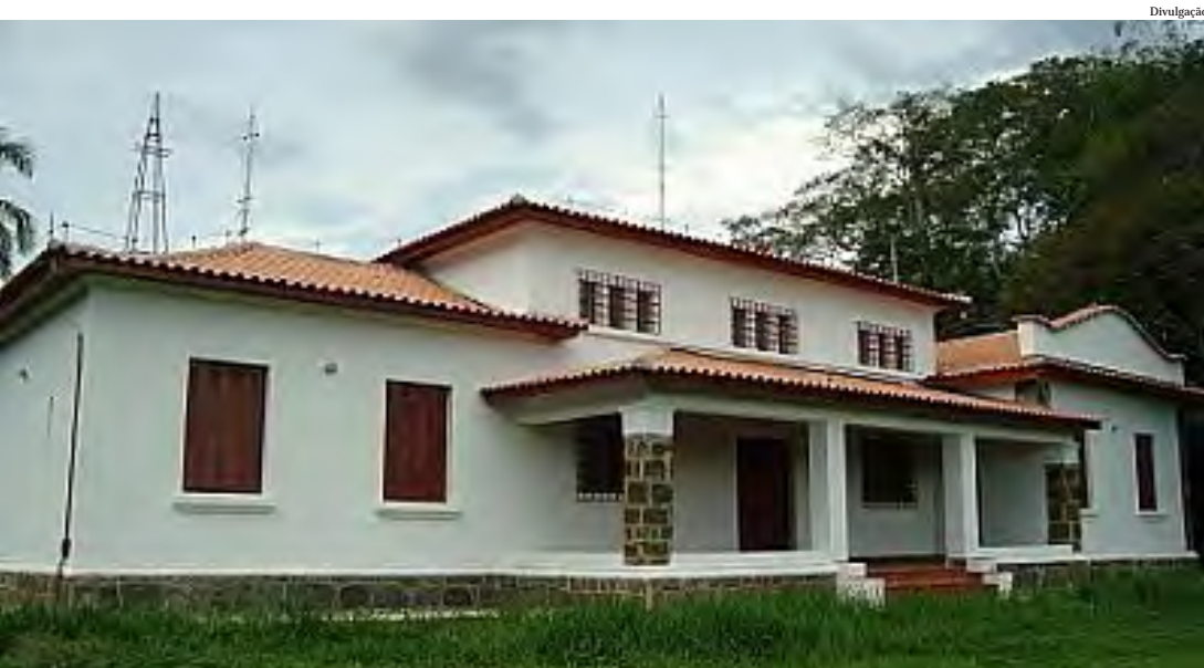
O Polo Regional da Apta está em Pinda desde a década de 70

Muitas pessoas não sabem, mas existe uma instituição no município que desenvolve um extenso trabalho de pesquisa com abelhas. Trata-se do Polo Regional da Apta - Agência Paulista de Tecnologia dos Agronegócios.