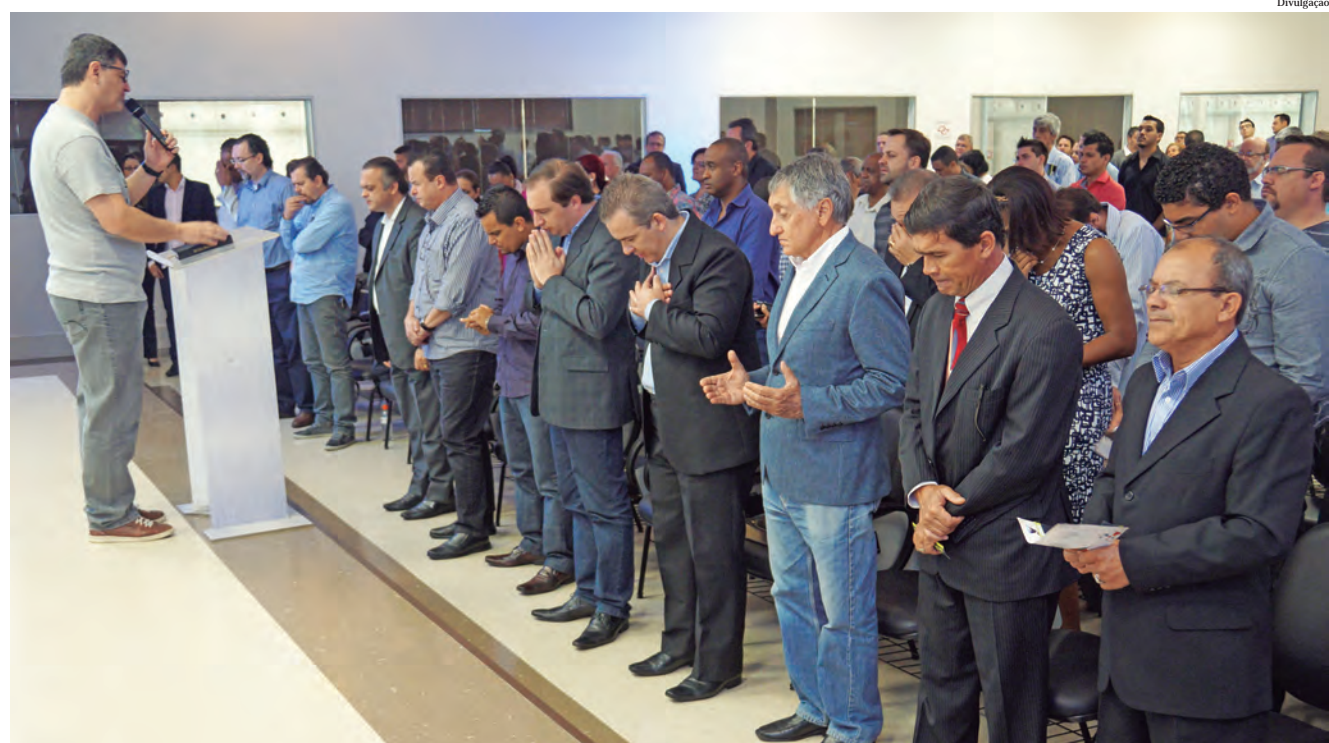
Durante abertura do evento, os presentes participaram de um momento de oração

A feira ainda terá 50 expositores, que venderão livros, CDs, instrumentos musicais, roupas com mensagens cristãs, entre outros itens.