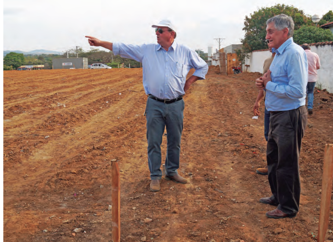
O prefeito de Pinda está acompanhando todas as fases da obra

A terraplanagem da UPA do Cidade Nova já foi feita, a próxima etapa terá início em breve. No local haverá espaços para atendimento social, sala para classificação de riscos, exames, inalação, obser-