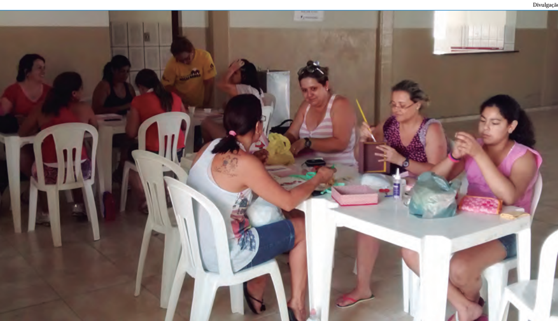
O projeto Nosso Bairro oferece diversos cursos para a população