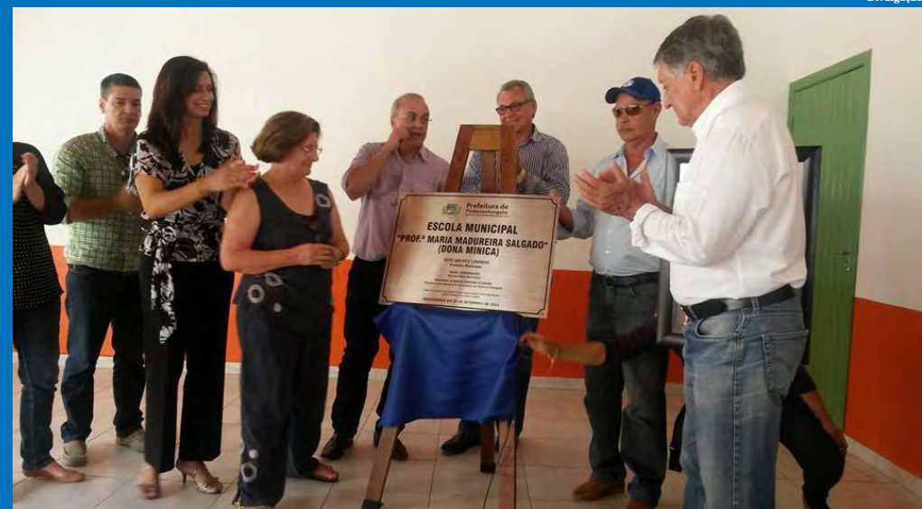
Famílias da homenageada prestigiaram a solenidade