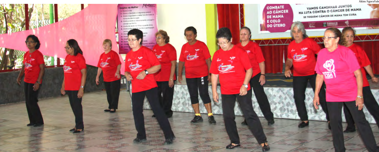
O objetivo da ação é conscientizar as mulheres da importância da prevenção contra o câncer