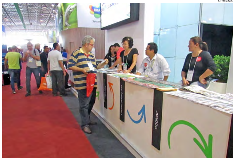
O evento recebeu 40 mil visitantes que atuam no setor

A equipe do Departamento de Turismo de Pindamonhangaba se revezou no atendimento nos estandes do Circuito Mantiqueira e do Codivap-Turismo, numa parceria com outras prefeituras da Região Metropolitana do Vale do Paraíba, divulgando e distribuindo materiais sobre as potencialidades de turismo da região.