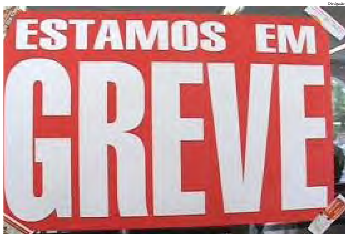
No Vale, 197 das 319 agências aderiram à greve

Para o presidente da Contraf-CUT, apesar dos lucros, “os bancos estão fechando postos de trabalho e piorando as condições de trabalho, com aumento das metas abusivas e do assédio moral, o que tem provocado uma verdadeira epidemia de adoecimentos na categoria. Por falta de investimento em segurança, também cresce o número de assaltos, sequestros e mortes. Mas os banqueiros se recusam a buscar soluções para esses problemas”.