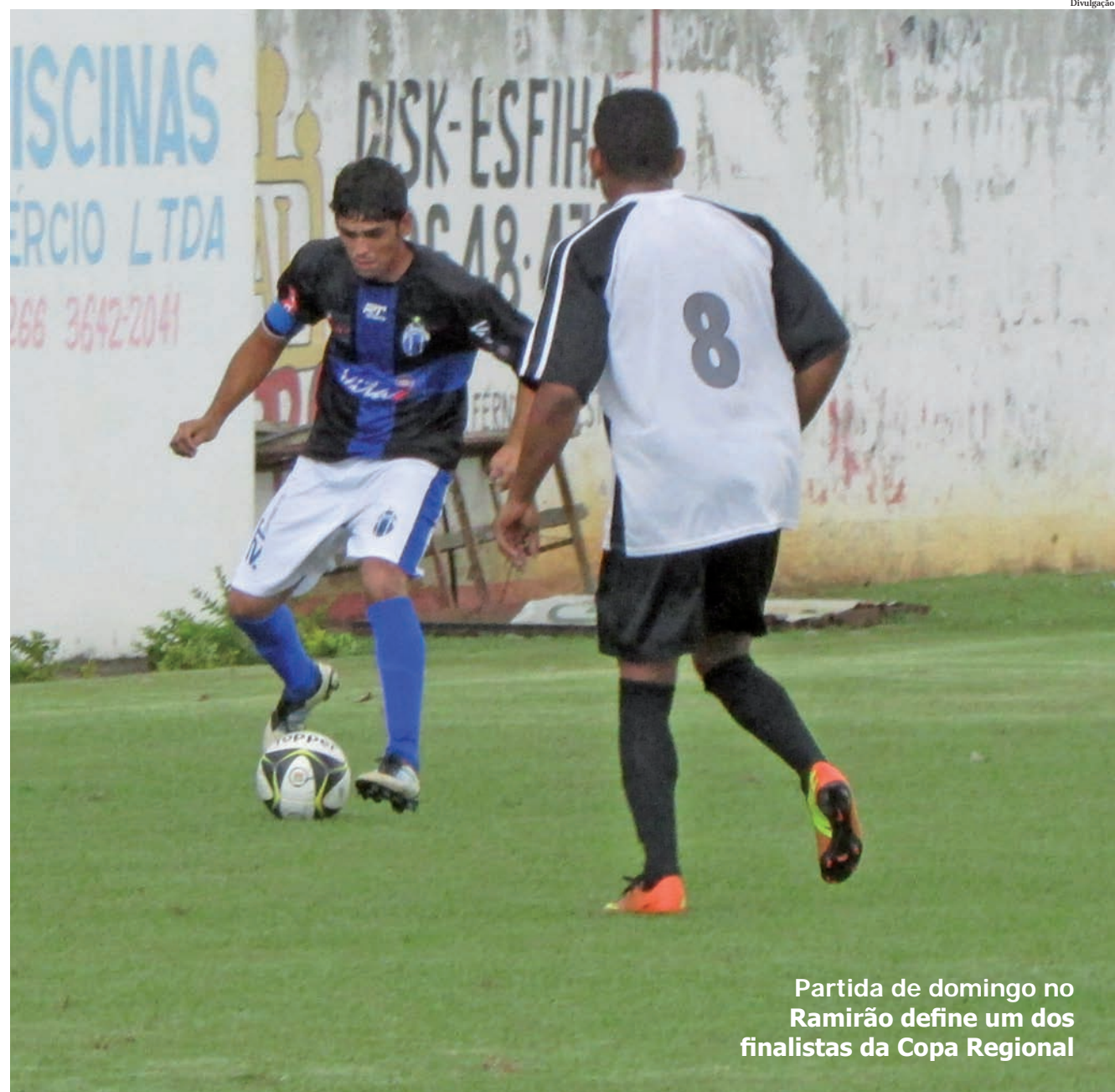
Partida de domingo no Ramirão define um dos finalistas da Copa Regional