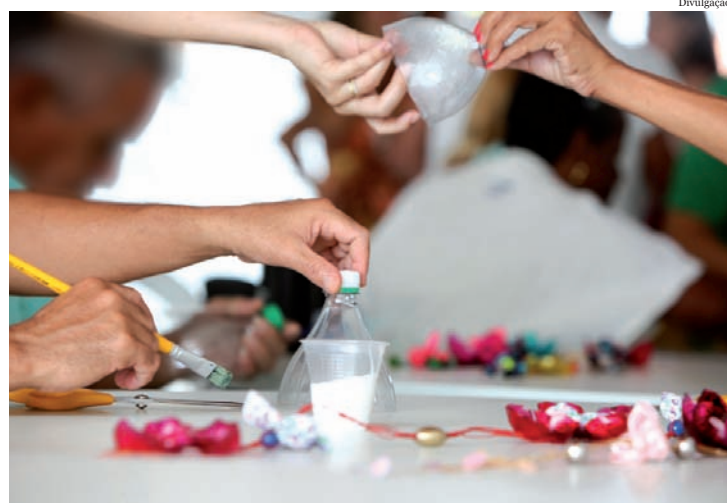
As aulas serão realizadas de abril a junho

A Biblioteca do Araretama fica na rua Cássio Pires Salgado, 150, Nova Esperança. A realização da oficina se dá por meio da Coordenação de Bibliotecas, Departamento de Cultura e Secretaria de Educação e Cultura da Prefeitura de Pindamonhangaba.