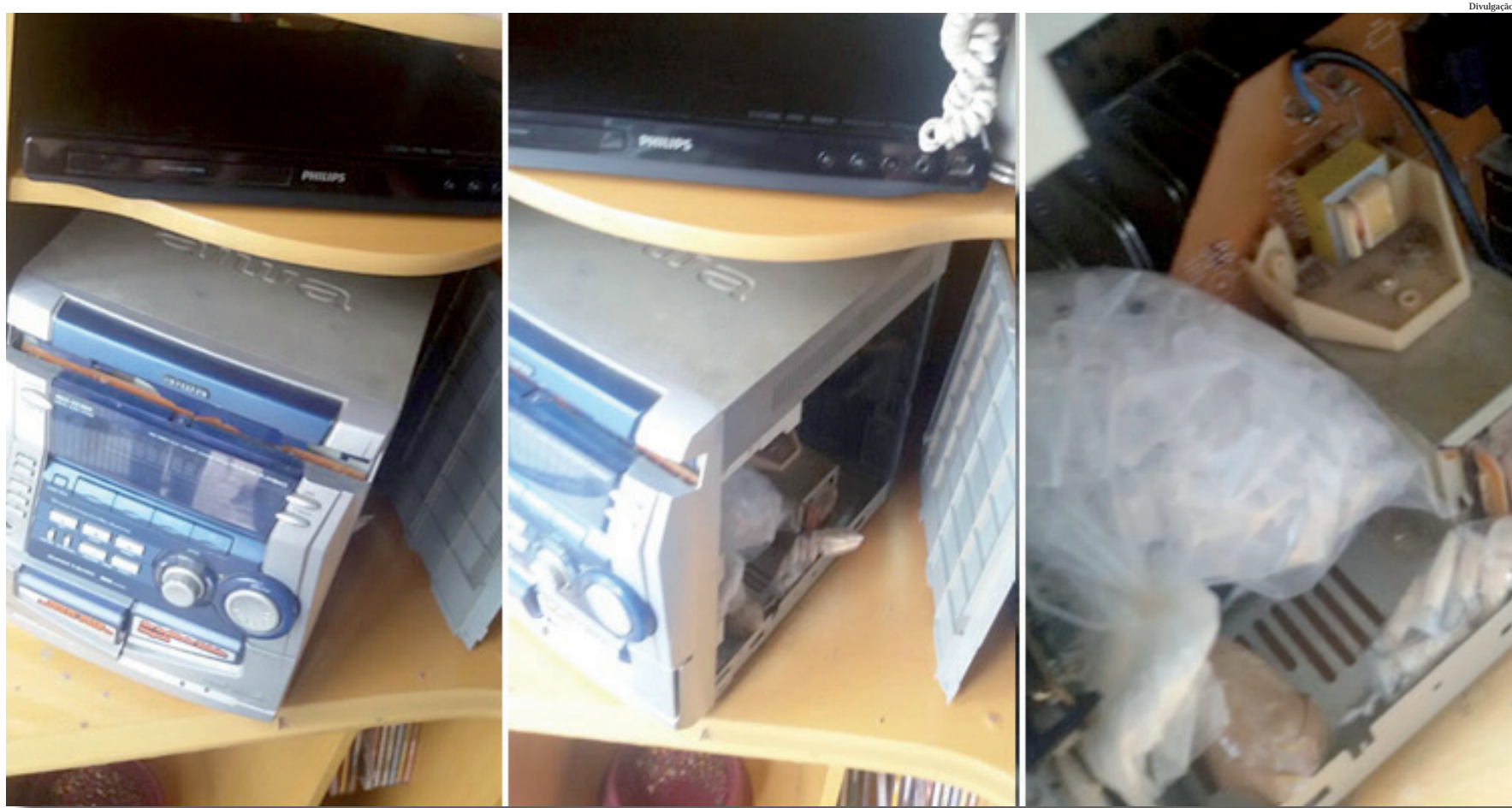
Entorpecentes foram encontrados no interior de um aparelho de som, no total de 15 papétes de cocaína

Eles foram apreendidos e ficaram à disposição da Vara da Infância e Juventude de Pindamonhangaba.