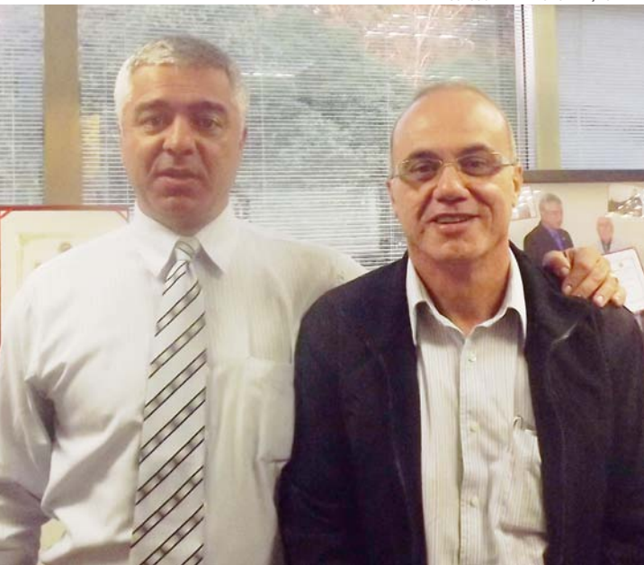
DEPUTADO FEDERAL MAJOR OLÍMPIO E O VEREADOR RICARDO PIORINO

Na última semana, o vereador Ricardo Piorino (PDT) esteve reunido com o Deputado Federal Major Olímpio, da mesma sigla partidária do vereador, ocasião em que o deputado solicitou ao parlamentar a indicação de 10 (dez) escolas da Rede Municipal de Ensino para serem agraciadas com os kits esportivos, oriundos do Ministério do Esporte, do Governo Federal.