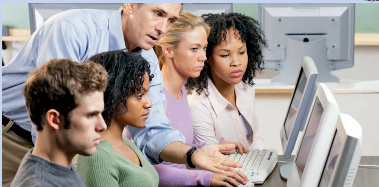
Prazo para o aluno de graduação se inscrever no programa vai até o dia 14 março

O programa tem como objetivo despertar, nos alunos de graduação, a vocação científica, por meio de participação em projetos de ciência, tecnologia e inovação.