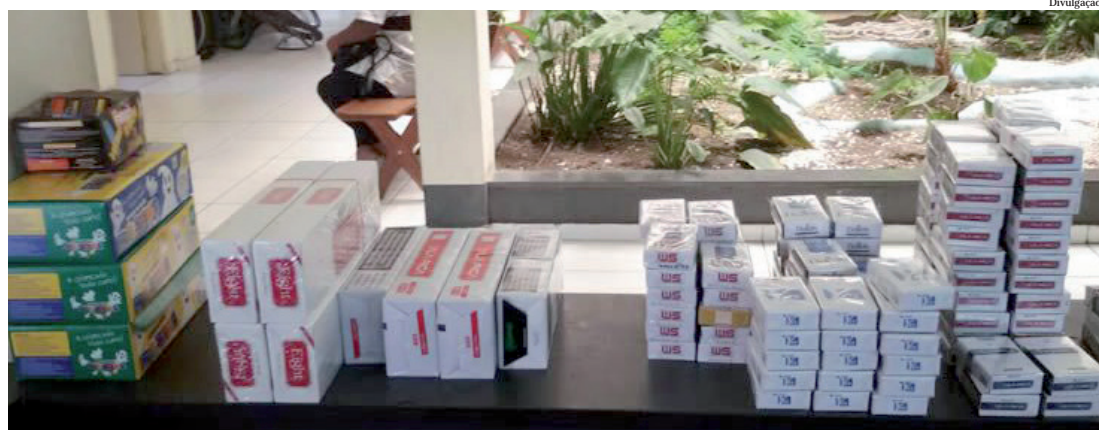
Foram apreendidas caixas de fogos de artifício e pacotes de cigarro falsificados