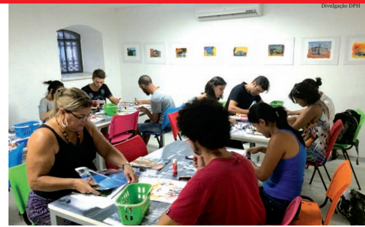
Oficina de arte contemporânea, também realizada em janeiro, integrando a programação do “Férias no Palacete”

Em fevereiro, com o fim do “Férias no Palacete”, outras atrações foram disponibilizadas para a população, como o bate-papo