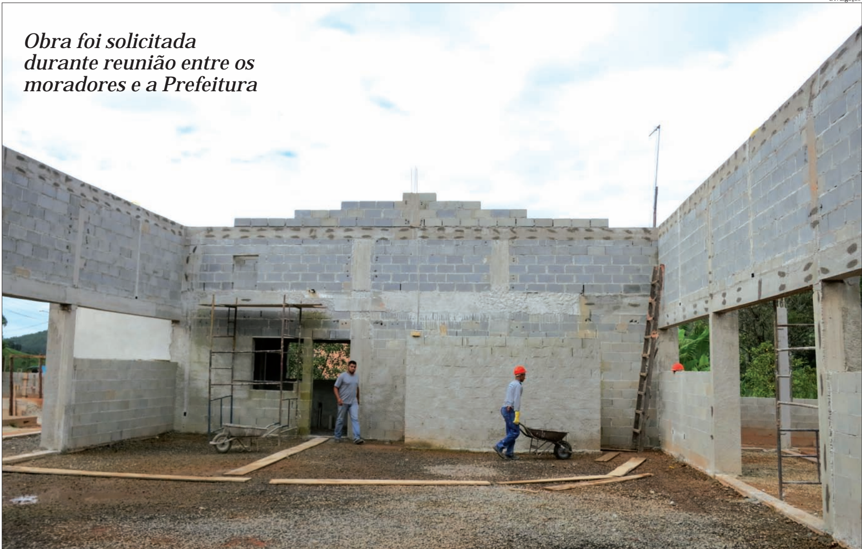
Obra foi solicitada durante reunião entre os moradores e a Prefeitura

INSCRIÇÕES ABERTAS PARA OFICINA DE RECICLAGEM