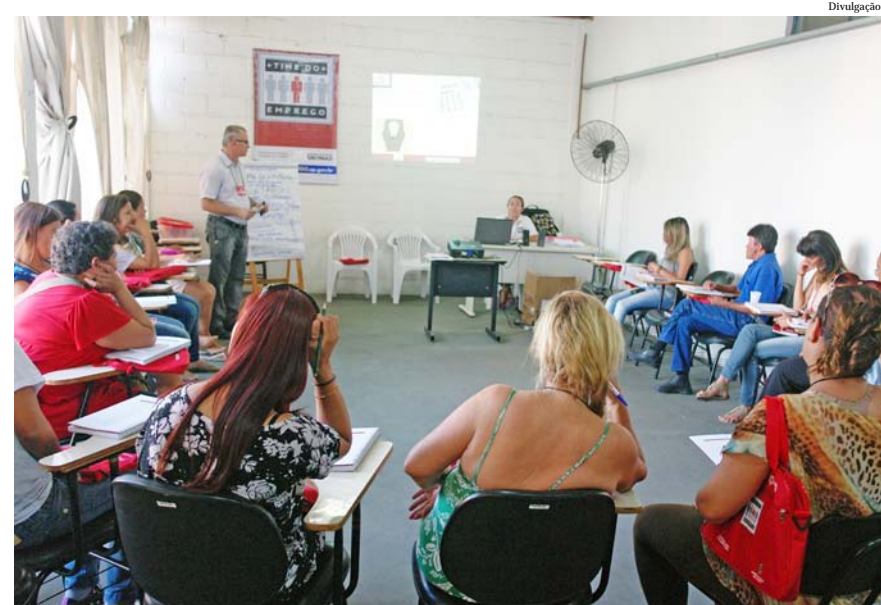
Atividade realizada pelo programa Time do Emprego

Já para o Time do Emprego, programa estadual coordenado pela Sert - Secretaria do Emprego e Relações do Trabalho - desenvolvido em parceria com a Prefeitura de Pindamo-