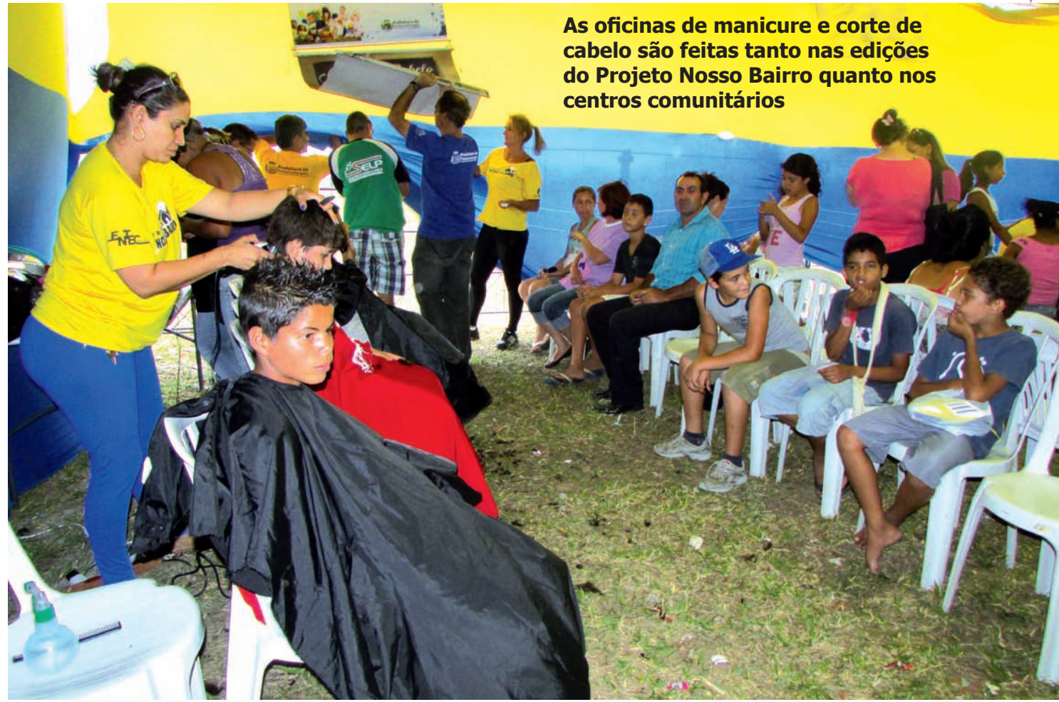
As oficinas de manicure e corte de cabelo são feitas tanto nas edições do Projeto Nosso Bairro quanto nos centros comunitários

As oficinas são uma realização da Prefeitura de Pindamonhangaba, por meio da Secretaria de Governo e Departamento de Turismo.