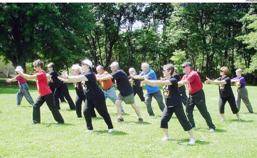
Prática milenar traz diversos benefícios à saúde de seus adeptos

A visitação à Fazenda é aberta ao público. No local, é cobrado estacionamento de R$ 20 para carros e R$ 10 para motos.