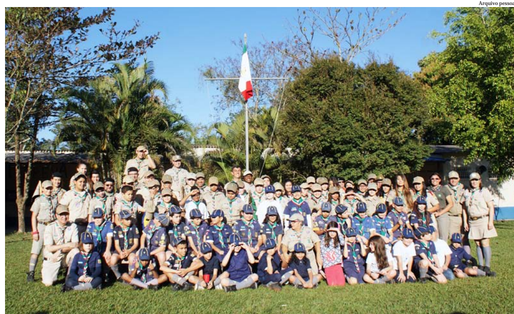
A atividade será na sede da instituição, na manhã de domingo