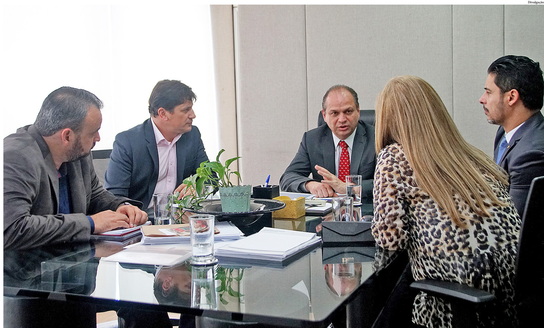
No encontro com o ministro Ricardo Barros, foi reforçado o desejo do município de ter sua própria rede de urgência

“Vamos ter nossa rede de urgência e emergência de qualidade, pois precisamos ter muita responsabilidade neste momen-