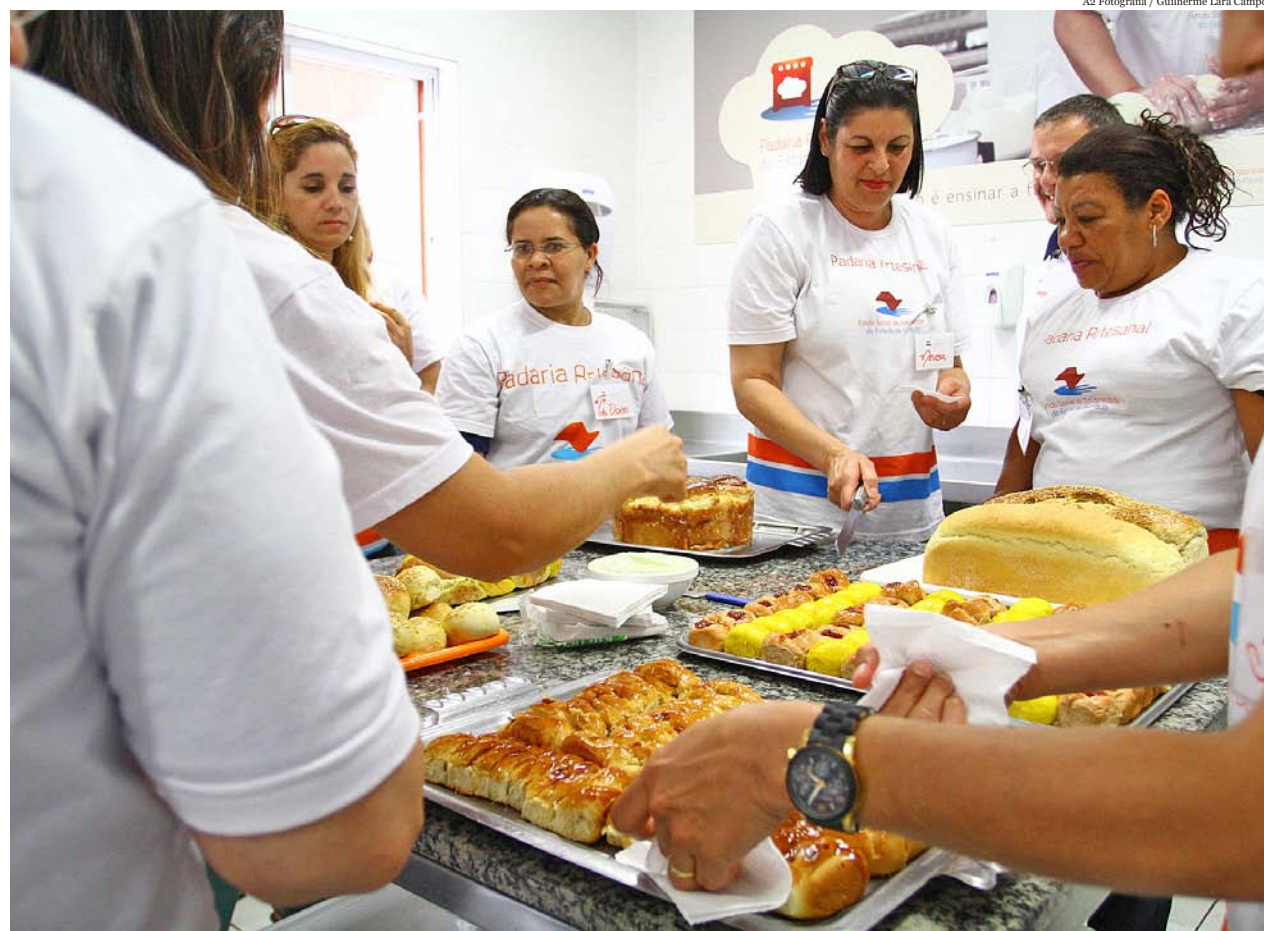
A doação de R$ 50 mil possibilitará a implantação do projeto que oferecerá cursos gratuitos

ro e Promoção e o Serviço de Proteção à Criança, de Taubaté, serão contempladas pelo Fundo. Diversas autoridades locais foram convidadas para acompanhar o evento, que acontece às 11 horas, na sede da instituição.