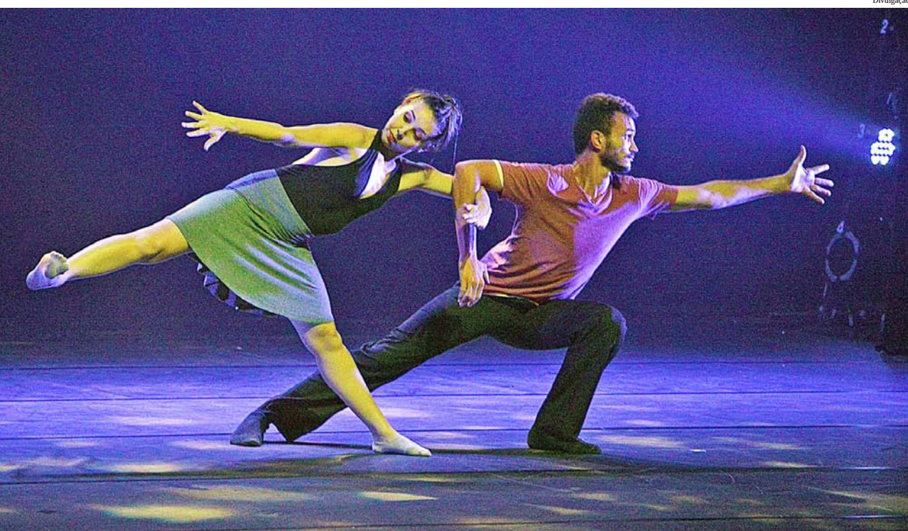
“Colcha de Retalhos” relata o olhar que o homem lança sobre o mundo que o cerca

Pindamonhangaba recebe, neste domingo (19), uma oficina e uma apresentação do Corpo de Baile de Caraguatutuba, no Teatro Galpão. Ambas serão gratuitas e fazem parte da parceria entre a Prefeitura, por meio do Departamento de Cultura, e o Governo do Estado, por meio do Circuito Cultural Paulista.