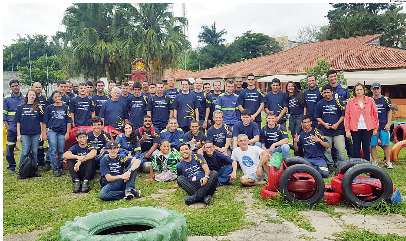
Os voluntários prepararam os canteiros que receberão sementes de hortaliças em breve

Por meio da iniciativa, ainda foi implementada a coleta seletiva e disseminados conceitos como utilização, organização, padronização e disciplina nas salas de aula, contribuindo para garantir um ambiente ainda mais seguro, agradável e produtivo.