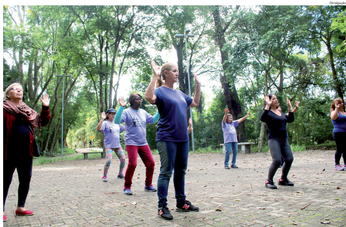
Grupo conta com cerca de 15 participantes que se unem para promover a prevenção e a promoção a saúde

Todas as quartas-feiras às 7h30, o grupo se encontra na ESF Cidade Jardim, realiza uma caminhada pelos bairros mais próximos e pratica o Tai Chi. O grupo conta com uma