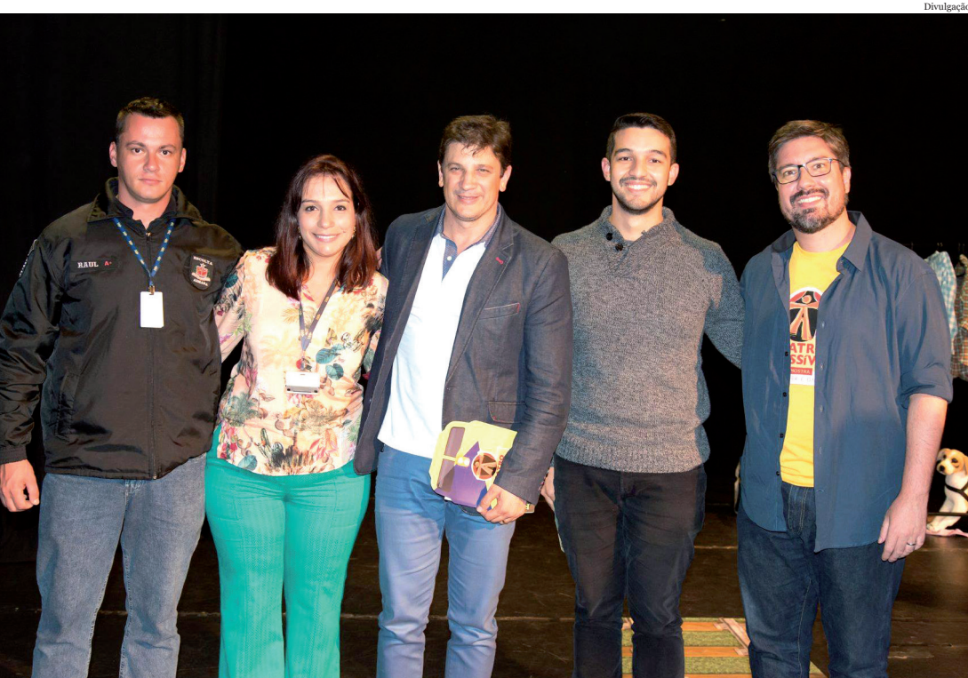
Inclusão e diversidade são temas que precisam ser debatidos constantemente