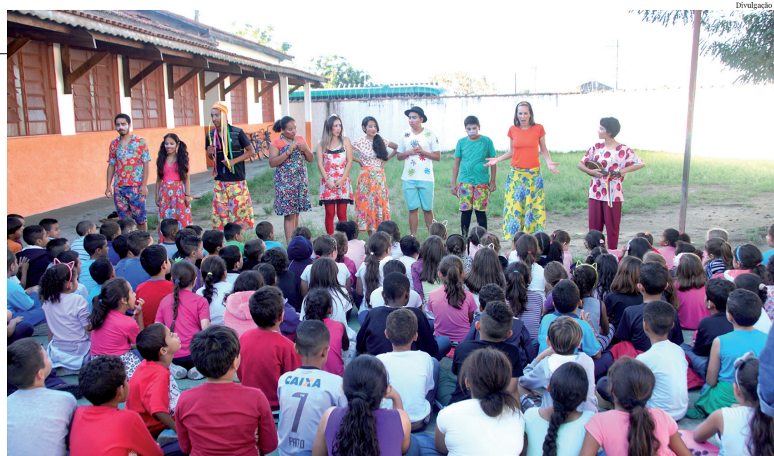
As brincadeiras foram um sucesso entre as crianças da escola Professora Raquel de Aguiar Loberto