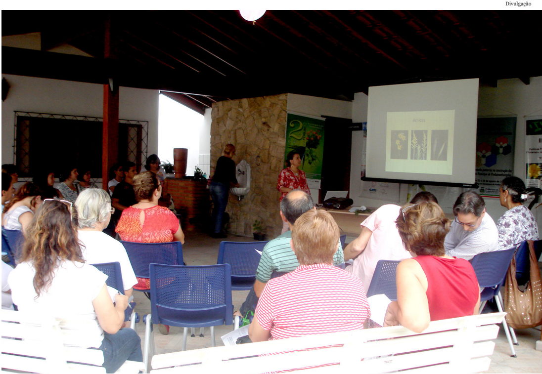
O uso de plantas medicinais é uma forma natural de cuidar de problemas cotidianos

O uso de plantas de forma medicinal é uma tradição que acompanha gerações, e nas eras antepassadas o manuseio deste valioso conhecimento era exclusivo dos mais sábios. Atualmente, a sociedade tem sido adepta a instantaneidade, cada vez mais dependente do uso de medicamentos e esquecendo os valores tradicionais.