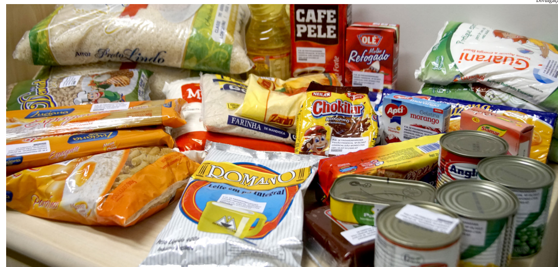
Cesta básica chegará mais cedo para servidores municipais

Outra melhoria que a Prefeitura já havia realizado neste ano foi a contratação da empresa vencedora do Pregão Presencial nº 005/2017, para aquisição de cestas básicas para os servidores, no período de doze meses, a partir de maio. A Comercial João Afonso Ltda. apresentou