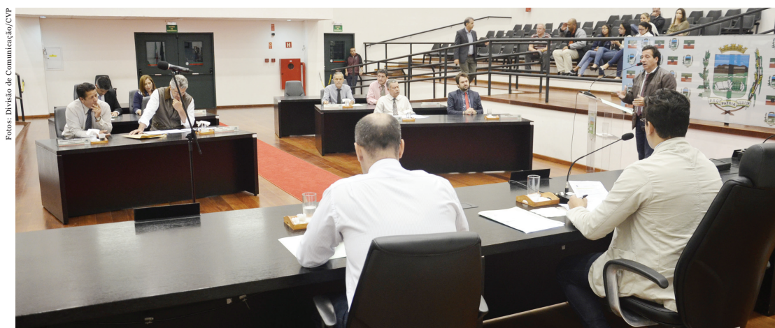
Soberano, plenário confirmou aprovação de área para empresa que vai investir mais de R$ 4,7 milhões em Pindamonhangaba

Com os debates e pronunciamentos fortes, a 17ª Sessão Ordinária realizada nesta segunda-feira, dia 22 de maio, no Plenário “Dr. Francisco Romano de Oliveira” foi considerada tranquila e produtiva com a aprovação de três Projetos de Leis, dos quais um estava relacionado na Ordem do Dia e outros dois que foram incluídos na pauta de votação após os trâmites legais e regimentais. O outro projeto listado na Ordem do Dia que tratava do Programa de Dispensação Gratuita de Medicamentos, também chamado de “Farmácia Solidária” foi adiado pelos vereadores por 30 dias.