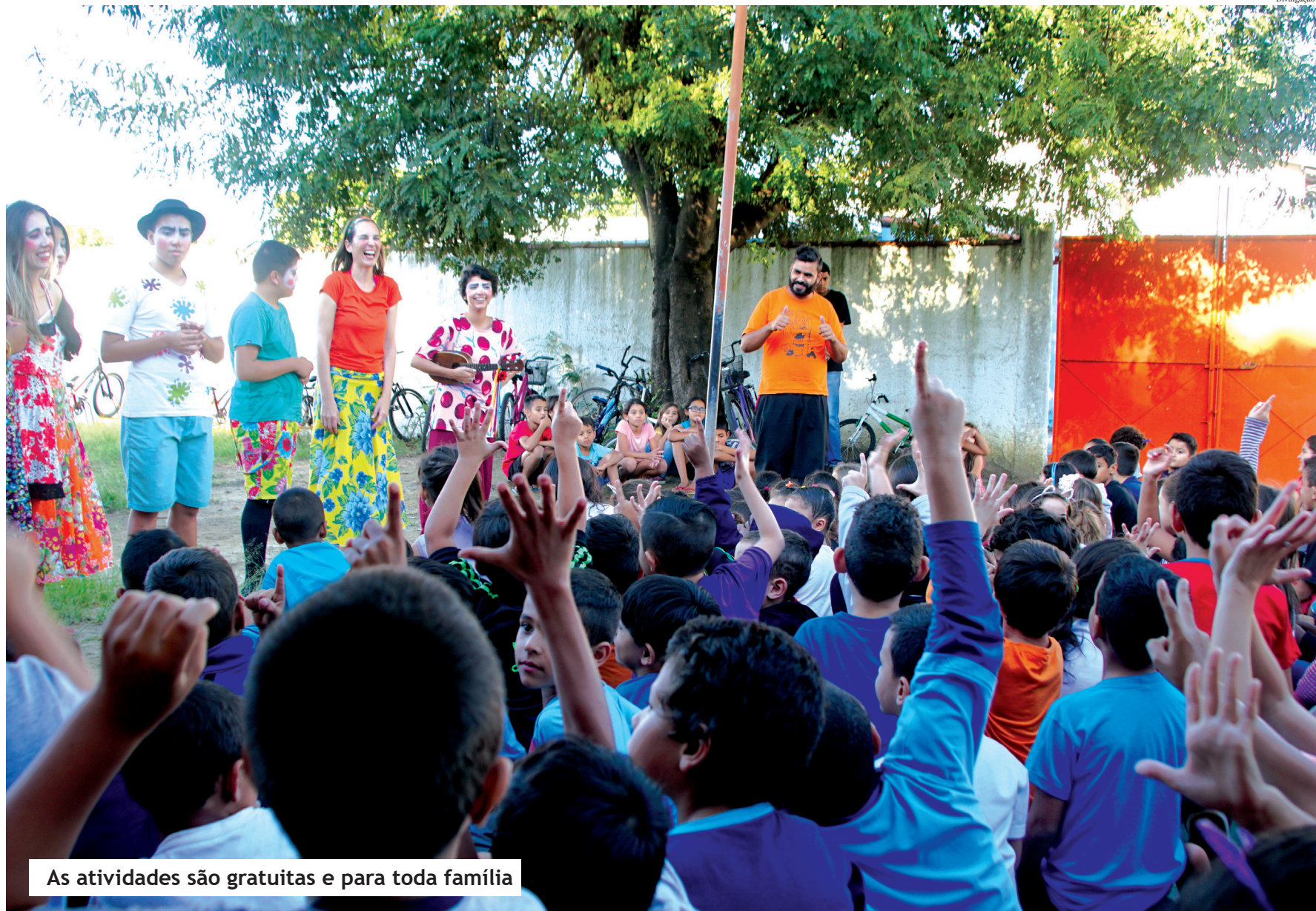
As atividades são gratuitas e para toda família