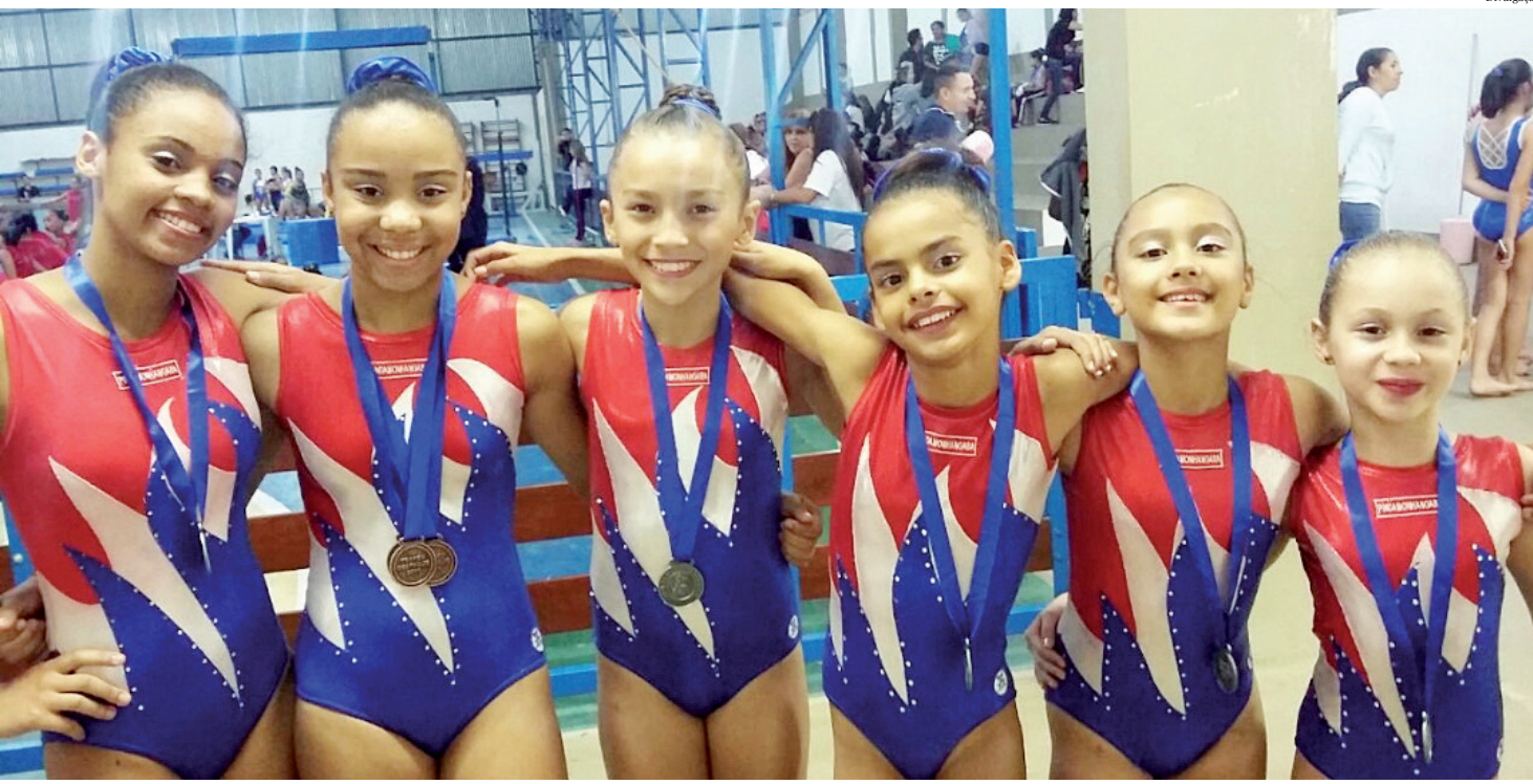
Ginastas brilham na I Etapa Troféu Destaque 2017

A equipe de Ginástica Artística feminina da Semelp - Secretaria Municipal de Esporte e Lazer de Pindamonhangaba - participou, no dia 20 de maio, da I Etapa do Troféu Destaque da modalidade, realizado em Bragança Paulista.