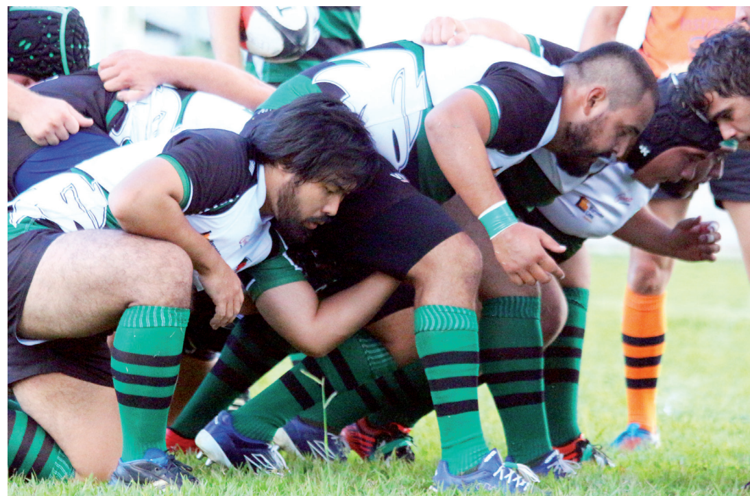
Time de rugby Leões do Vale busca a terceira vitória no Campeonato Paulista de Desenvolvimento