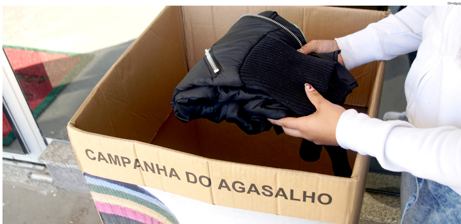
“Roupa Boa, a Gente Doa”

Na sexta-feira (26), a equipe de arrecadação passará, com carro de som e caminhão de coleta, nos bairros: Jardim Cristina, Campo Alegre, Parque São Domingos, Jardim Roseli, Parque Ipê, Santa Luzia e Vila Prado.