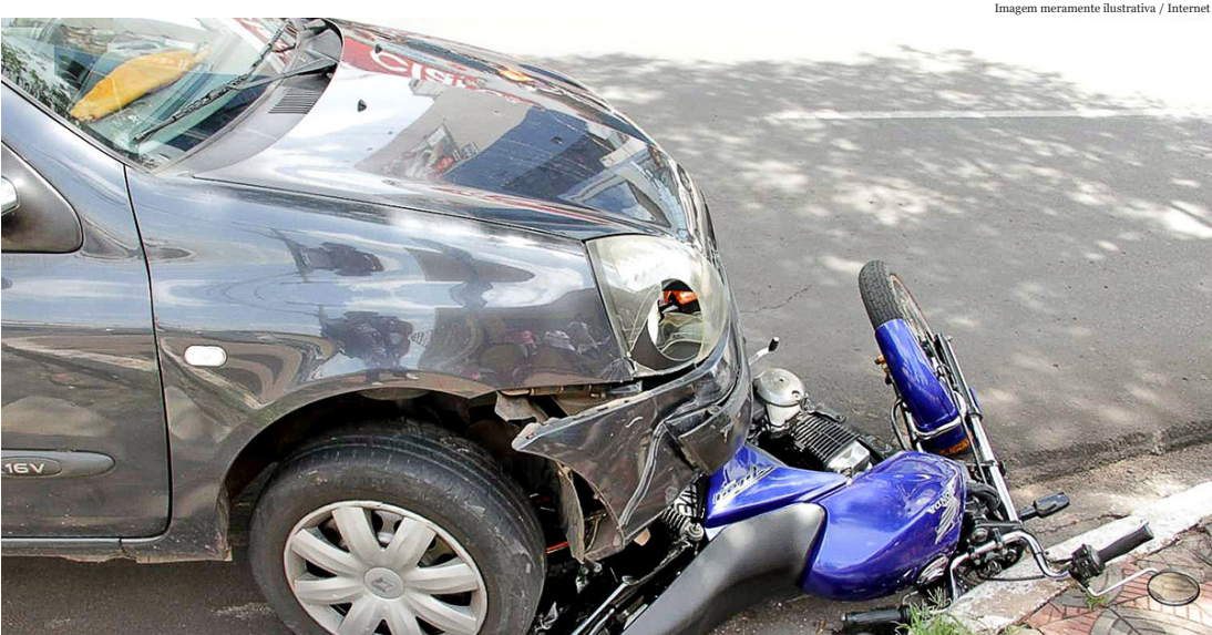
Imagem meramente ilustrativa

Já para os acidentes com vítimas, que incluem também ocorrências sem fatalidades, houve redução de 5,2% no semestre, com 4.934 casos a menos (89.273 em 2017 e 94.207 em 2016). Em junho foram 15.897 ocorrências, com redução de 1%.