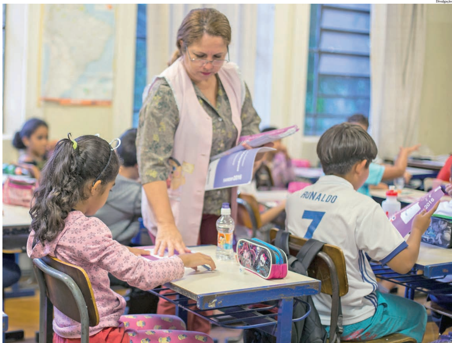
Os novos docentes farão parte do quadro da Secretaria Estadual de Educação

A ideia é realizar um evento muito bem organizado, que agrade tanto as pessoas que vêm de outras cidades, quanto os moradores de Pindamonhangaba.