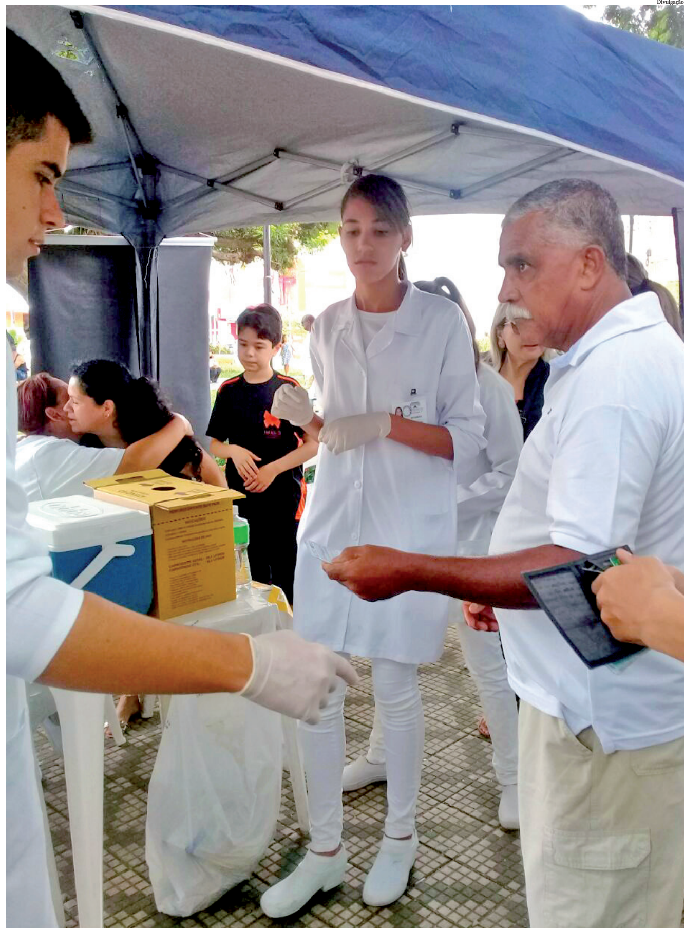
Somente no último fim de semana mais de 1.300 pessoas foram imunizadas