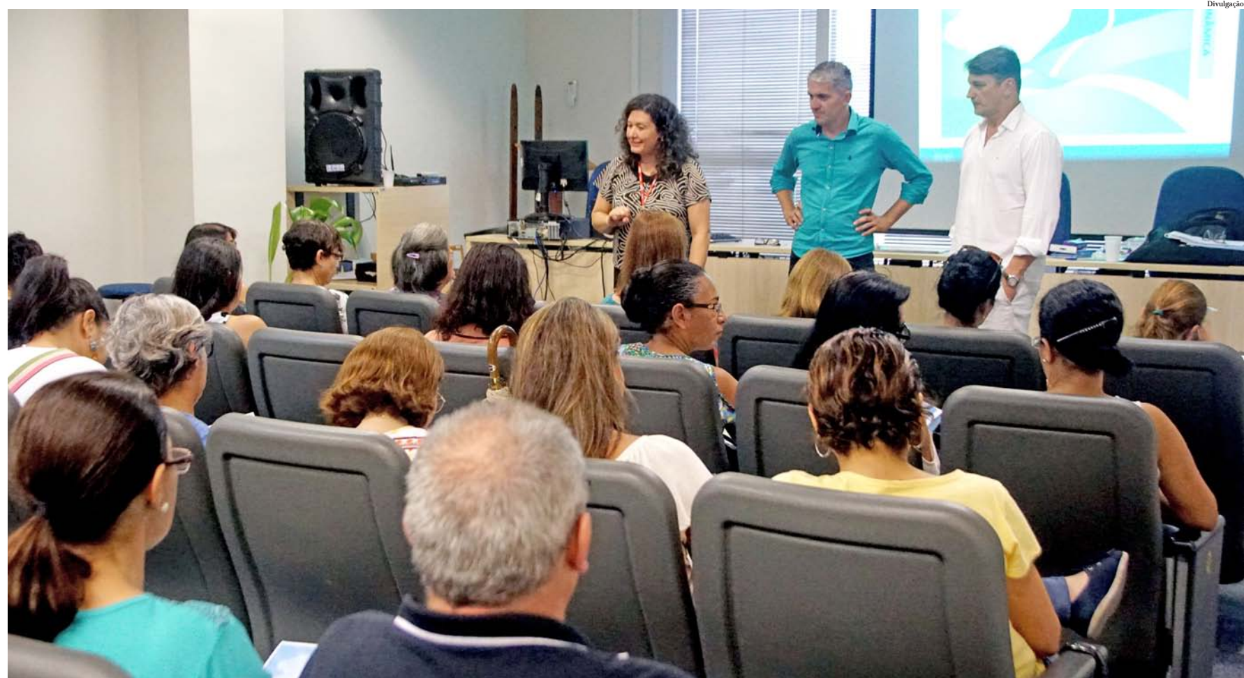
Os cursos de capacitação irão agregar ao currículo dos artesãos do município

Com a parceria que acontece de março a novembro, serão oferecidos 40 cursos voltados para o artesanato, sendo 10 para