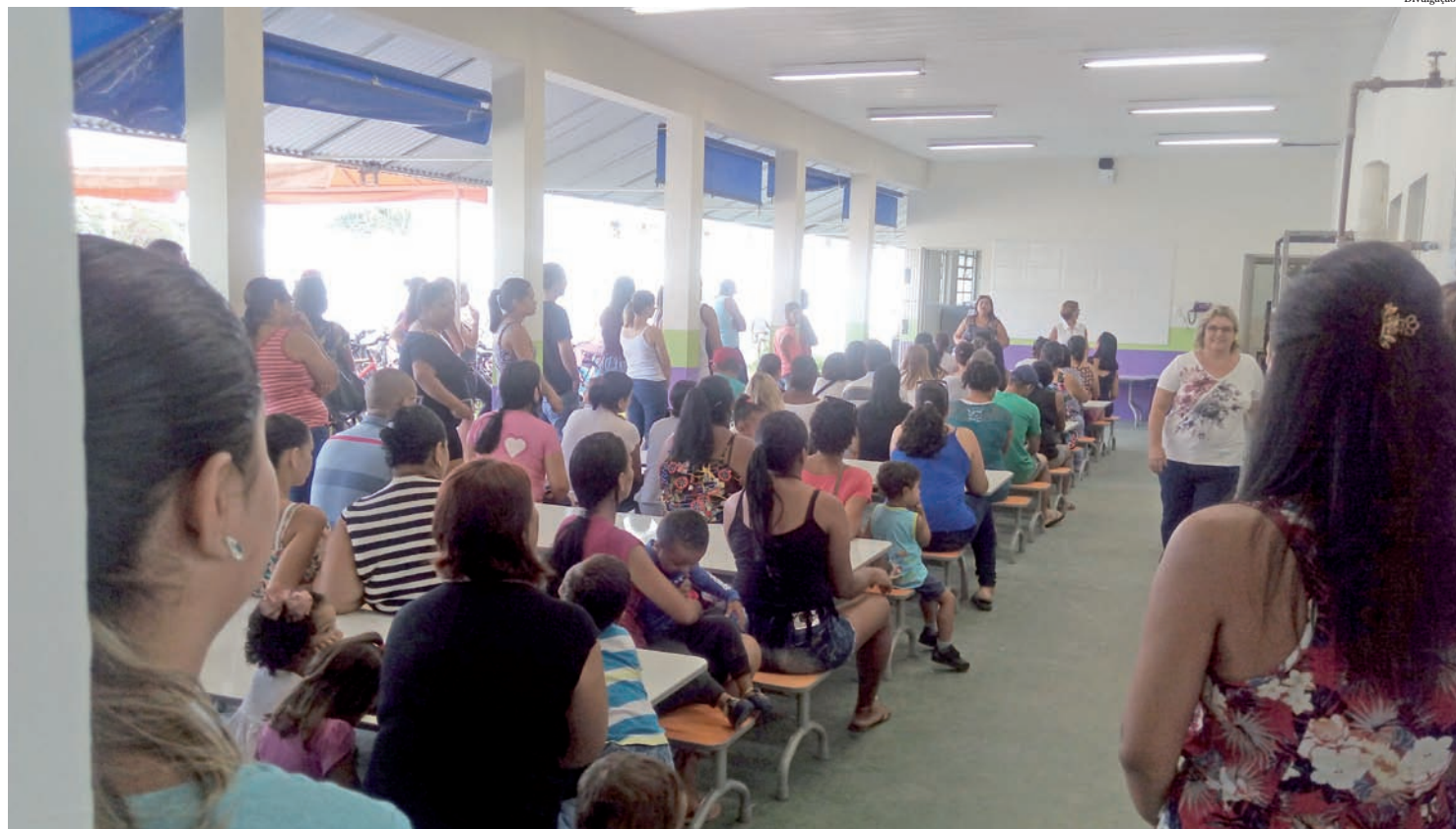
A comunidade mostrou interesse em participar da vida escolar das crianças