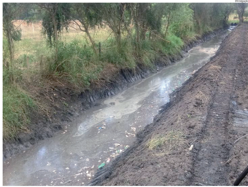
Evitar descarte de entulhos contribui para manutenção dos serviços

De acordo com a Secretaria Municipal de Serviços Públicos, conforme o previsto em cronograma de serviços, já foi iniciada também a limpeza no Ribeirão do Curtume.