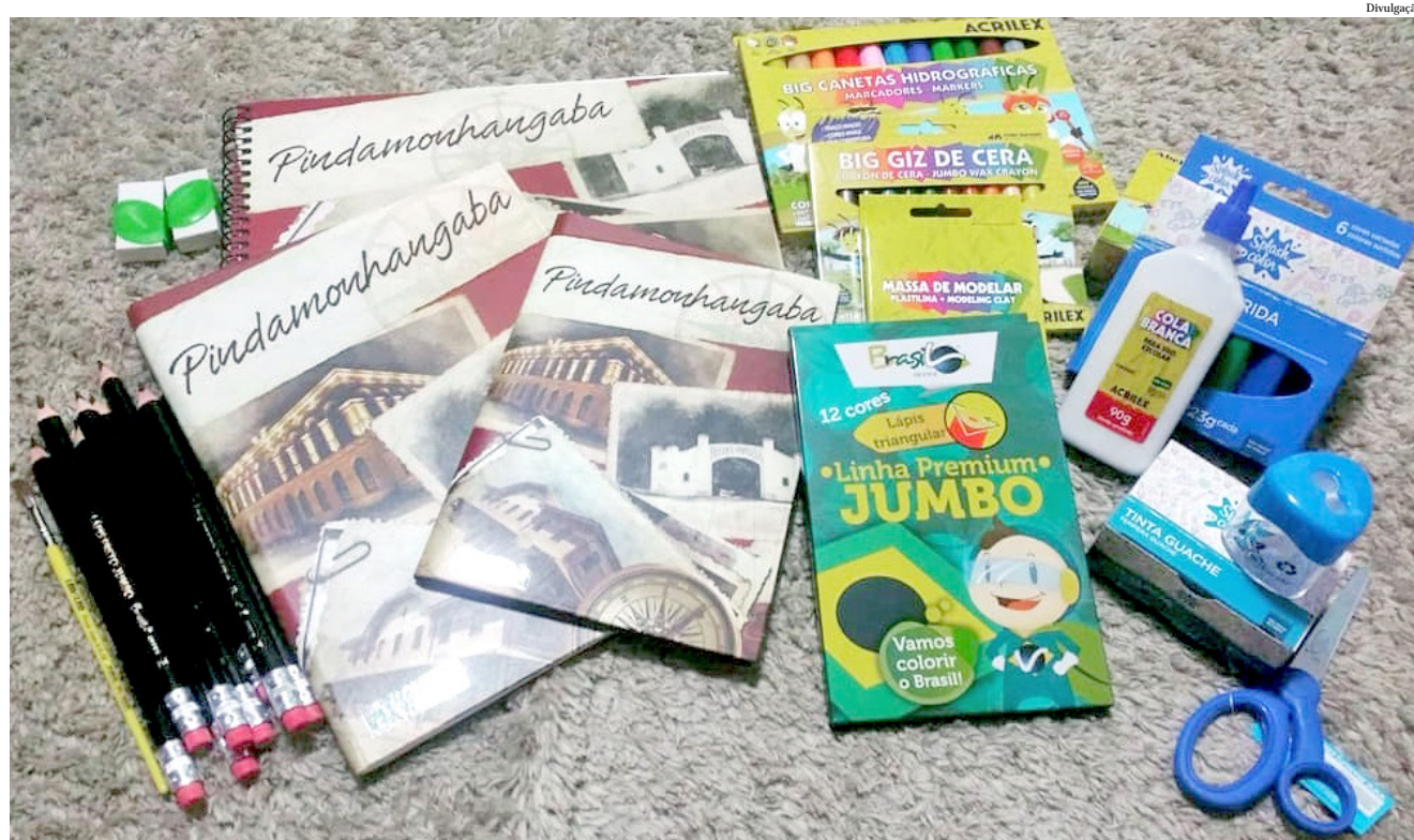
Pais destacam qualidade dos kits, que ainda valorizam pontos turísticos da cidade