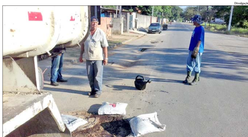
Devido às fortes chuvas ocorridas no mês de março, a operação é intensificada pois as chuvas intensas fazem com que haja o surgimento de buracos nas ruas

As atividades realizadas pela Prefeitura de Pindamonhangaba, não são feitas em dias chuvosos, pois isso pode danificar o resultado do tra-