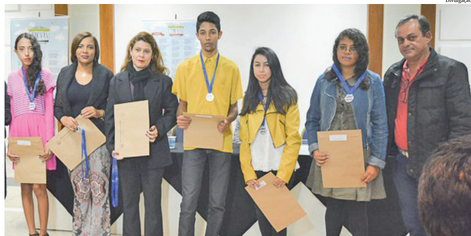
O Juventrova conta com a participação dos alunos e seus professores

Realização. UBT – Pindamonhangaba (União Brasileira de Trovadores); Prefeitura Municipal (Secretaria de Educação e Cultura/ Departamento de Educação e Cultura/ Biblioteca Vereador Rômulo Campos D’Arace); Fundação Dr. João Romeiro – Jornal Tribuna do Norte.