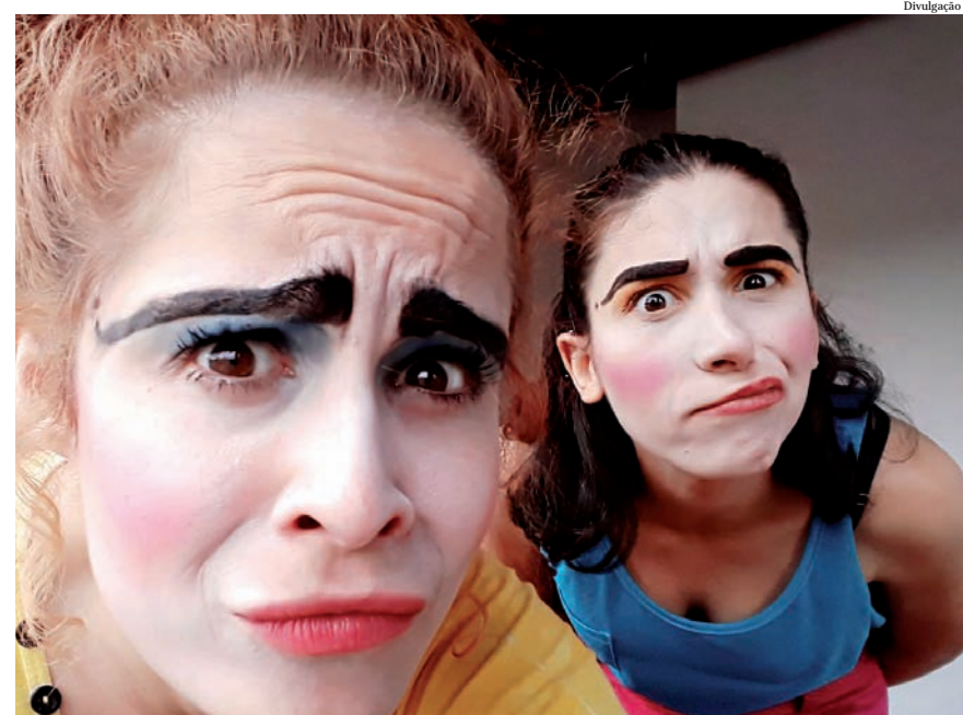
A apresentação "Dengue: em busca da solução perfeita", da Severina Cia de Teatro, faz parte da programação

Escola Prof a Gilda Piorini Molica - 10h30 Eu não quero um mundo imundo!