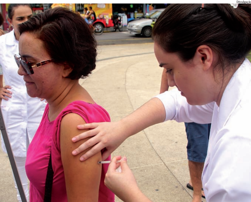
O ônibus "No Caminho da Saúde" facilita o acesso à vacina

nho para a população de Pindamonhangaba", avaliou.