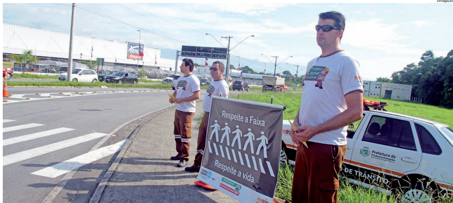
Respeitar o pedestre é respeitar a vida. Não dar preferência é infração gravíssima

O pedestre deve ter prioridade na travessia mas também deve certificar-se se o motorista conseguiu visualizá-lo antes de iniciar a travessia. Deixar de dar preferência ao pedestre constitui infração gravíssima, punida com multa no valor de R$ 293,47.