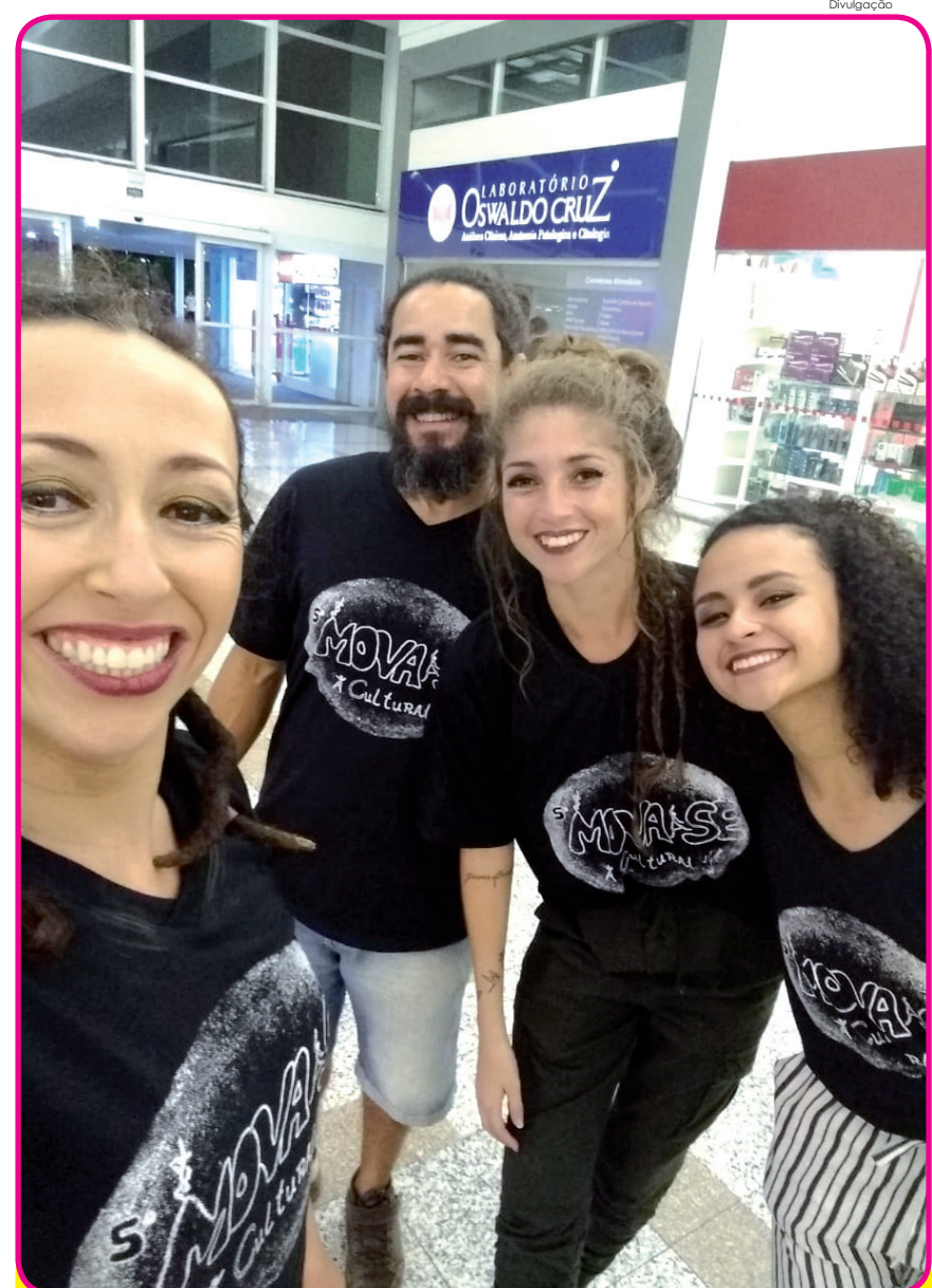
Equipe trabalhou na organização e produção do "Mova Se Cultural"