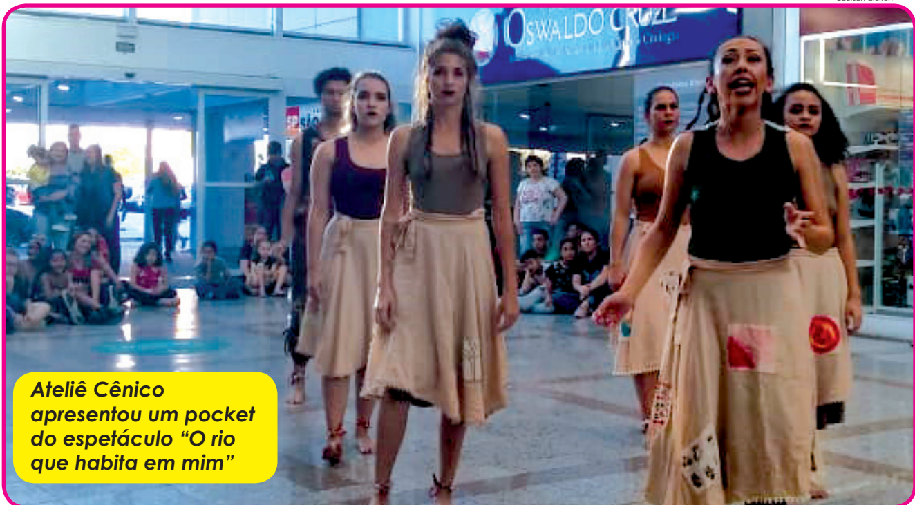
Ateliê Cênico apresentou um pocket do espetáculo "O rio que habita em mim"

Última atividade comemorativa da instituição foi a quinta edição do "Mova Se Cultural"