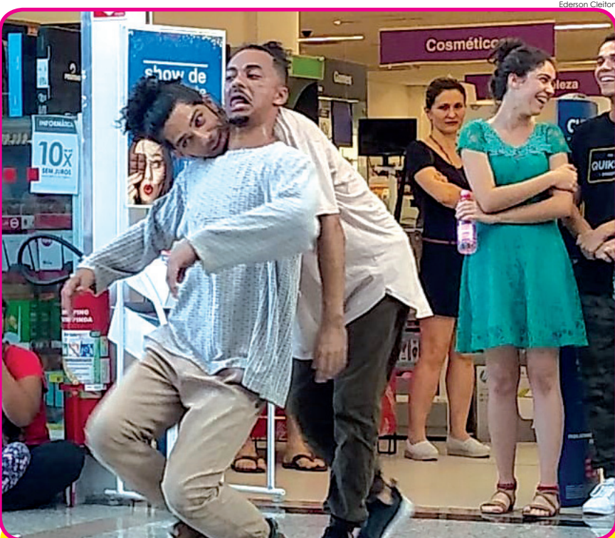
"Quase Colo" foi a apresentação do Grupo Zumb.boys