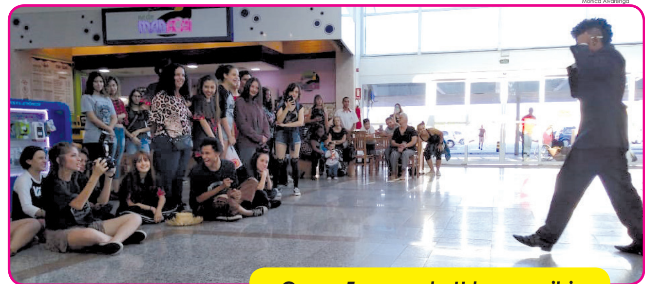
Grupo Fragmento Urbano exibiu o "Breaking de Repente"