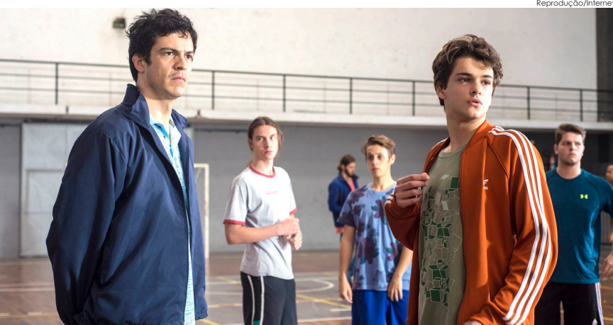
Filme nacional “Benzinho” terá duas sessões na Vila S. Benedito