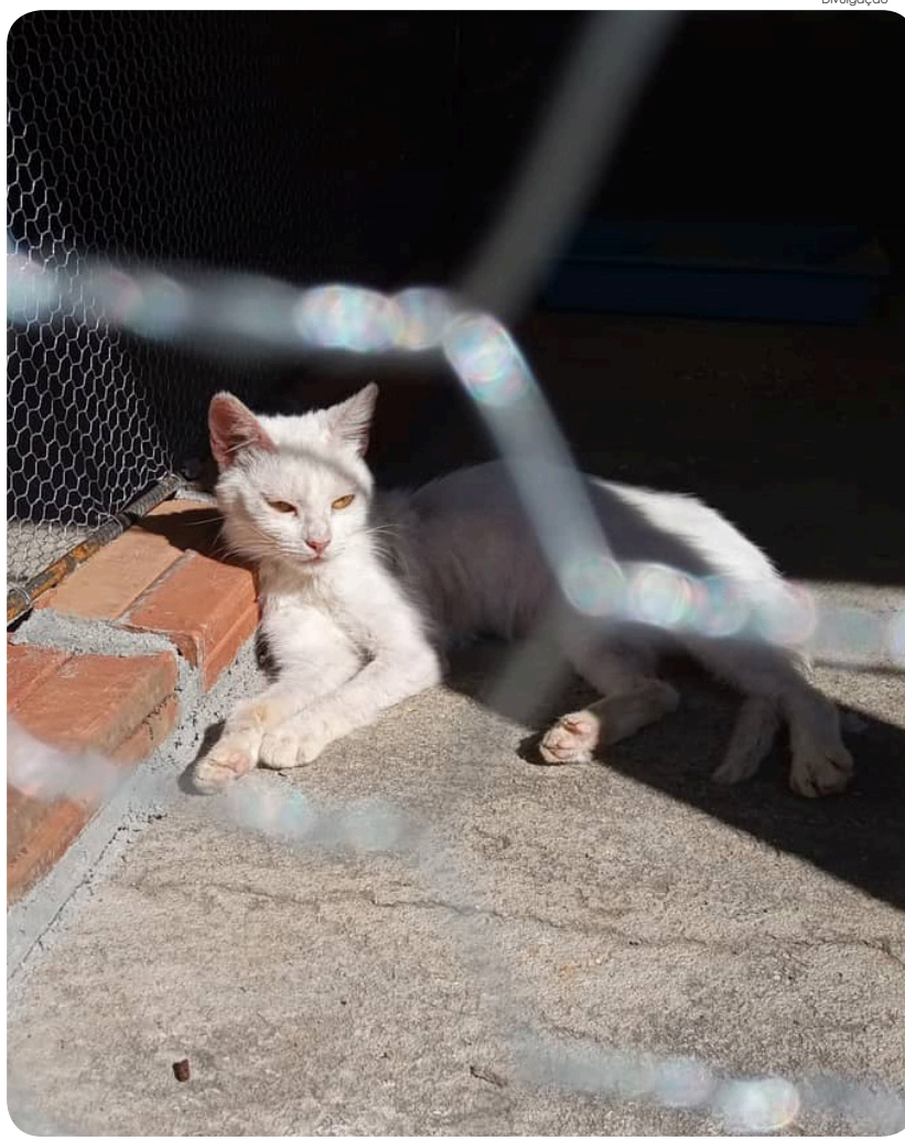
Gatil do local ganhou adaptação e solário

O Abrigo Municipal tem recebido diversas melhorias nos últimos meses. Foi realizada uma adequação no gatil para que os gatos pudessem ter mais qualidade de vida em sua estada no local. Também foi construído um solário para que os felinos possam fazer o que tanto gostam: tomar sol. Com isso, eles ficam saudáveis e felizes à espera de uma família.