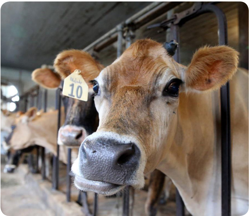
Festa terá exposição e vendas de animais na próxima semana

Evento organizado pelo Sindicato Rural reunirá produtores, expositores e público ainda neste mês