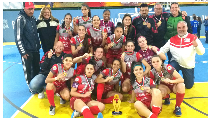
Equipe conseguiu classificação por ser campeã dos “Regionais”

O técnico explica que com essa conquista Pindamonhangaba consolida o bom trabalho desenvolvido pela comissão técnica, diretoria