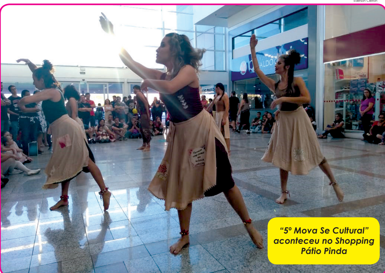
"5º Mova Se Cultural" aconteceu no Shopping Pátio Pinda