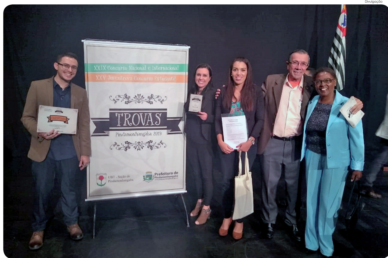
Comissão da Unidade Prisional Feminina de Tremembé prestigiou a solenidade representando uma aluna daquela unidade, vencedora do concurso

Para ambos os temas houve 15 premiações, sendo 5 menções