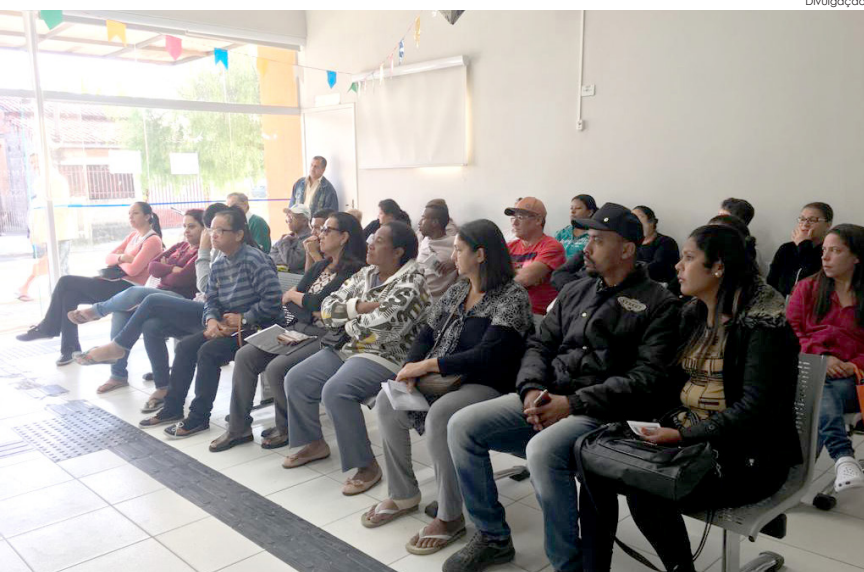
Conscientização sobre a doença faz parte da campanha "Julho Amarelo"

No Azeredo, além da palestra houve, também, o teste rápido que possibilita a identificação da doença. A Secretaria de Saúde da Prefeitura ainda realizou, na sexta-feira (26), uma ação também de prevenção na praça Monsenhor Marcondes, para conscientização e detecção da doença.