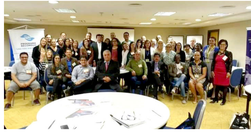
Pindenses se reúnem com representantes de outras seis cidades

As cidades que também participam do evento são: Cruzeiro, Itanhaém, Jabaquara, Jacaré, São José dos Campos e Sorocaba. O objetivo do projeto é treinar lideranças para construir uma Coalizão Comunitária de Prevenção às drogas em suas cidades. Pindamonhangaba é referência no Brasil, comemorando 10 anos de implantação desta