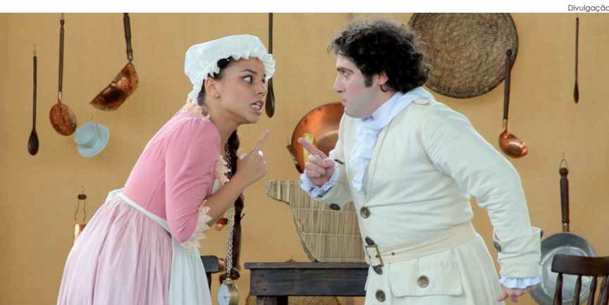
Espectáculo "A Criada Patroa" visitará unidades educacionais em agosto

A ópera é um gênero artístico, inventado no fim do século XVI, que consiste fundamentalmente num drama encenado com música. A história da peça "A Criada Patroa" é inspirada na brilhante ópera cômica La Serva Padrona, do autor italiano Giovanni Battista Pergolesi, escrita em 1733.