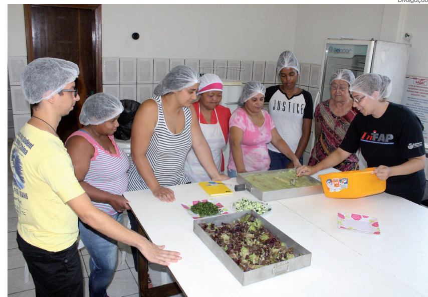
Oficina de culinária funcional ocorrerá no centro comunitário do Andrade

Os encontros de culinária funcional começarão na segunda-feira (5), das 13 às 18 horas, no centro comunitário