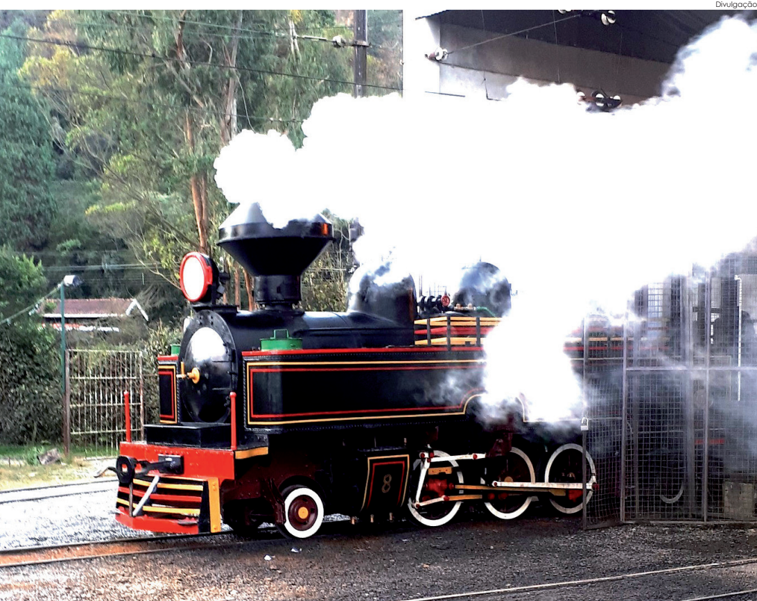
“Maria-Fumaça” percorre trecho de 4 km em Campos do Jordão

Locomotiva a vapor circula entre as estações Emílio Ribas e Abernèssia e tem quatro saídas por dia aos sábados, domingos e feriados