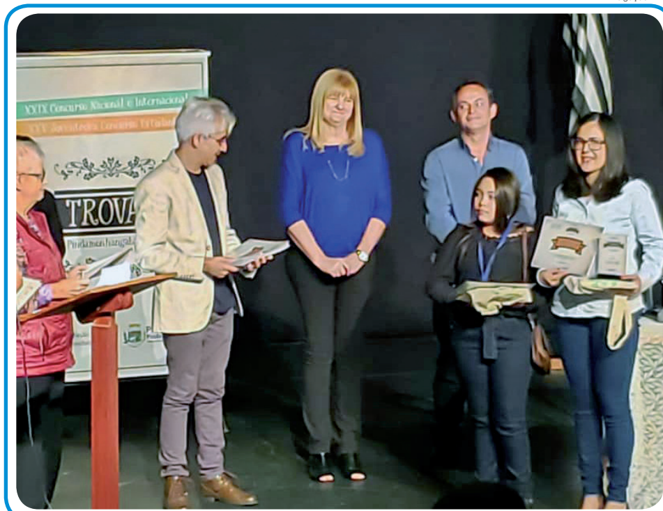
Alunos de 19 escolas foram laureados no XXV Juventrova