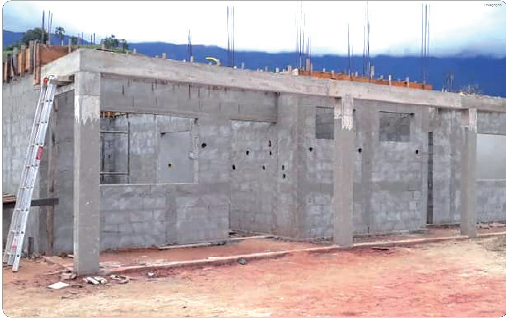
Unidade terá consultórios, salas de curativos e de reunião, área de serviço, entre outras

Além do posto do Ribeirão Grande, várias regiões da cidade estão recebendo reforma ou construção de unidades de saúde, como o Crispim e o Jardim Eloyna, que têm previsão de inauguração ainda para este ano. As ações mostram a preocupação da administração municipal em oferecer uma melhor estrutura para o atendimento da saúde na cidade.