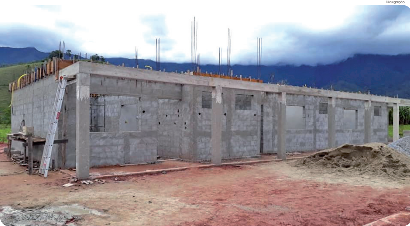
Previsão de entrega da obra é no início do próximo ano