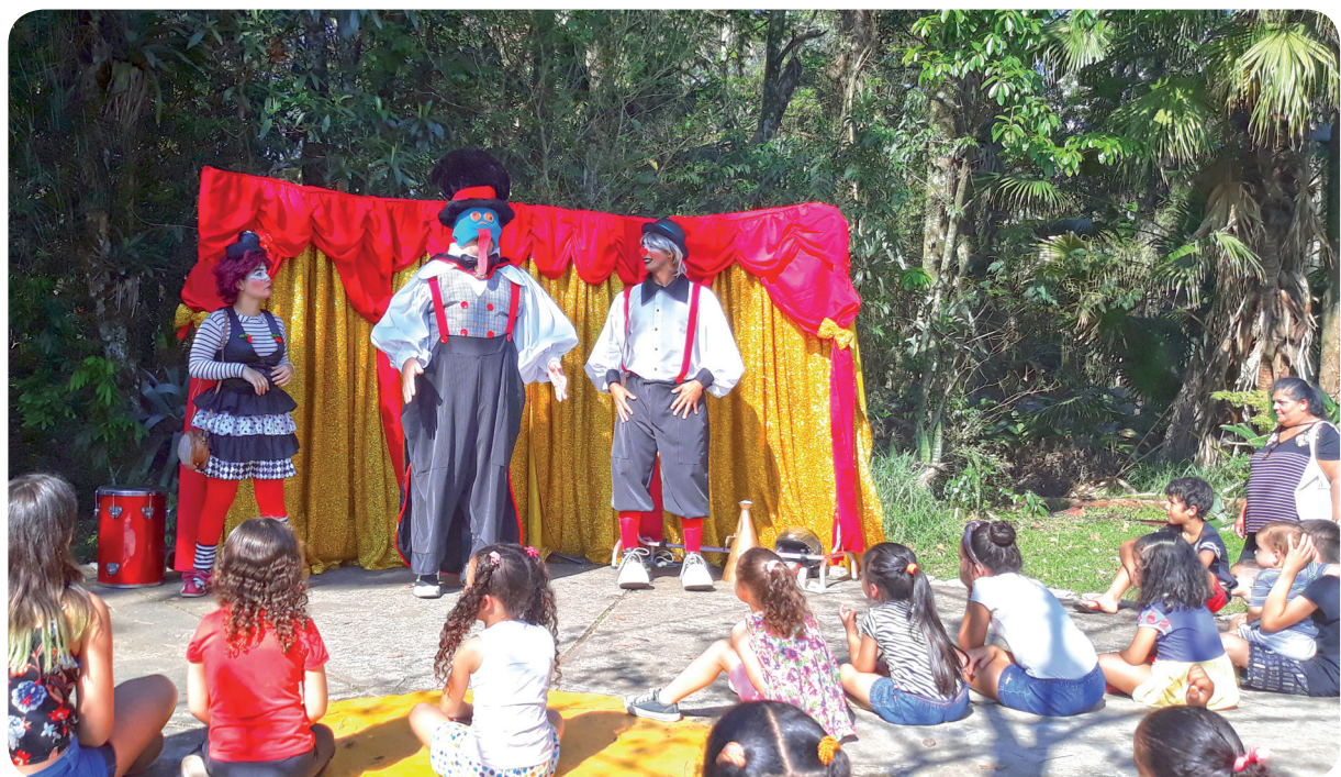
Apresentações teatrais encantaram as crianças