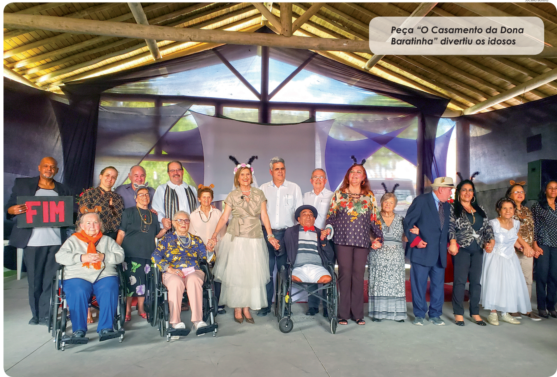
Peça “O Casamento da Dona Baratinha” divertiu os idosos