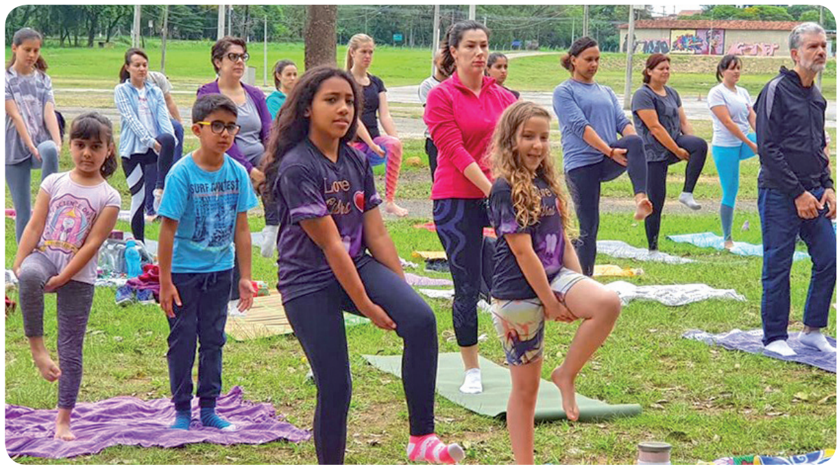
"Yoga Inclusiva" conscientiza sobre deficiência auditiva

"Além de divulgarmos as oficinas e os cursos do 'Reinvente', o 'Café' já virou um evento tradicional na cidade. Por onde passamos as pessoas perguntam quando acontecerá novamente o 'Café'. Para nós, é motivo de muita alegria e de satisfação, pois o evento reúne famílias, amigos, jovens, crianças e idosos em um ambiente acolhedor e humanizado, em meio à natureza!"