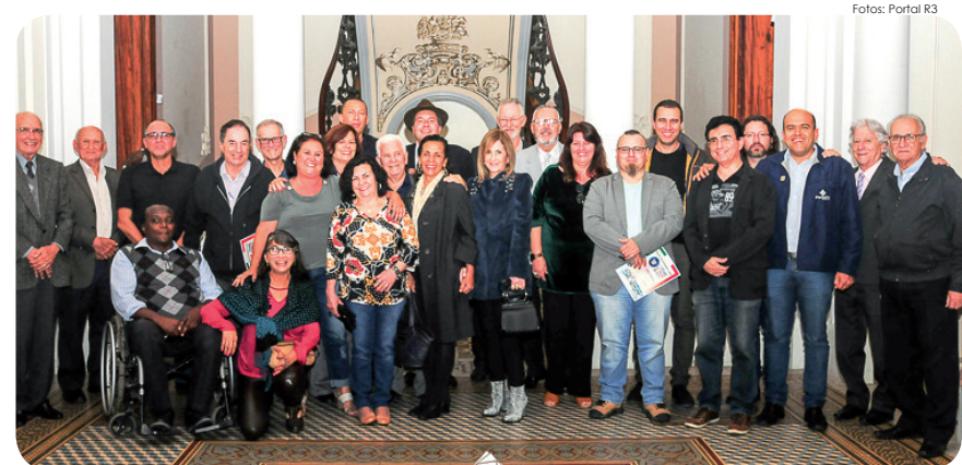
Acadêmicos que foram prestigiar a plenária solene do mês de setembro

Na última sexta-feira (27), o Palacete 10 de Julho foi iluminado com a realização da sessão plenária solene da APL-Academia Pindamonhangabense de Letras. Confira alguns momentos da animada noite cultural que brindou a chegada da primavera, fotos do Portal R3, jornalista e acadêmico Luis Claudio Antunes: