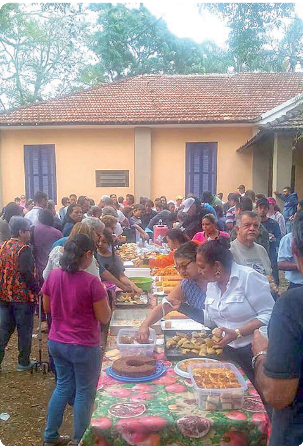
São oferecidos produtos feitos nas oficinas de culinária saudável e panificação do Fundo Social