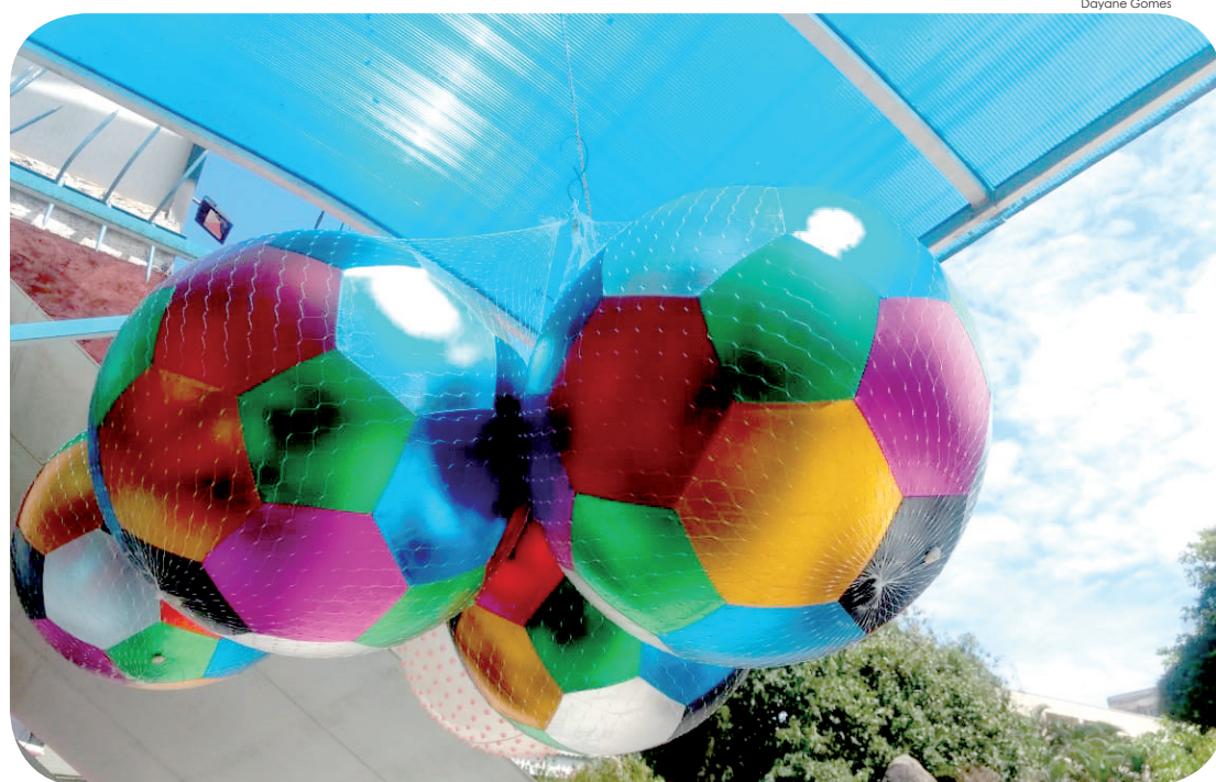
Brinquedos são os artigos mais procurados nesta época

A loja Sodiê Doces realiza a troca de um brinquedo por uma fatia de bolo em prol do "Dia das Crianças". Com o tema "Para toda criança comemorar um mundo mais doce", o trabalho institucional da confeitaria acontece em todas as unidades da franquia, inclusive a de Pindamonhangaba. Cada cliente que doar um brinquedo novo ou usado em bom estado ganha um pedaço de bolo de até 100 gramas de qualquer sabor da linha tradicional. As doações são recebidas até o dia 12 de outubro.