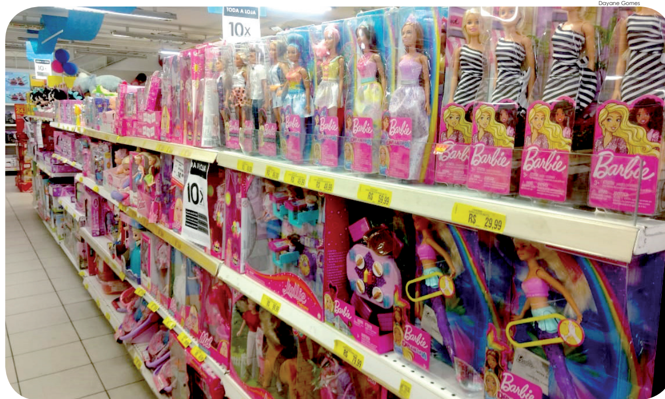
Lojas de Pinda esperam um crescimento de 3 a 4% nas vendas