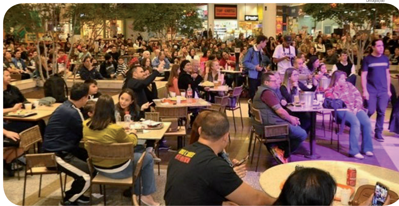
Fluxo de pessoas deve aumentar em 30% no Shopping Pátio Pinda