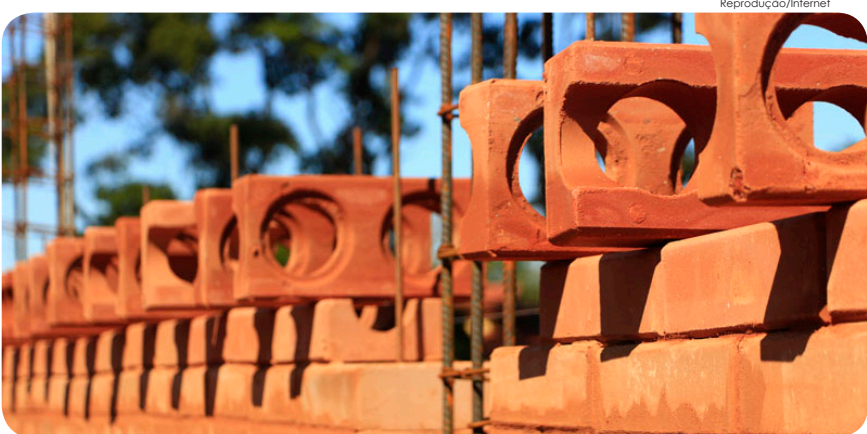
A programação é abrangente e conta, na terça-feira (15), com uma oficina de tijolos ecológicos

Para os interessados em participar, basta comparecer na unidade, que fica na avenida Nossa Senhora do Bom Sucesso, 3.344, no Campo Alegre.