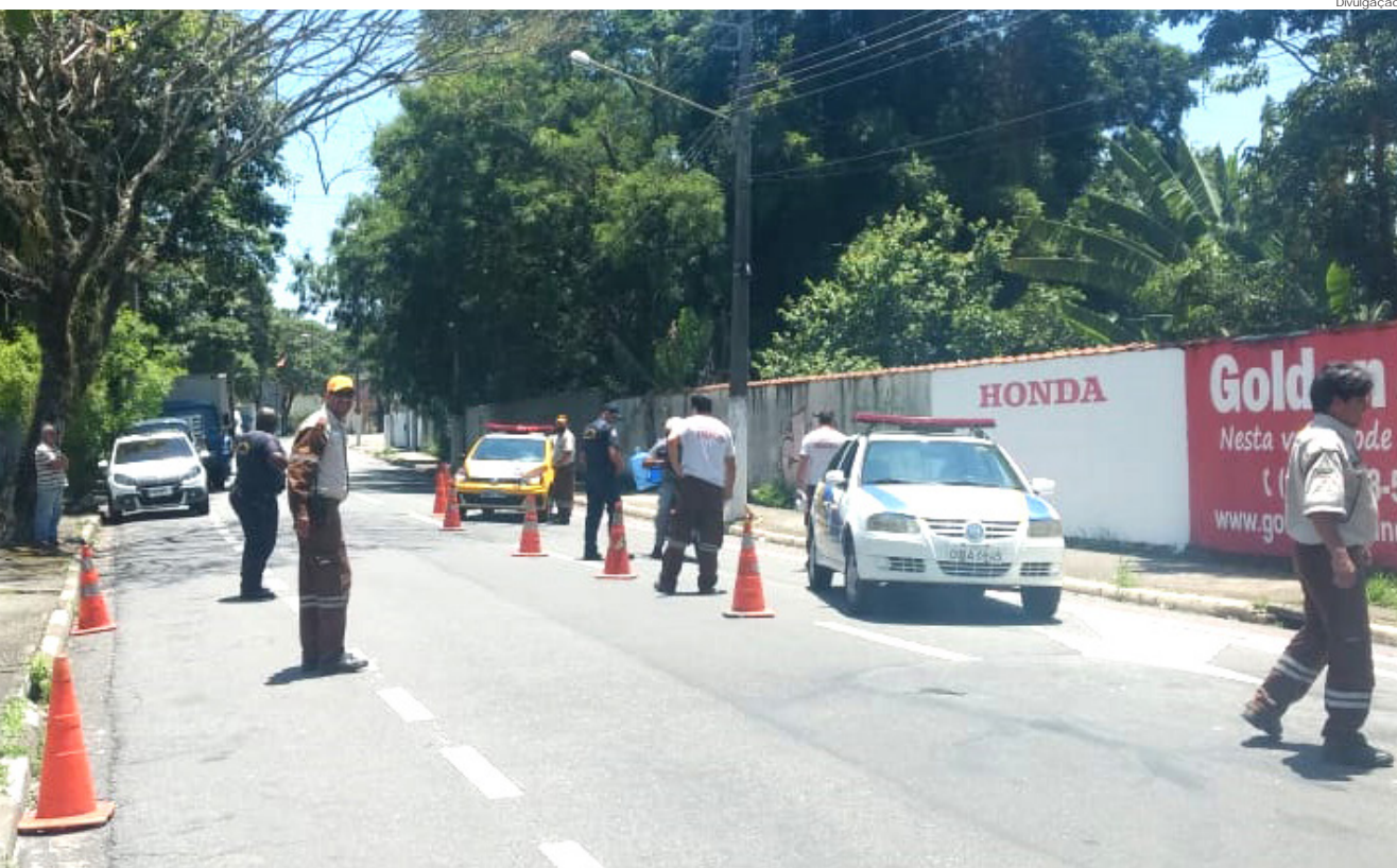
Diversos locais recebem blitzes, entre eles, a via Expressa