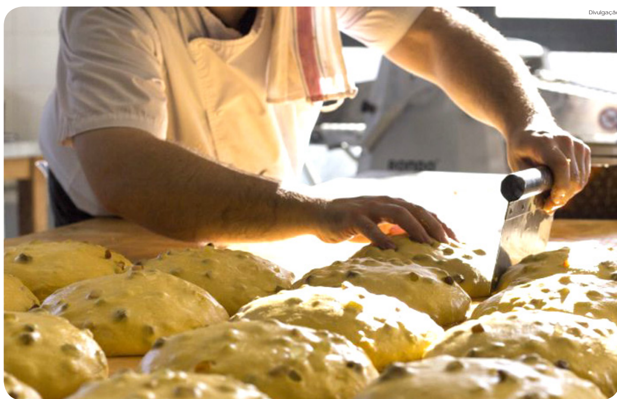
Guloseimas podem contribuir para renda extra no fim do ano

As inscrições para esta oficina gratuita serão apenas nesta quinta-feira, dia 28, no Fundo Social de Solidariedade. As aulas já começam na segunda-feira, dia 2. Todas as informações devem ser obtidas no 3643-2223.