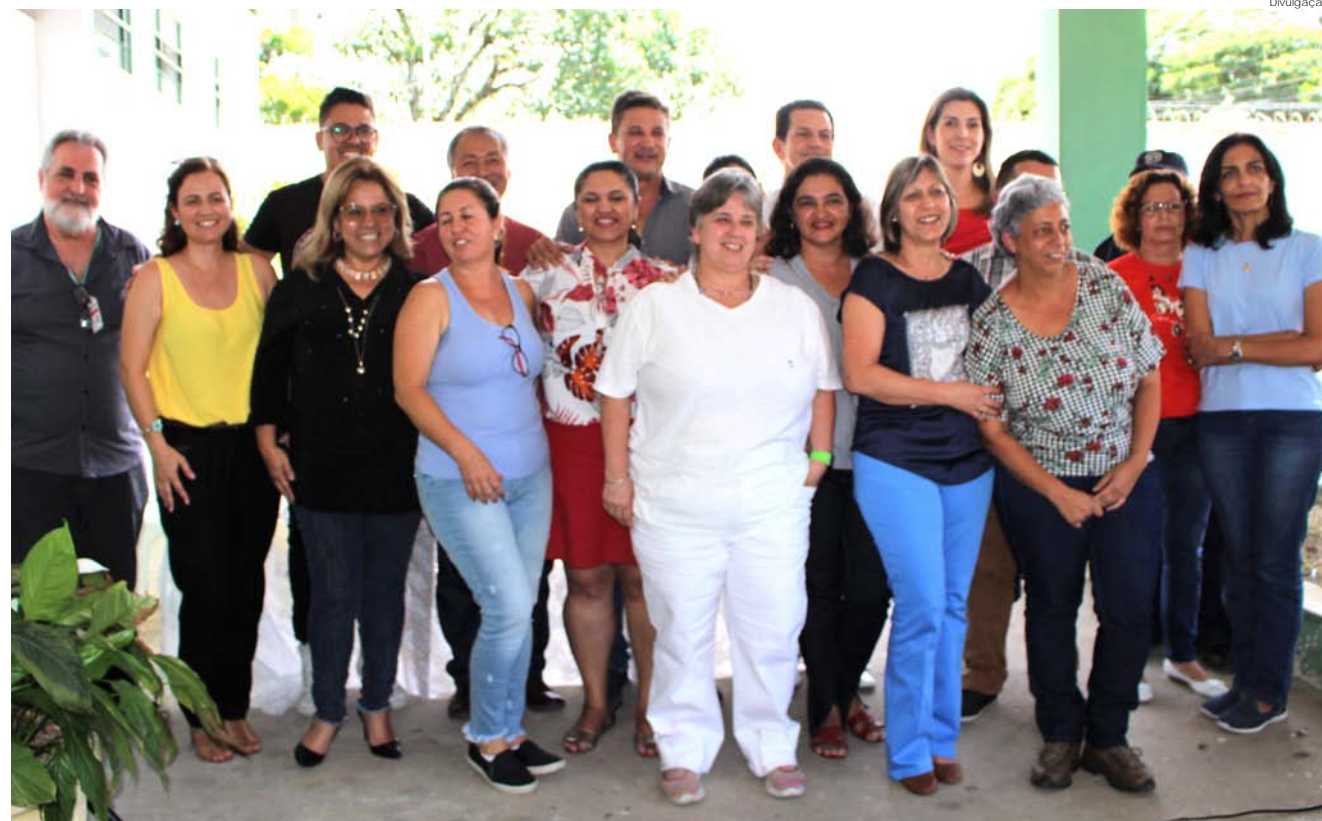
Autoridades presentes à solenidade. Obra prevê troca total do piso e do telhado, troca de todas as portas e todas as louças sanitárias e metais