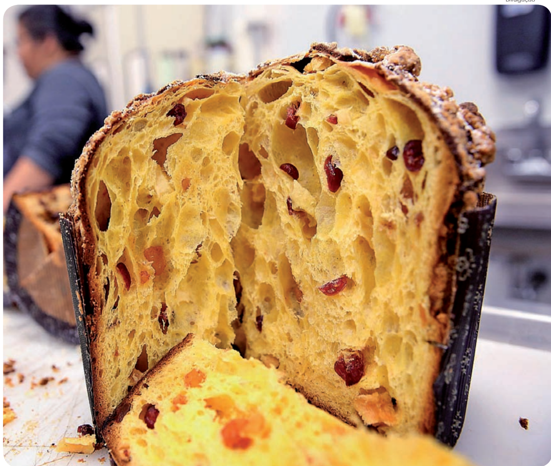
Além da oficina de panetone, nesta quinta (28), abrem inscrições para oficina de Eletro-Eletrônica