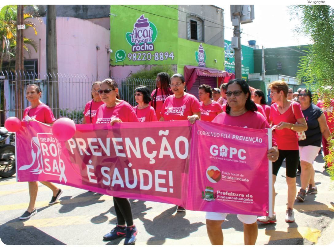
"Caminhada Rosa" foi uma das atividades