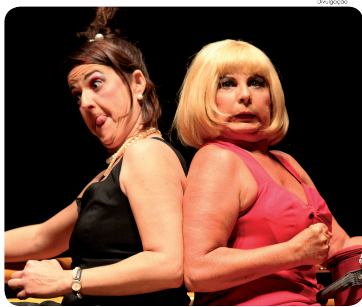
Peça 'De Malas Prontas', do grupo Pé de Vento

De acordo com os organizadores, a edição de 2019 do Feste terá seis espetáculos adultos, quatro espetáculos infantis, quatro espetáculos de rua e cinco espetáculos convidados, somando 21 peças, em nove dias de apresentações nos seguintes locais: Teatro Galpão, Parque da Cidade, Museu Histórico, CEU das