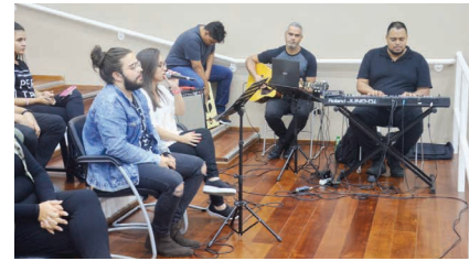
Banda da Igreja da Cidade