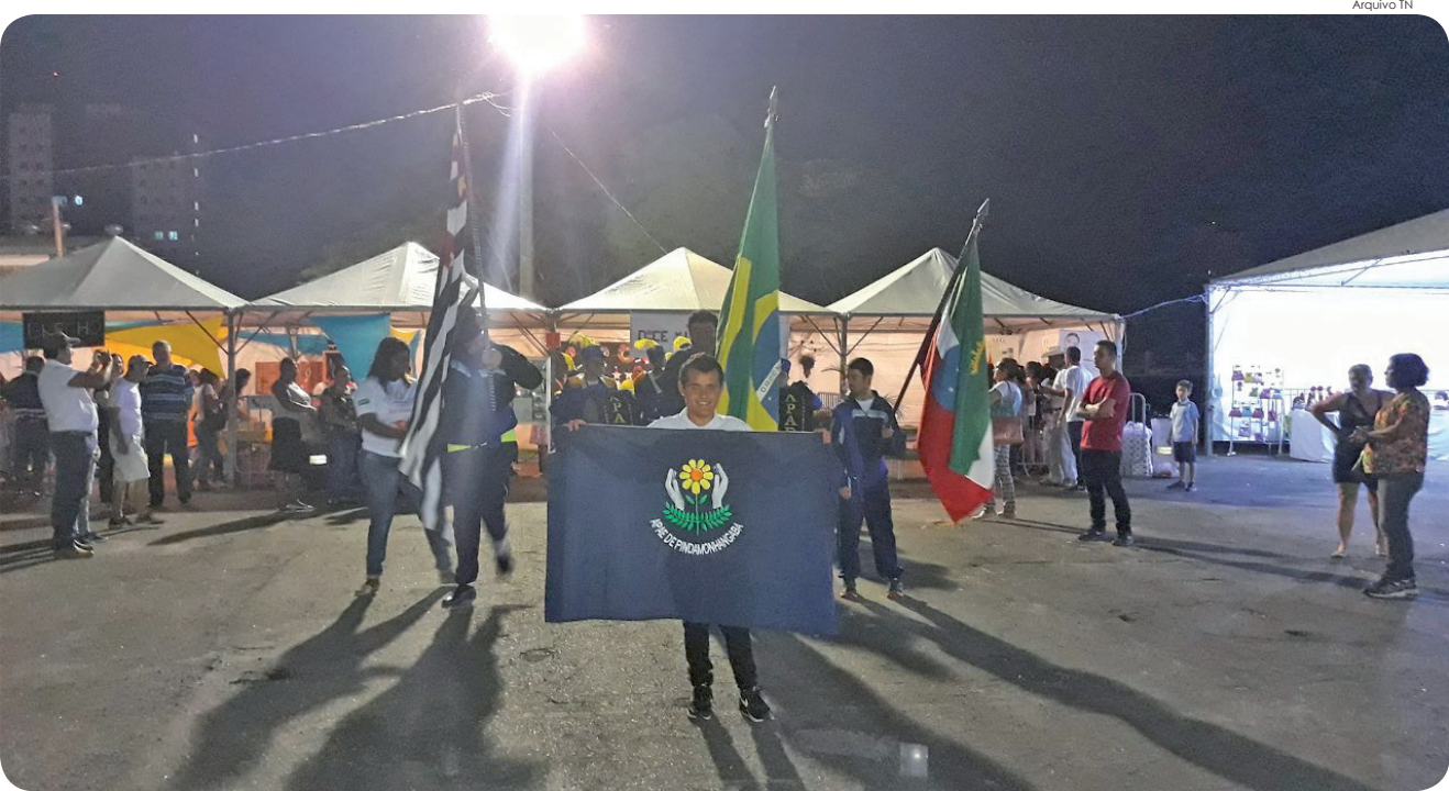
Com entrada franca, o público terá shows ao vivo de artistas da região no período noturno