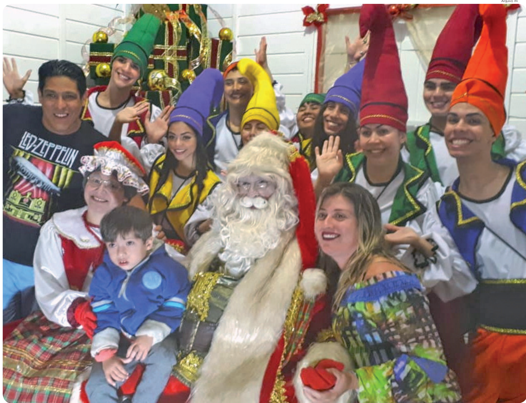
Além do Centro de Pinda e de Moreira César, “Bom Velhinho” visitará ‘Praça da Bíblia’ e ‘Praça de Eventos’ do Araretama