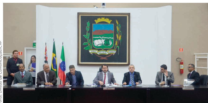
Autoridades que integraram a Mesa Diretora da sessão solene da Câmara de Pindamonhangaba

Projeto de Resolução nº 12/2019, de autoria da Mesa Diretora. Publicado no Departamento Legislativo.