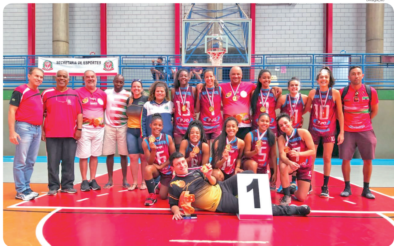
Basquete feminino foi campeão dos “Jogos Abertos”

Além de atletas dos “Jogos Abertos”, também participaram as crianças do TaeKwonDo, que apesar da pouca idade foram campeãs da “Taça Brasil” da modalidade.