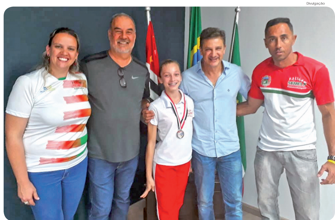
Atletas de diversas modalidades foram recebidos no Gabinete, na segunda (25)