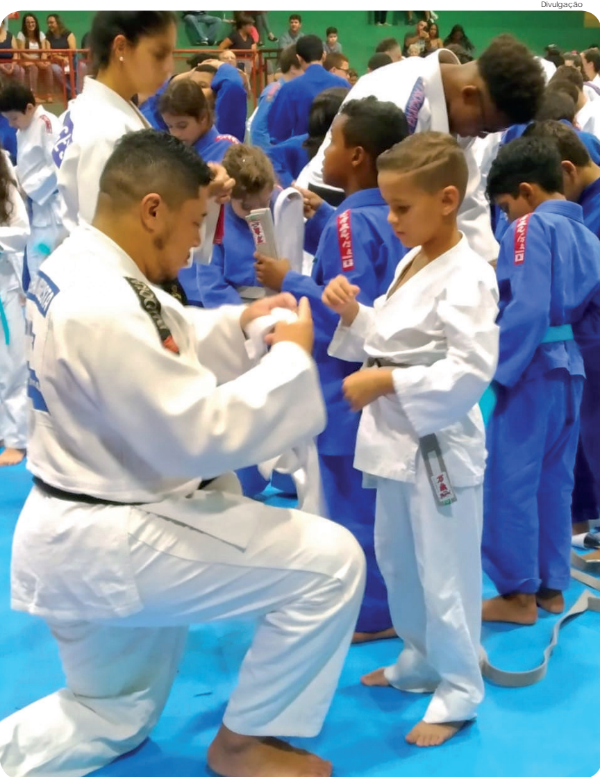
Cerca de 150 atletas participaram do evento esportivo