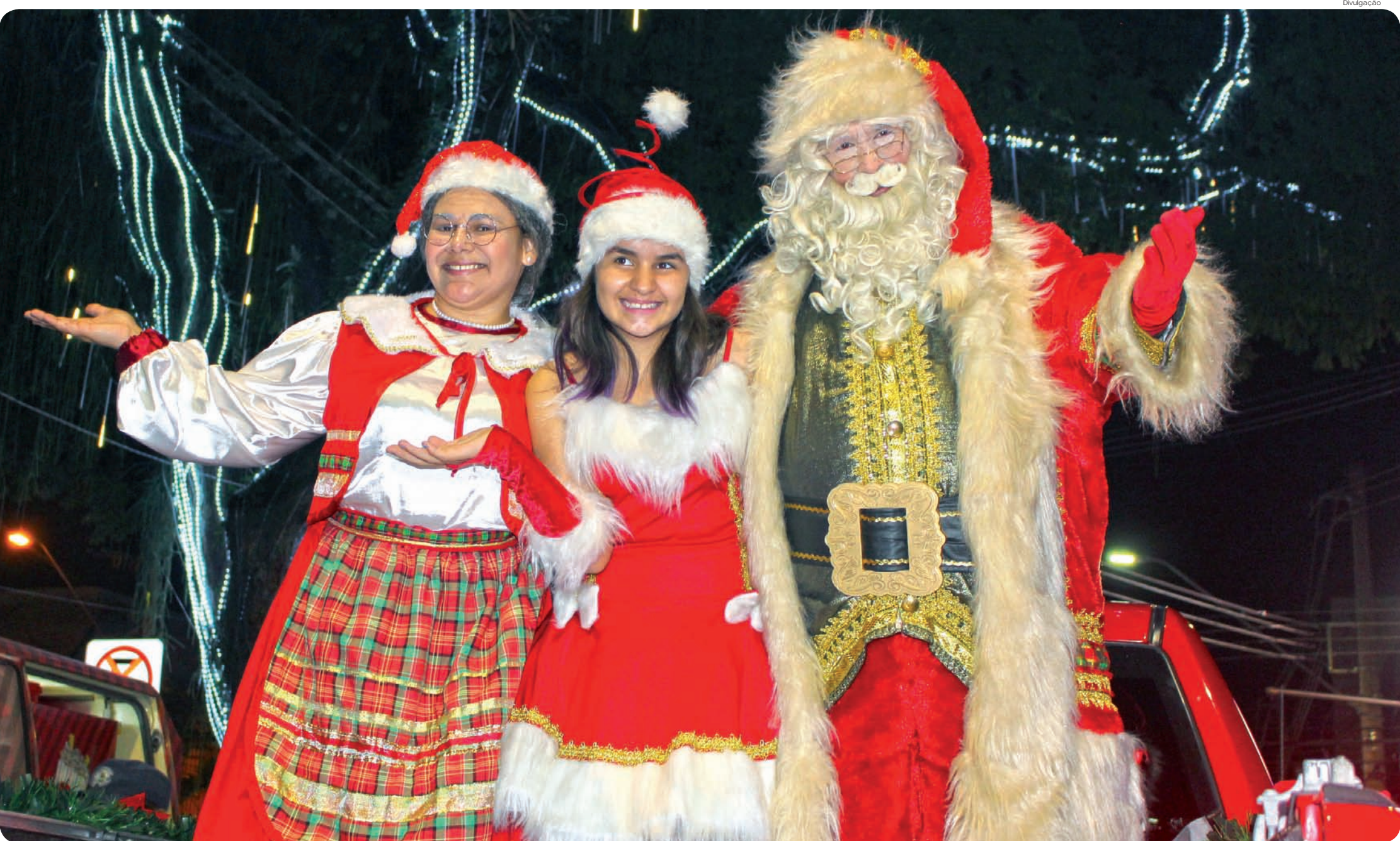
"Família Noel" chega à cidade em grande estilo. Sexta, dia 6, eles estarão no Distrito de Moreira César