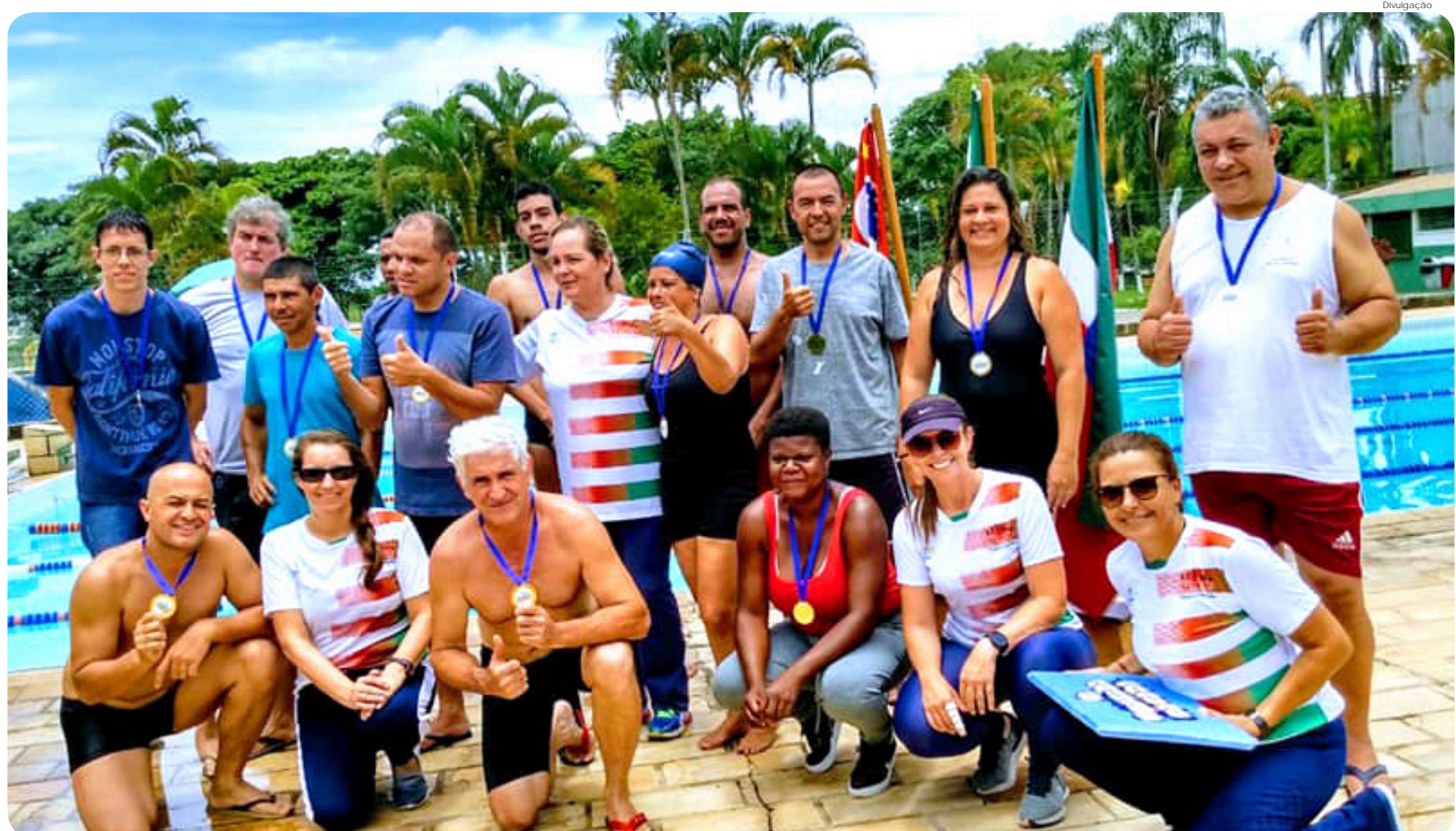
Evento esportivo teve por objetivo principal apresentar o aprendizado em cada nível e gerar integração