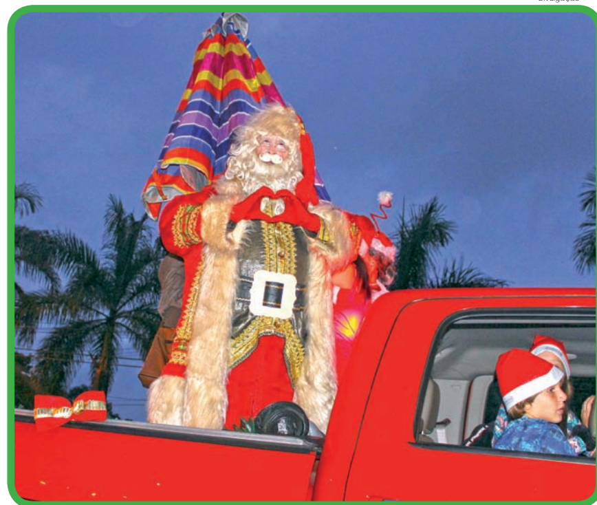
“Papai Noel” participou de carreta pelas ruas de Pinda

“Importante reforçar que em uma ação inédita, o ‘Papai Noel e seus duendes’ estarão por dois fins de semana em Moreira César, além de irem também à ‘Praça da Bíblia’ e à ‘Praça de Eventos’ do bairro Araretama, levando