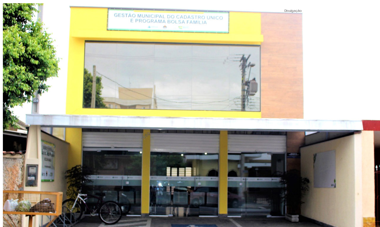
Entre as funções do Cadastro Único está o acompanhamento do "Bolsa Família"

Com a nova sede, o intuito é organizar e melhorar ainda mais o atendimento aos munícipes beneficiários.