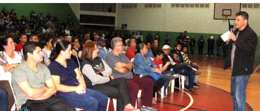
O primeiro bairro a ser atendido pela parceria entre a Prefeitura e o Itesp foi a Vila São Benedito

Os assuntos são diversos, mas o propósito é o mesmo: divulgar ações positivas da cidade e da região. Mostrar que sempre existem pessoas e organizações evoluindo, fazendo o bem e contribuindo de forma positiva para uma sociedade mais igualitária e mais justa.