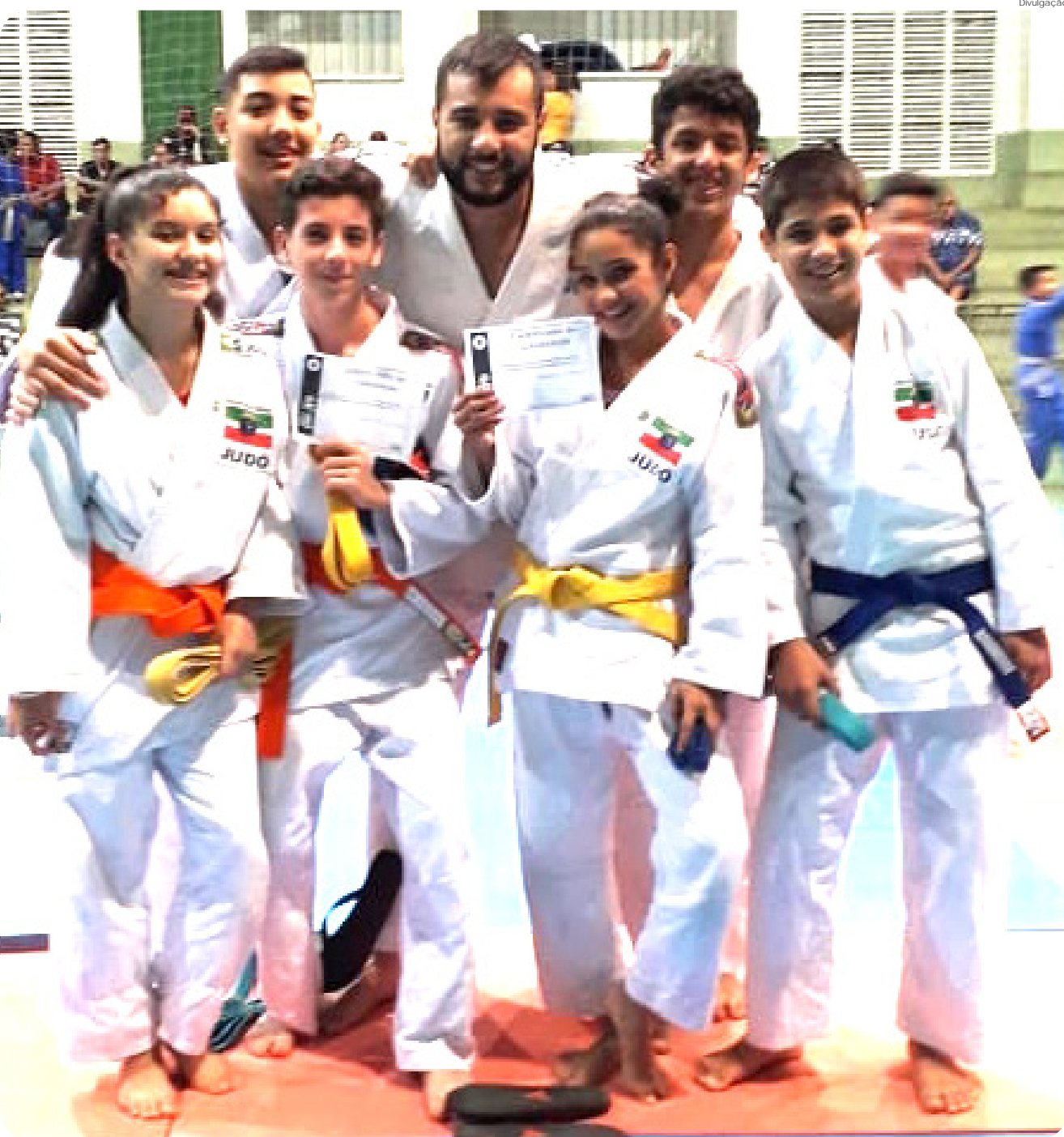
Quase 150 judocas participaram do evento, que aconteceu em dois dias