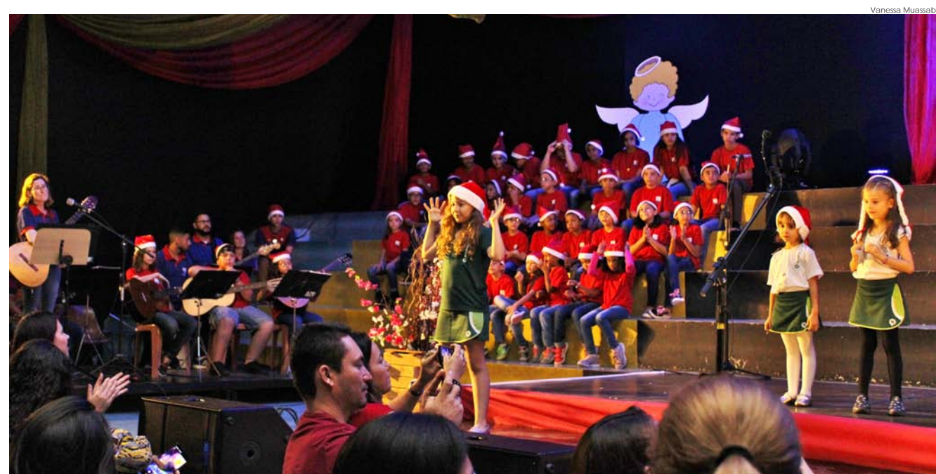
Também participaram do evento: funcionários, educadores, alunos da Educação Infantil e Fundamental I, estudantes do ‘Provim’, familiares e amigos

Os resultados serão divulgados na primeira semana de fevereiro de 2020. As aulas terão início no mês de março.