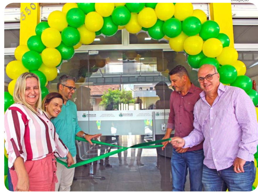
Nova sede foi inaugurada na última quarta-feira (4)

O prédio do Cadastro Único e Bolsa Família fica na avenida Albuquerque Lins, 550, São Benedito.