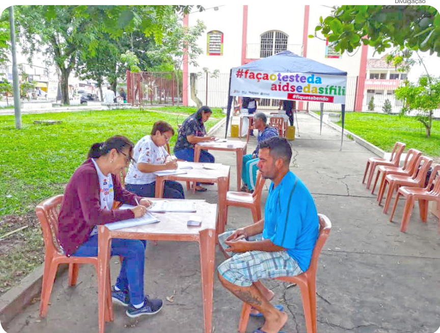
Unidades volantes realizam testes com resultado no local