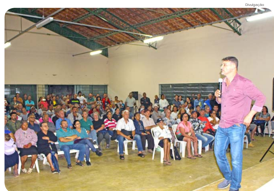
Mais de 300 moradores participaram da audiência pública

Neste sábado (7), a equipe da Secretaria de Habitação estará na quadra poliesportiva coberta do Karina Ramos (Rua José Alves de Oliveira, s/nº), ao lado do centro comunitário, para iniciar o "Meu Bairro é Legal" naquela região.