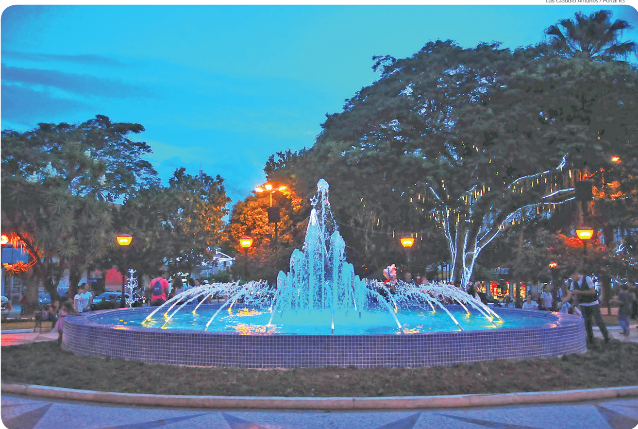
Praça histórica recebeu diversas melhorias, entre elas, a transformação do antigo chafariz em uma fonte luminosa