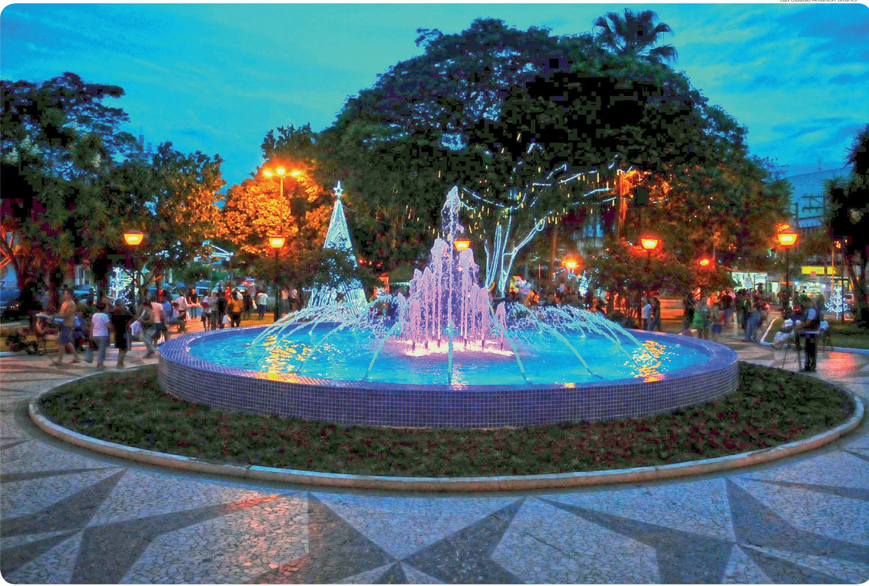
Revitalizada, Praça Monsenhor Marcondes recebeu fonte moderna e luminosa no lugar do antigo chafariz

O próximo domingo (8) será mais um dia especial para Pindamonhangaba: às 19 horas, haverá cerimônia de inauguração da revitalização da Praça Monsenhor Marcondes e do novo chafariz – que estava inutilizado –, e agora tornou-se uma moderna fonte luminosa. O evento terá participação especial da Camerata Jovem do Projeto Jataí.