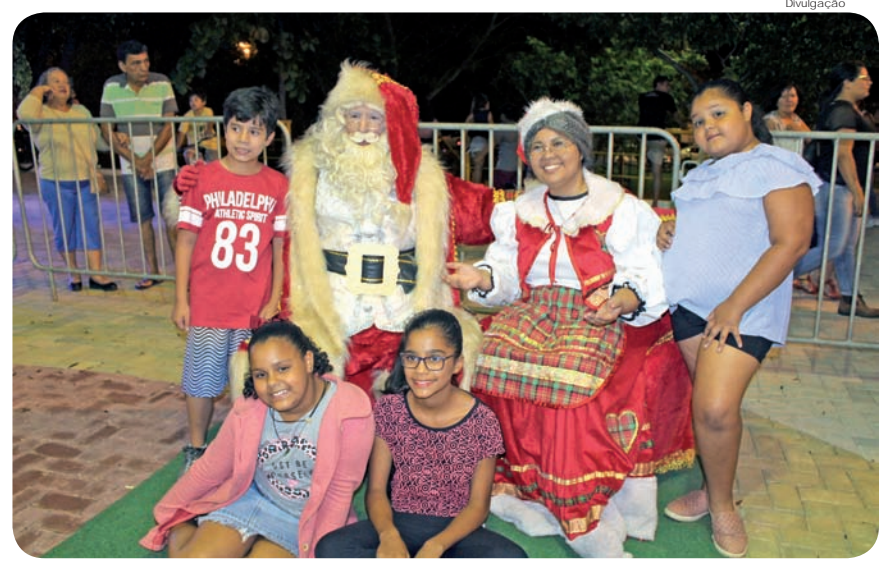
Garotada fez questão de registrar o momento