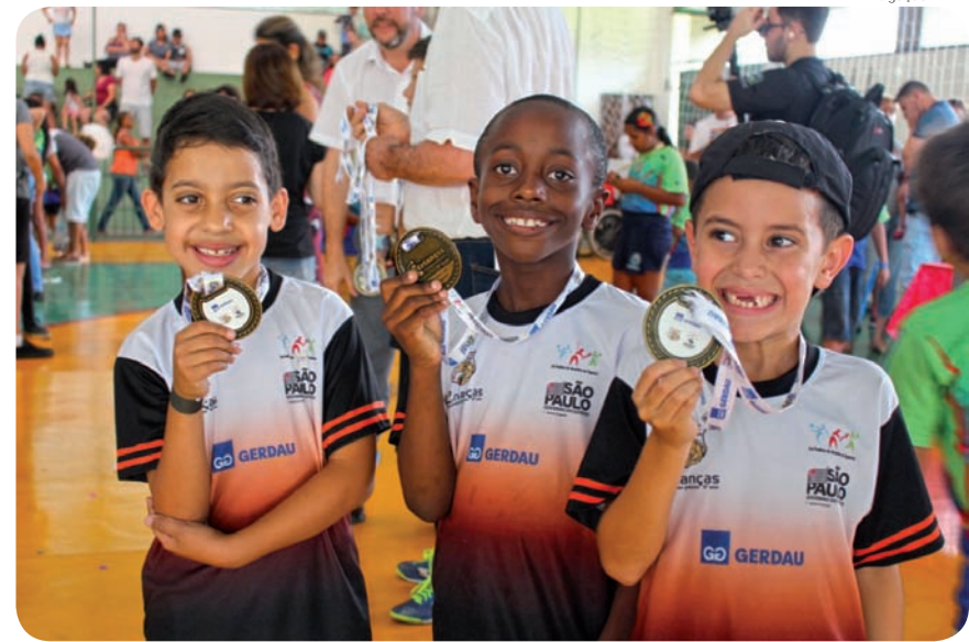
Atividades do Grêmio União acontecem no contraturno escolar de 11 escolas do município