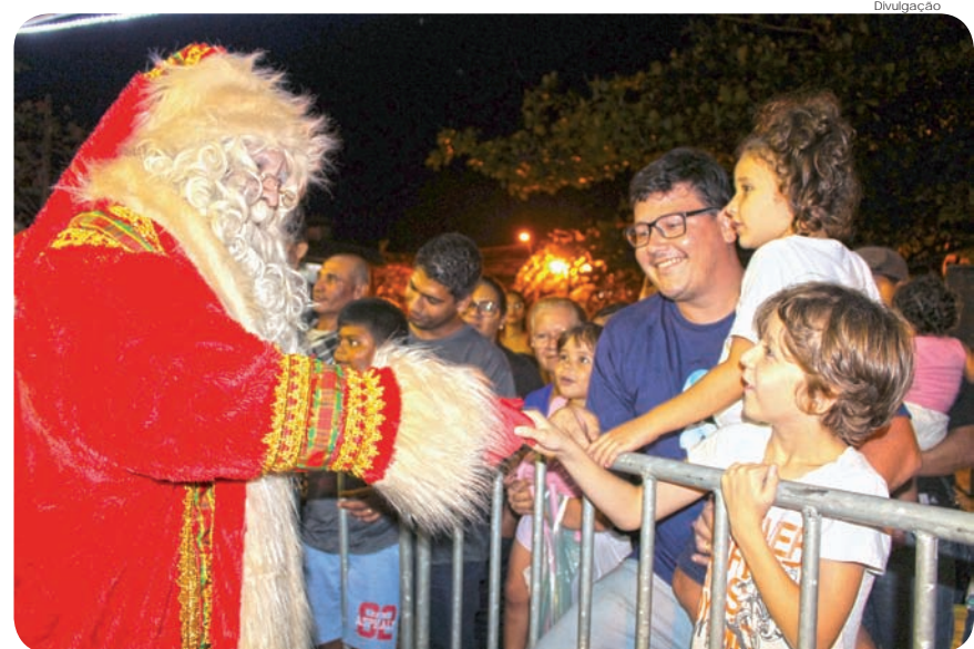
Centenas de crianças aguardavam o “Bom Velhinho”