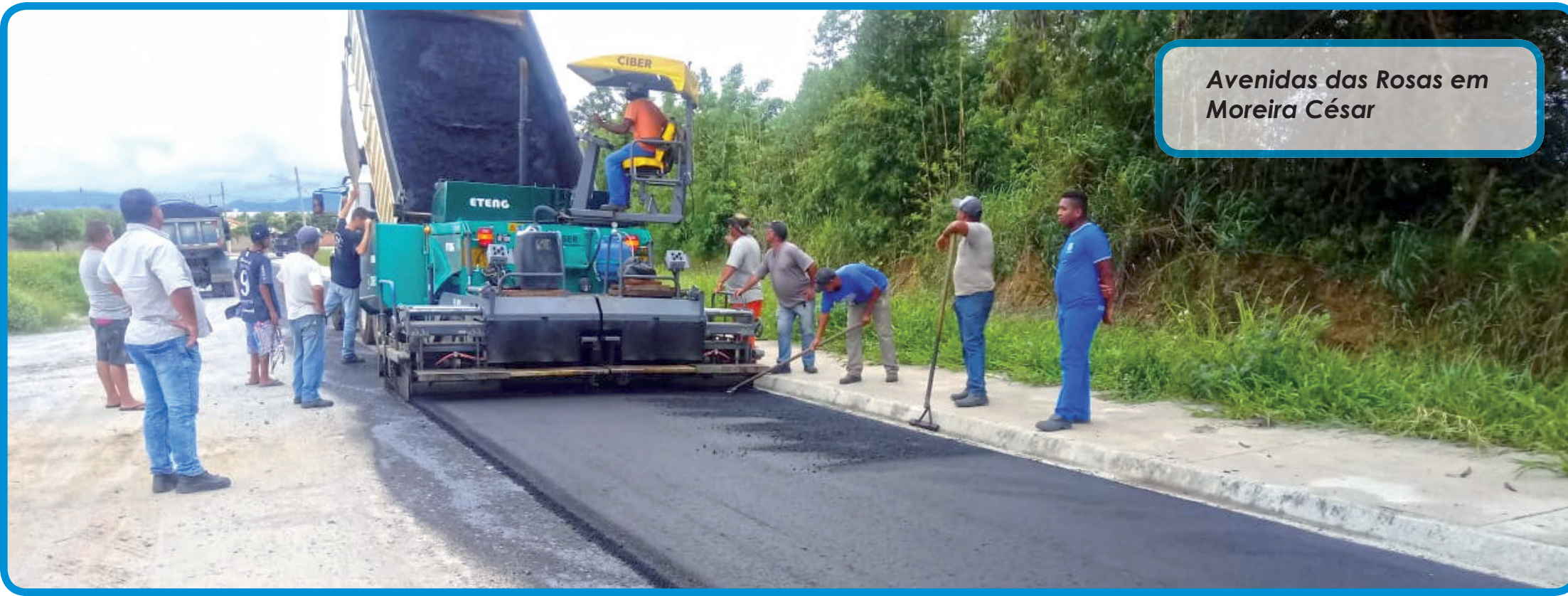
Estrada do Taipas em Moreira César