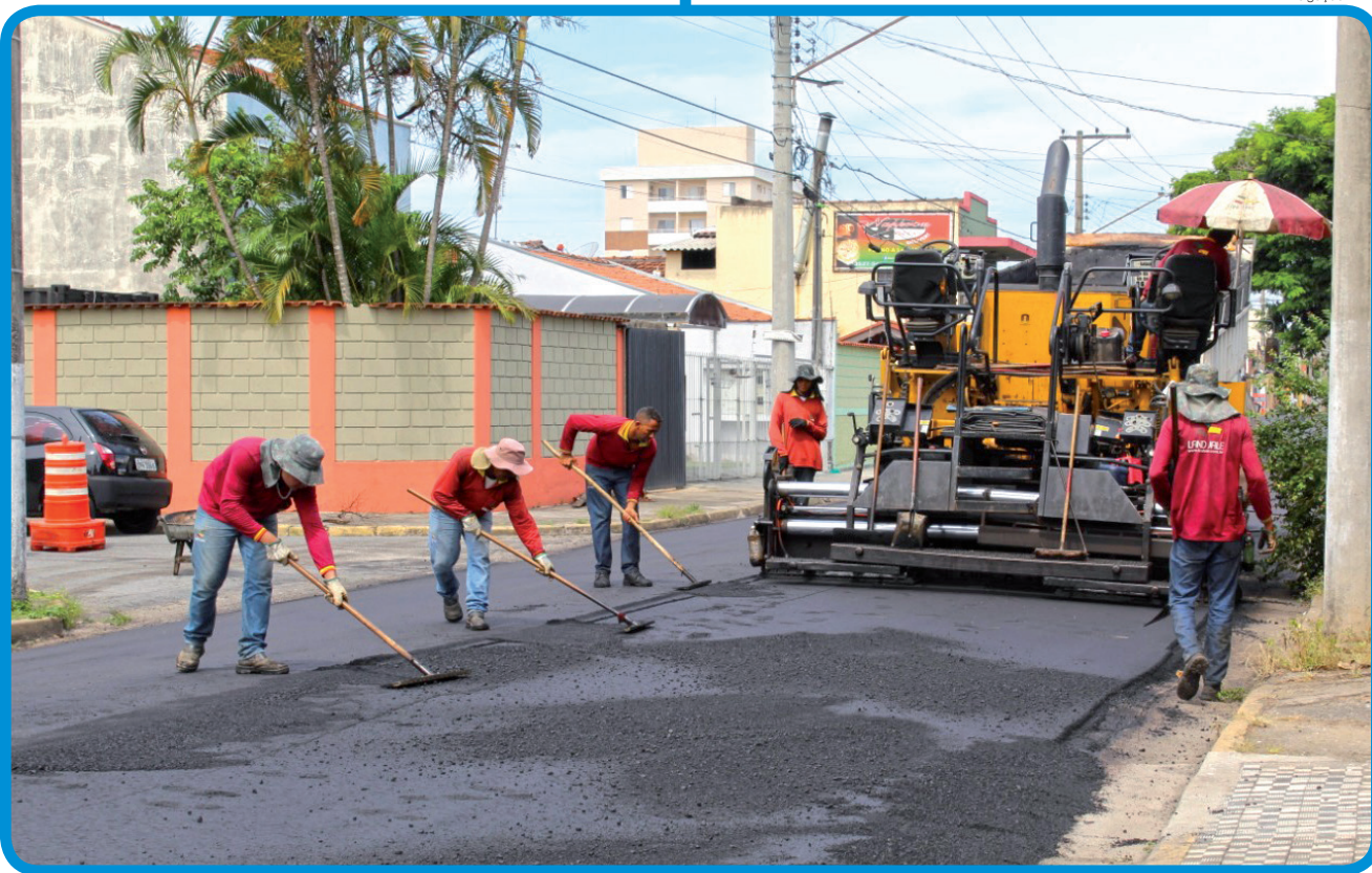
Pavimento da rua Capitão Vitório Basso estava precário