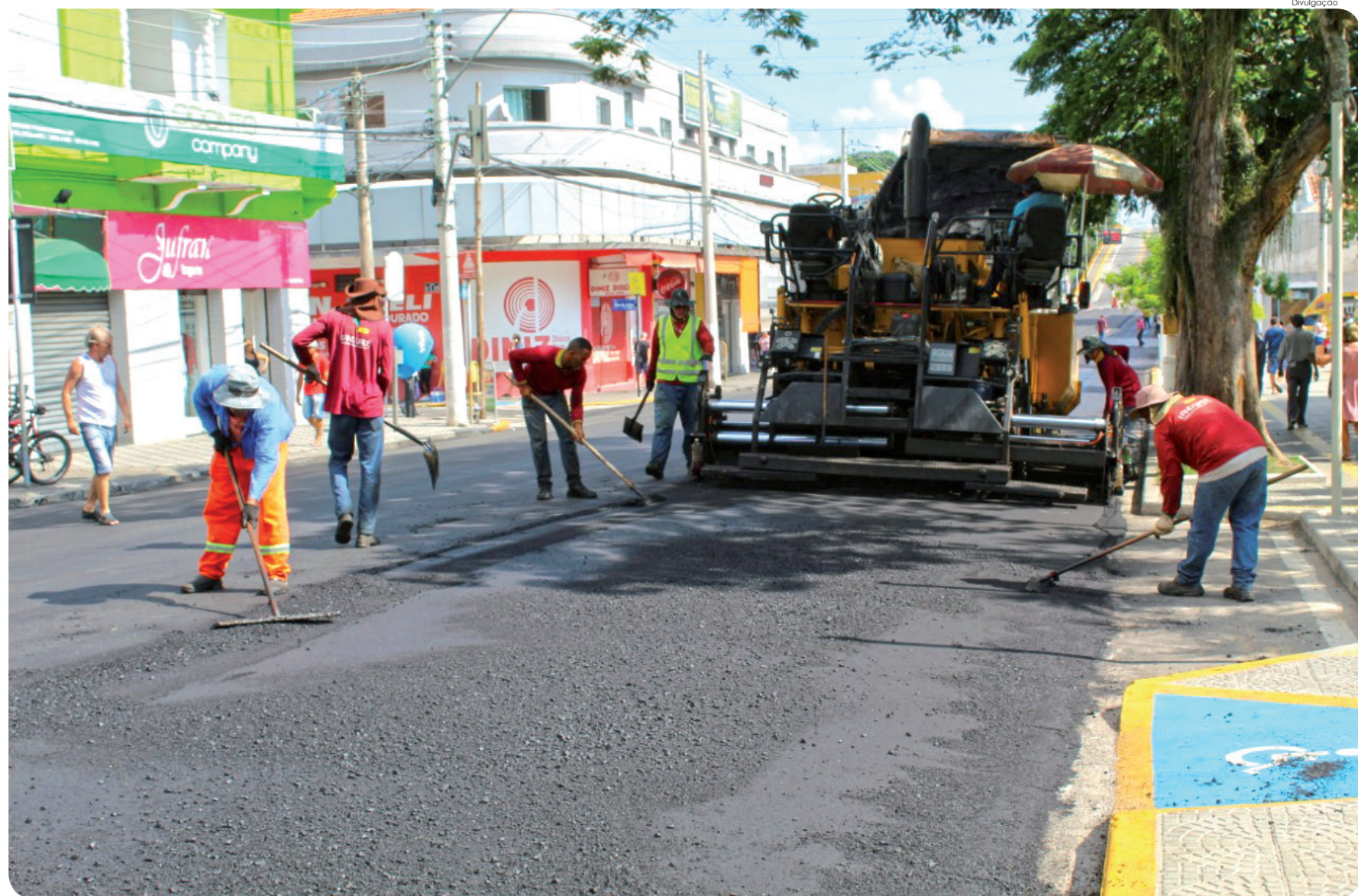
Funcionários da Prefeitura executam recapeamento asfáltico na avenida Jorge Tibiriçá

PANCADAS DE CHUVA A PARTIR DA TARDE UV 13 Fonte: CPTEC/INPE