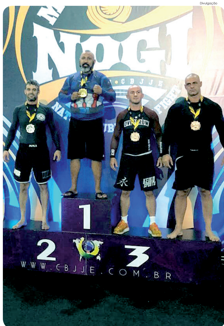
Montanha é o novo Campeão Absoluto do Campeonato No Gi

A próxima competição que Montanha irá participar será em abril, no Campeonato Brasileiro de Jiu-Jitsu.