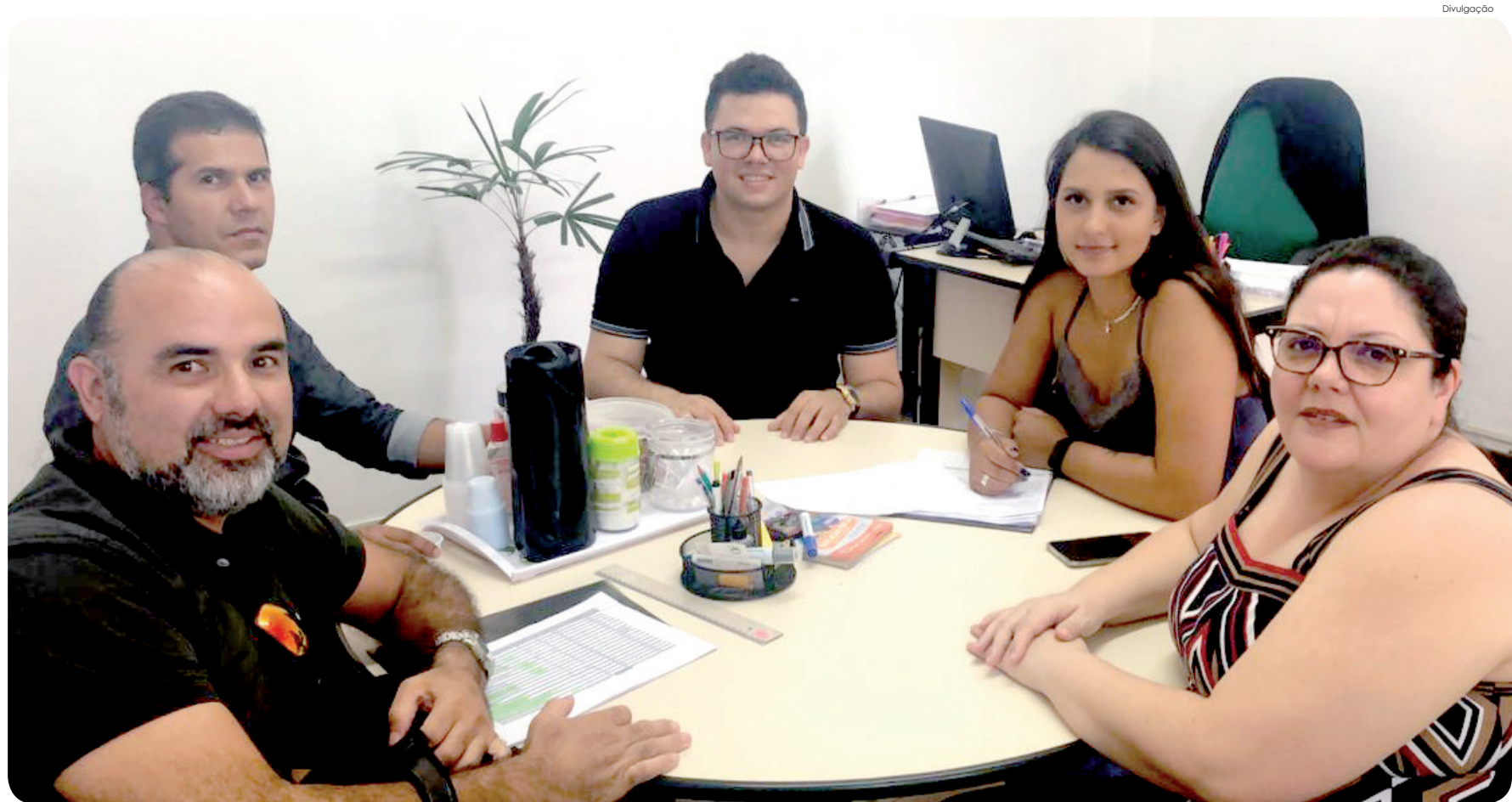
Representantes da Prefeitura e IUDES durante reunião na Fasc, um dos locais que receberão as provas

A reaplicação das provas será nos dias 9 e 16 de fevereiro, e 1 e 8 de março. Os locais serão divulgados em edital, próximo às datas das provas. Todas as informações estão no site da Prefeitura www.pinda.sp.gov.br .