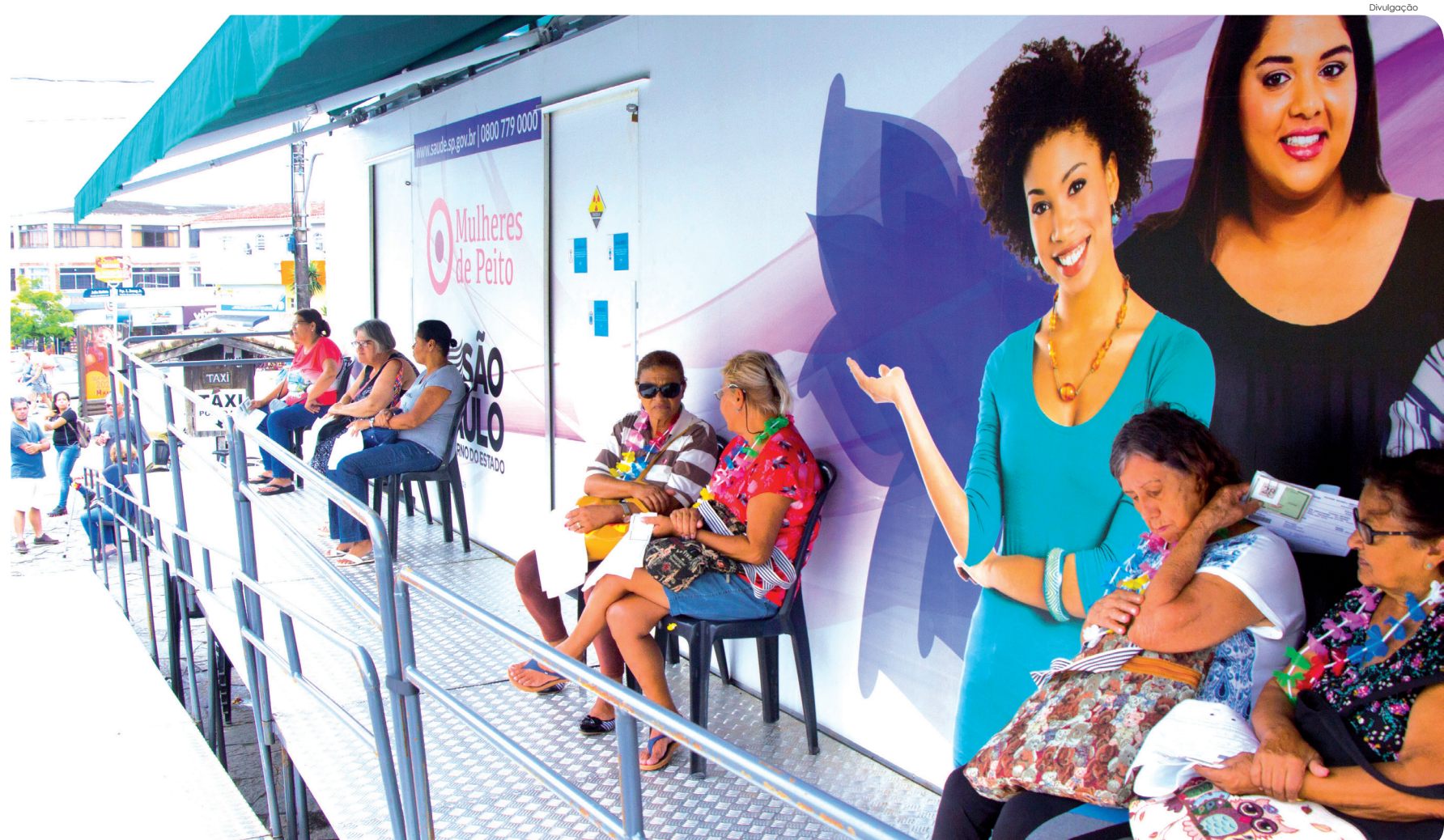
Carreta "Mulheres de Peito" estará na cidade entre os dias 17 e 29 de fevereiro