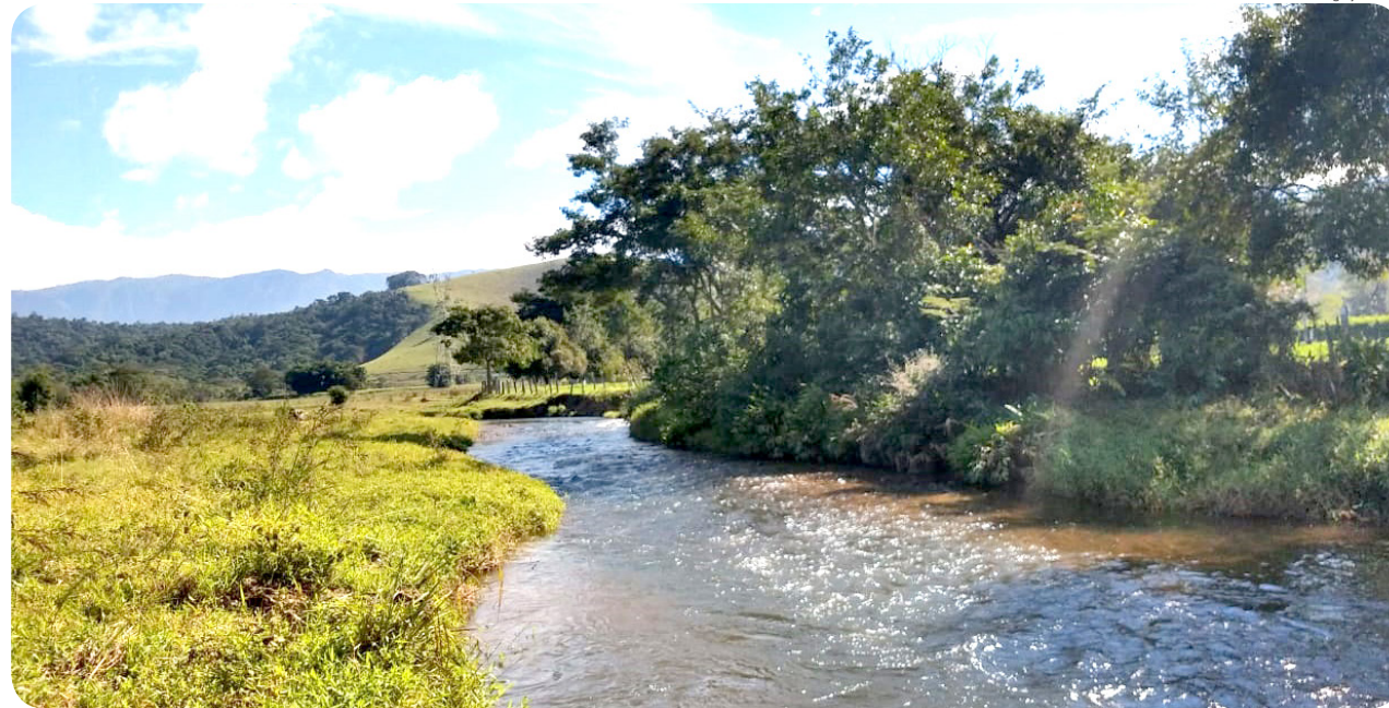
Boletim de balneabilidade fica disponível no site da Prefeitura

“É comum a variação realmente ocorrer, conforme os últimos apontamentos. Ora está imprópria e outras ocasiões pode ser classificada como própria. Importante a comunidade dessa