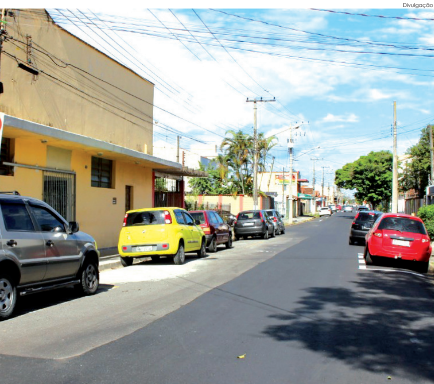
Rua liga centro a diversos bairros