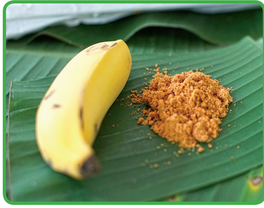
Degustação de produtos regionais estava no roteiro