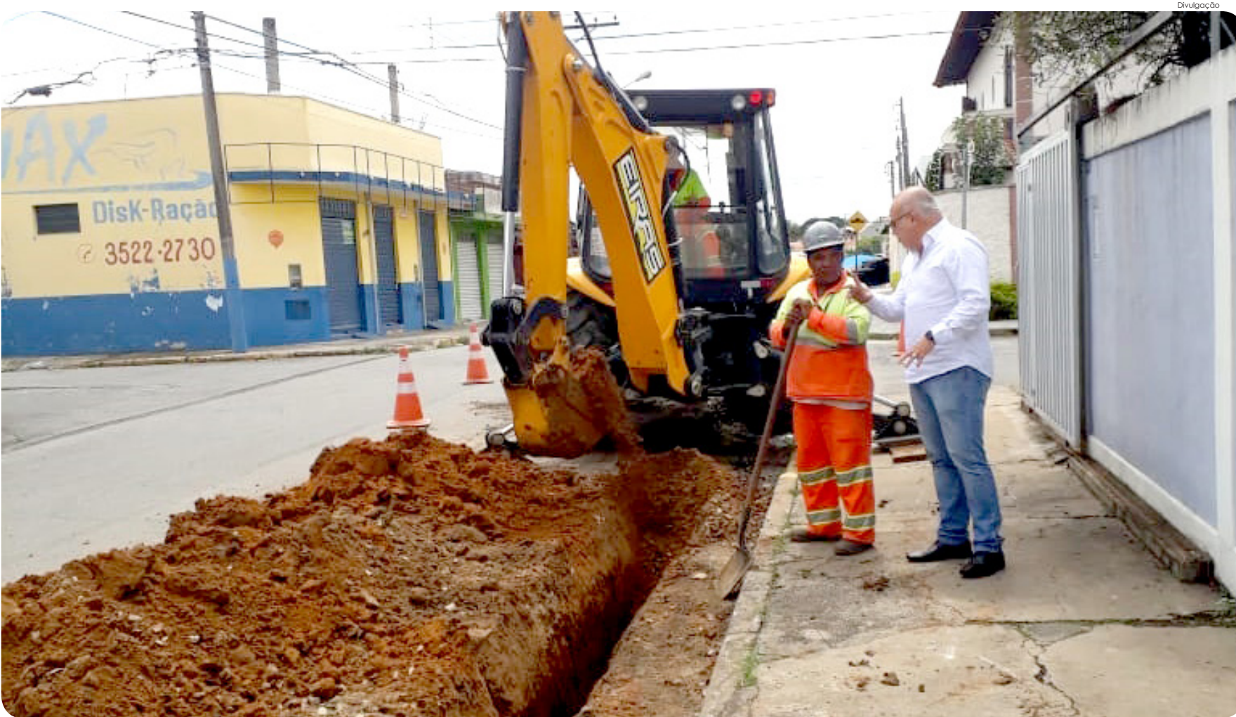
Rua Capitão Vitório Basso liga o centro a diversos bairros, como Jardim Rosely e Parque São Domingos

A empresa Land Vale, que vem executando o plano de recapeamento asfáltico em Pindamonhangaba, através de recursos obtidos pela Prefeitura junto ao convênio com o Governo do Estado, deverá finalizar as obras em fevereiro.