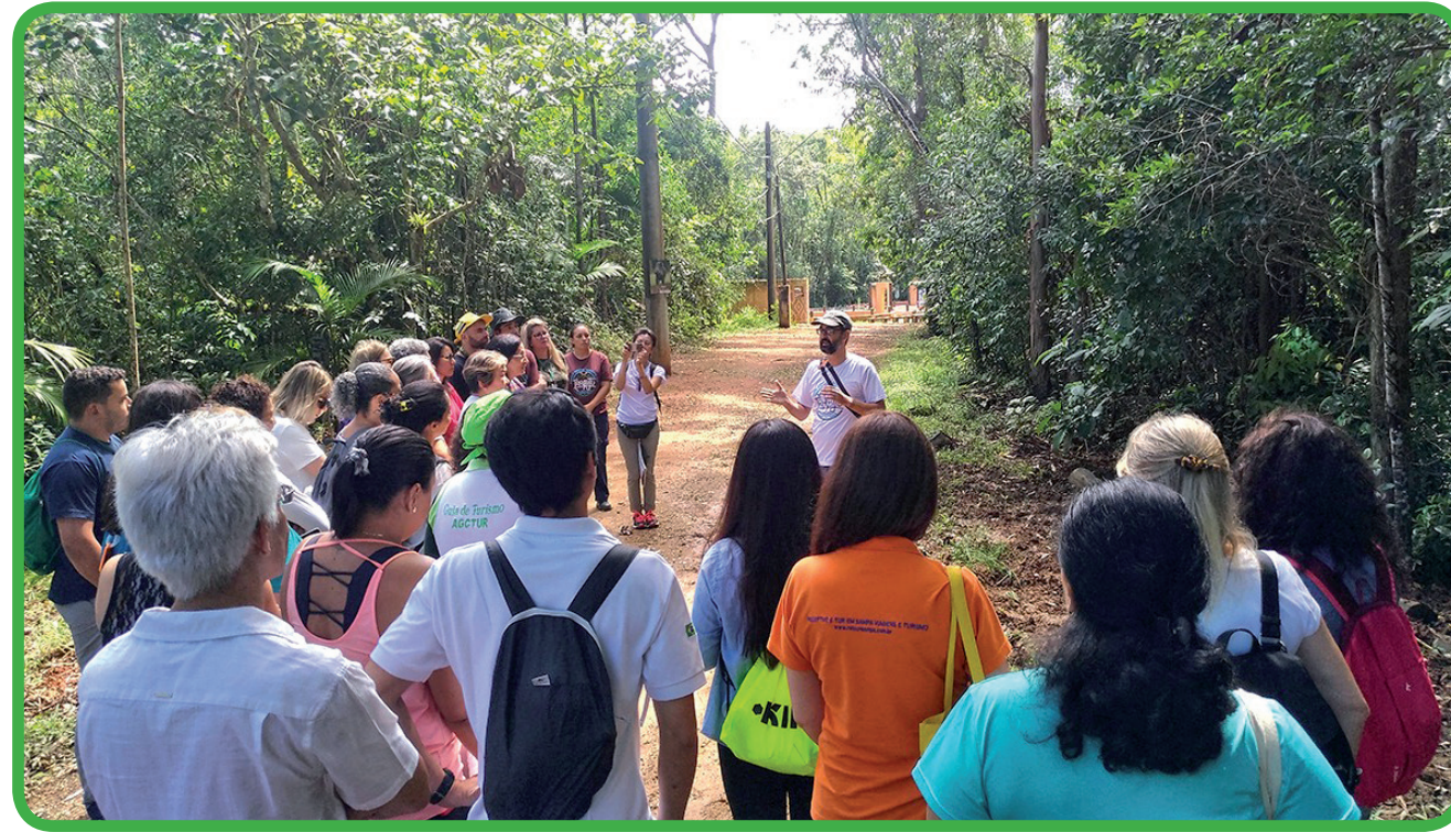
Guias turísticos de diversos municípios participaram da atividade

Os agentes foram recepcionados no auditório do parque com um café da manhã diferente, com um tema sustentável, promovido em parceria com produtores locais. Foram servidos produtos da