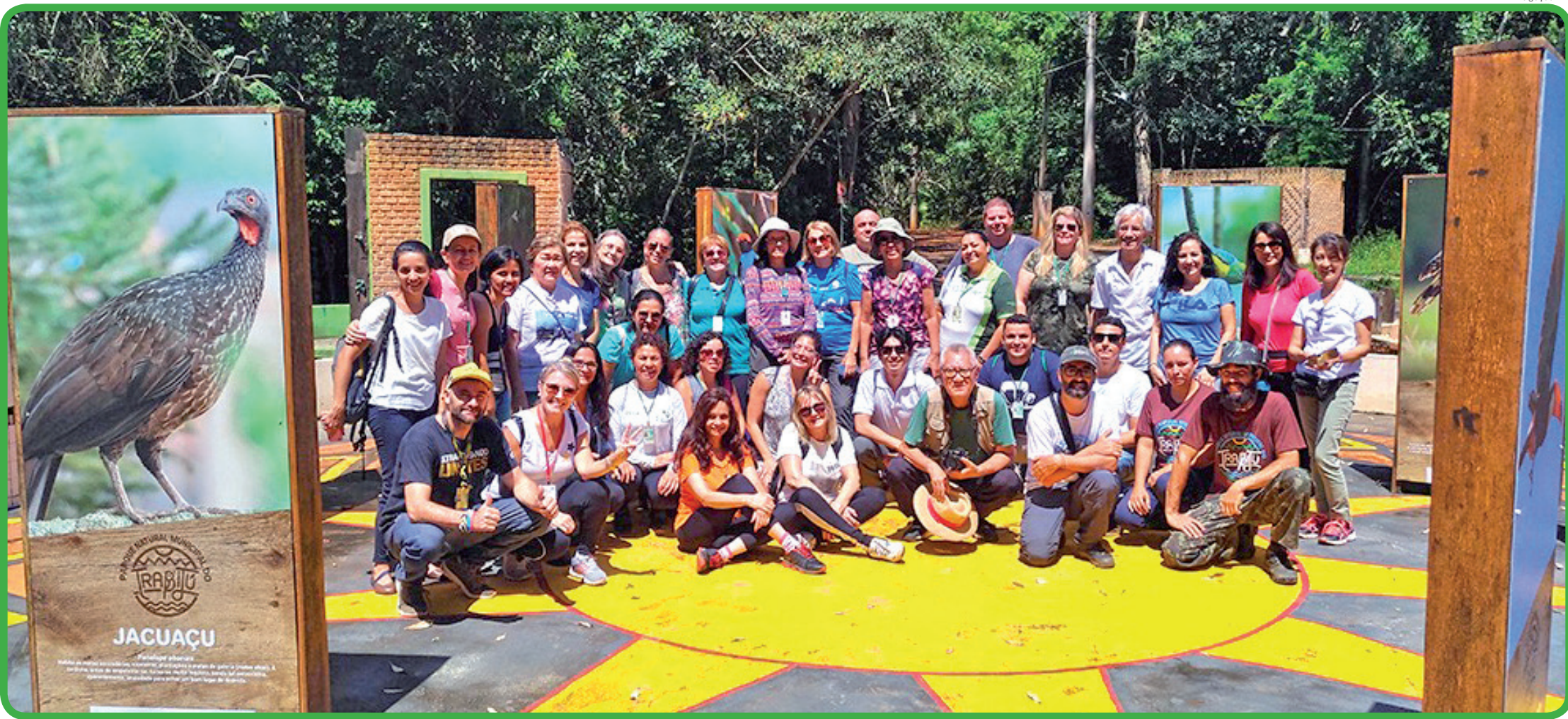
Visita monitorada permitiu conhecimento, divulgação do local e integração dos participantes