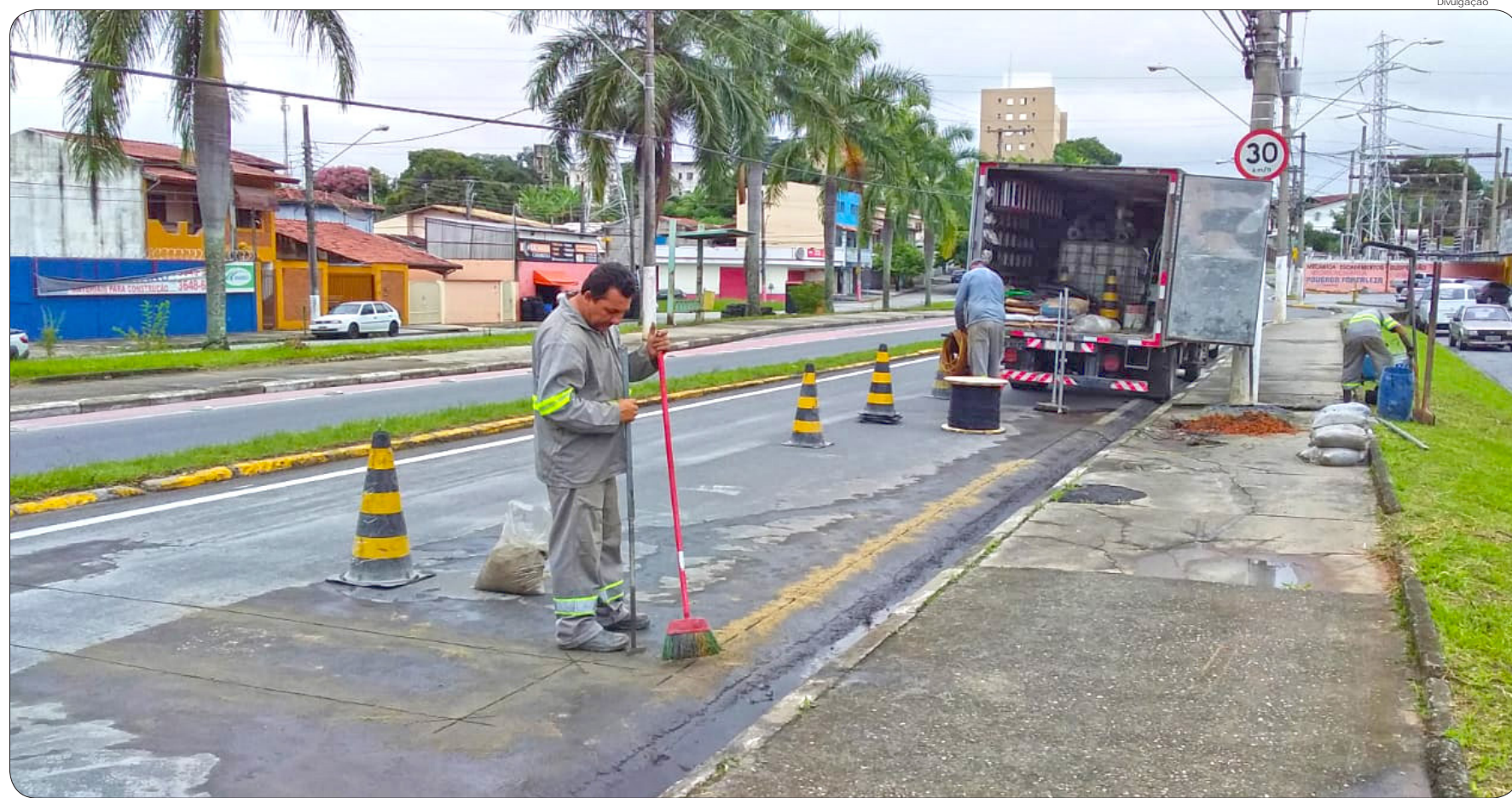
Cadastramento para isenção está sendo feito no site da Prefeitura de Pindamonhangaba

Com o novo sistema, os caminhões e carretas que não são da cidade e que entram em Pinda para fugir do pedágio da Via Dutra, terão suas placas identificadas automaticamente pelo sistema e serão autuados eletronicamente se persistirem em circular pela via municipal. O pedágio da Estrada do Atanásio