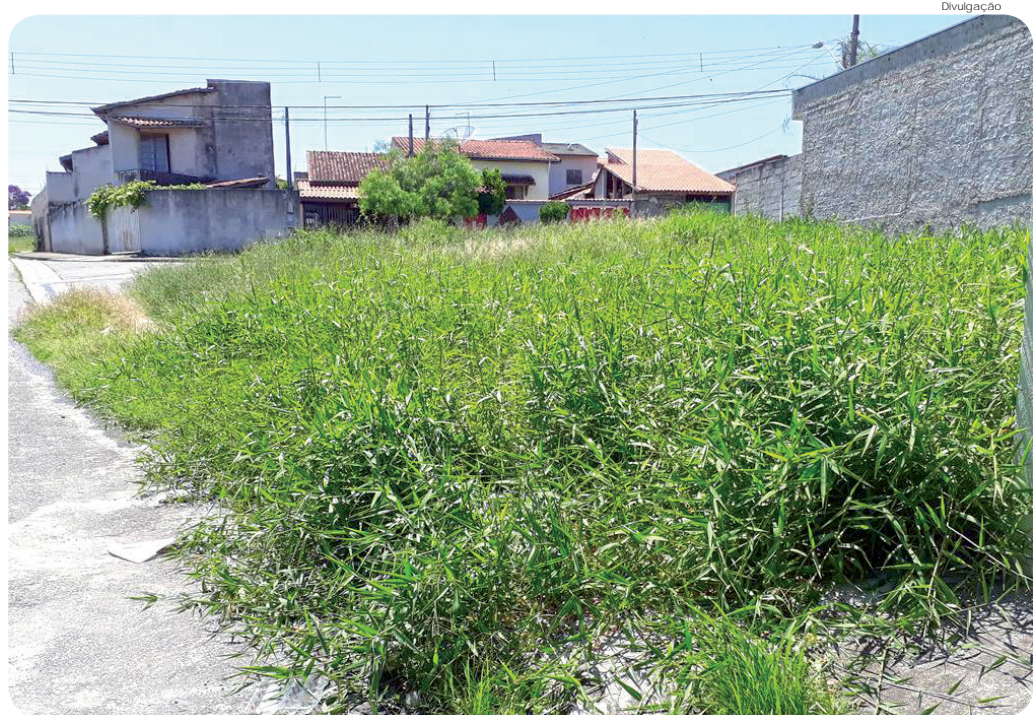
Limpeza e manutenção de terreno particular é responsabilidade do proprietário. Não cumprimento gera multa

Apenas neste ano, nos 40 primeiros dias, a Ouvidoria da Prefeitura recebeu 860 solicitações denunciando propriedades particulares abandonadas ou com necessidade de limpeza.