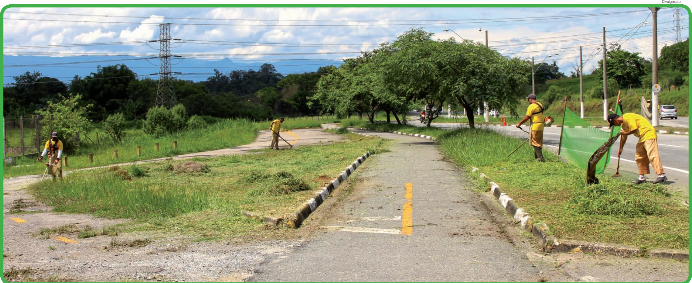
Serviços de limpeza e de manutenção estão ocorrendo por toda a cidade