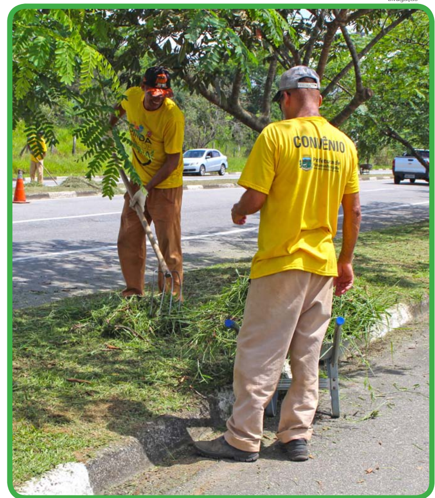
Convênios aumentam efetivos no serviço

Convênio Funap - Outra frente de trabalho é o convênio que o município tem com a Fundação de Amparo ao Preso, vinculada à Secretaria de Administração Penitenciária do Estado de São Pau-