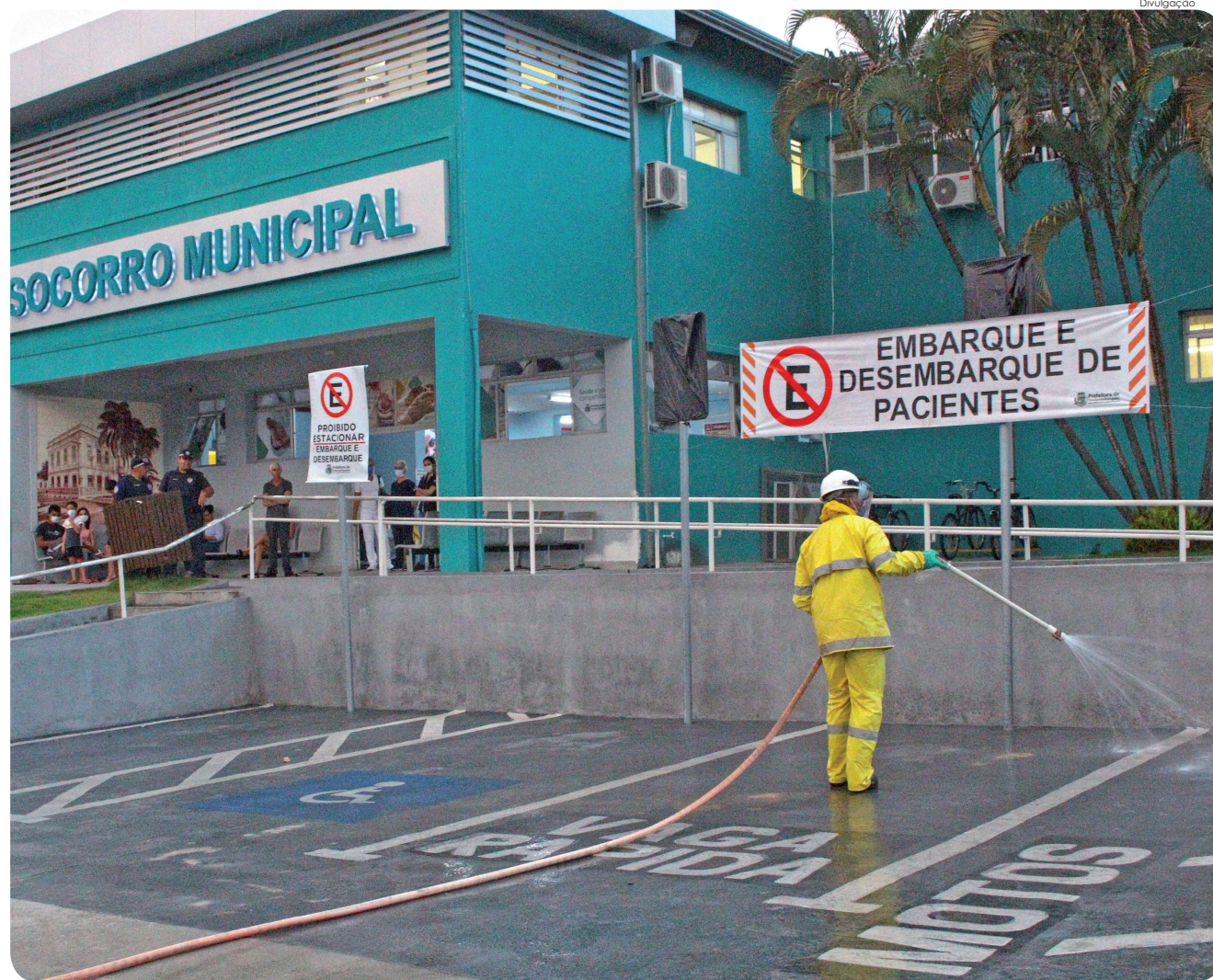
A ação teve início em vias públicas ao entorno do Pronto Socorro, Centro de Especialidades (Postão), unidade da Saúde da Mulher (CIAF) e região central em torno do mercado, feira livre e baixo do viaduto

Pindamonhangaba iniciou na segunda-feira (30) a higienização de ruas em locais de grande movimentação e ao redor de unidades de saúde. O trabalho é realizado pela SABESP e trata-se de uma importante ação preventiva para combater o vírus transmissor da Covid-19.