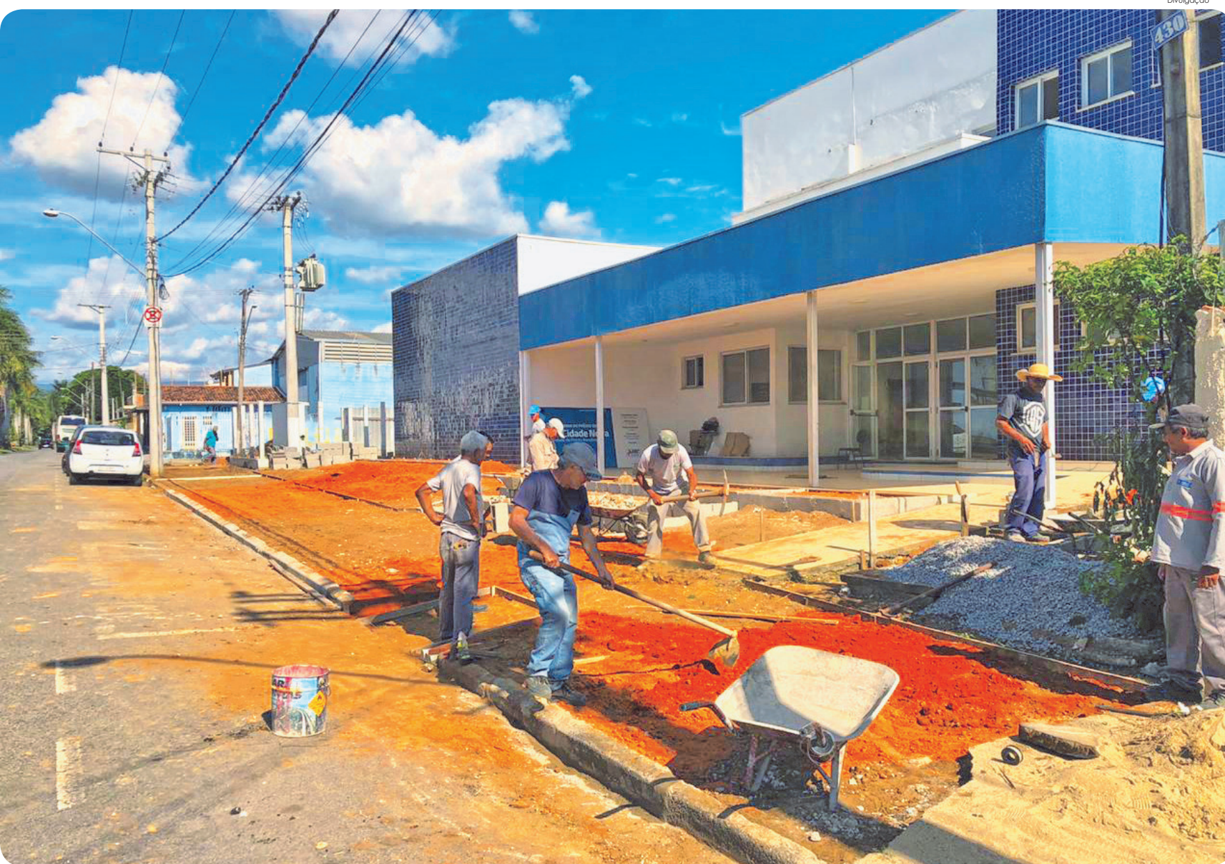
A Unidade de Pronto Atendimento está em fase de finalização das instalações elétricas