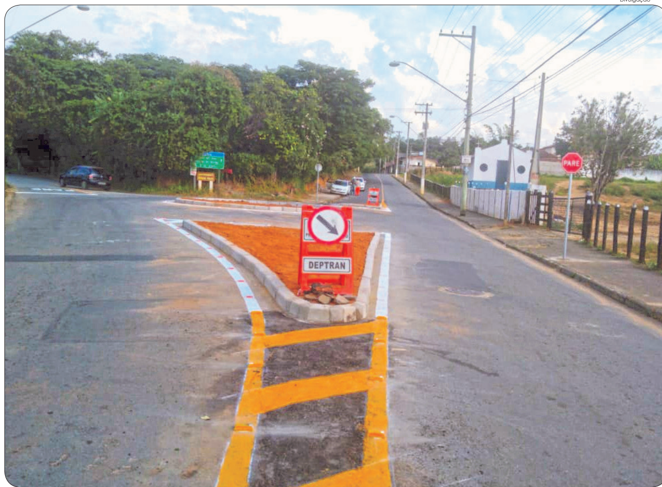
Obstáculos de concreto, bem sinalizados, visam trazer mais segurança