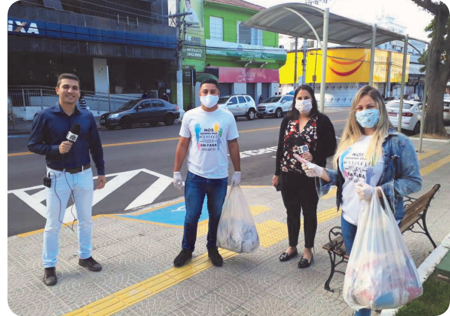
Mais de 10 mil máscaras foram confeccionadas para doação. Ação chamou atenção da mídia regional

que aquelas pessoas que não têm condições de ter uma máscara não passem por situações de risco nem por nenhum momento embaraçoso, como o relatado por um voluntário do Fundo Social. Ele disse que, nesta semana, estava na porta de um banco e encontrou um senhor idoso que saiu chorando da agência porque não tinha máscara e foi proibido de entrar. A situação chegou a emocionar o voluntário, que prontamente fez a doação da máscara ao idoso. Para ele, essa situação reforçou a necessidade des-