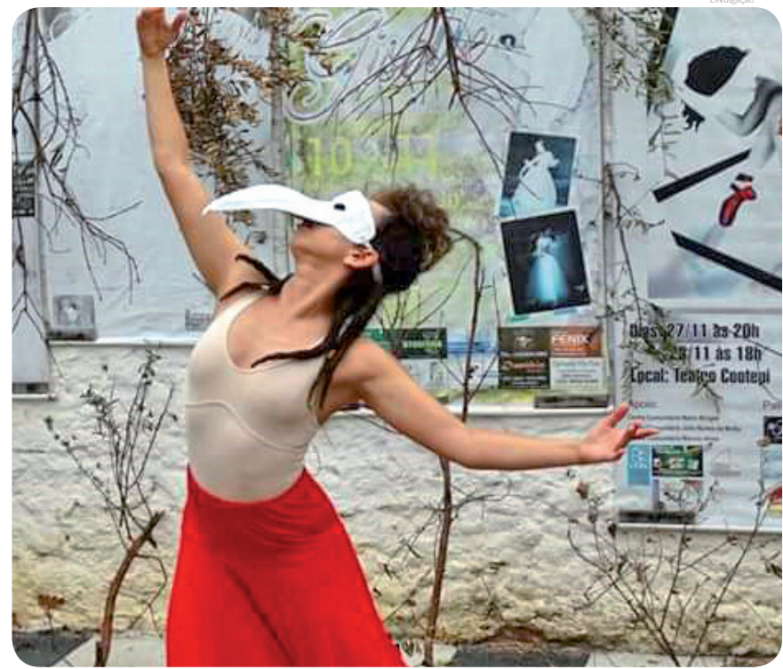
Cia. ‘O Clã da Dança’ é uma das duas companhias selecionadas

Ela conta que as aulas estão sendo realizadas no ambiente virtual da Microsoft Teams, uma ferramenta que já era utilizada pelos alunos para acessar os materiais das aulas, tarefas e atividades propostas pelos professores. “Essas ações já faziam parte do processo de avaliação dos alunos e, agora, receberam o reforço de encontros ao vivo, videoaulas, plantões de dúvidas e as aulas de projetos, que agora fazem parte da nova rotina. Tem sido um período para novas descobertas, os professores estão planejando e realizando as aulas em formatos novos, com recursos diversos. Os alunos estão desenvolvendo novas habilidades e aprendendo um novo jeito de estudar”, comenta.