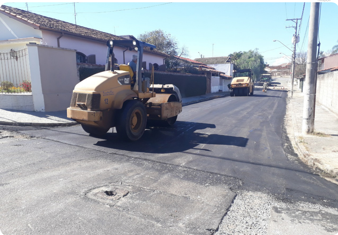
Região também recebeu melhorias realizadas pela Sabesp, por meio de parceria com a prefeitura