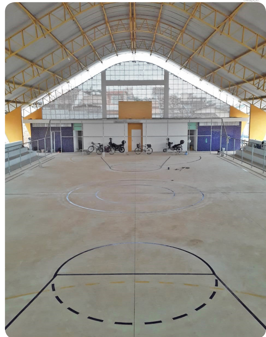
Espaço dará melhores condições para a prática das atividades físicas das crianças do bairro

O prefeito Isael Domingues lembrou que o recapeamento asfáltico vem sendo trabalhado em todos os pontos da cidade. “Já fizemos no Maria Áurea, Pasin, Anel Viário, na rua Cap. Vitória Basso, Vila Bourghese e outros. Não temos suporte financeiro para fazer tudo de uma vez, mas no Jardim Rosely adiantamos o cronograma, pois o bairro iria receber somente o remendo e o pavimento ficaria todo recortado. Agradecemos a Sabesp por essa parceria e em breve outros bairros da cidade serão recapeados, dentro do planejamento e cronograma financeiro que estamos seguindo”, comentou o prefeito.