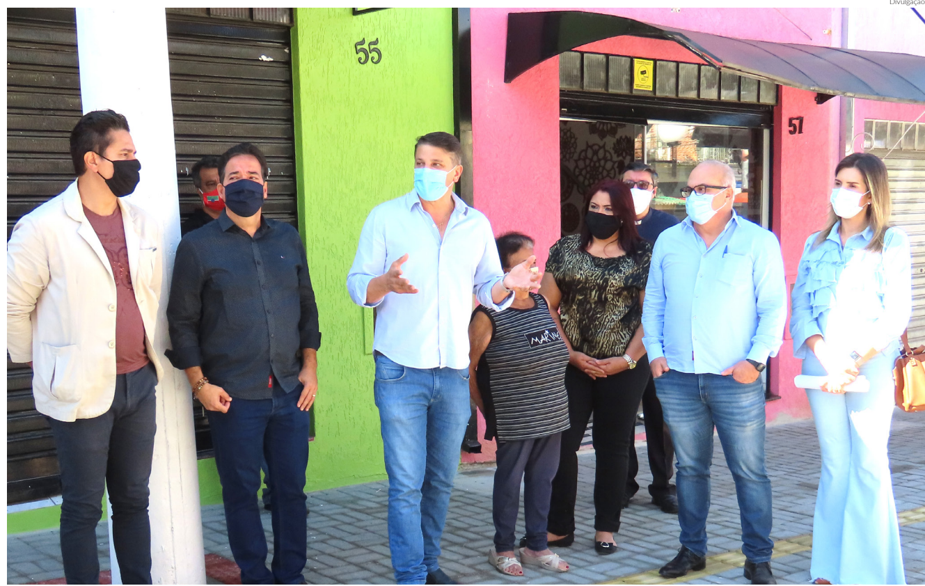
Local ganhou nova rede elétrica que com sistema de iluminação moderno e mais seguro, colocação dos bancos e o projeto paisagístico, entre outros

O espaço não contará mais com acesso para automóveis e motocicletas; bicicletas poderão passar somente sendo empurrada e está previsto ainda a implantação de um bicicletário para conforto dos ciclistas.