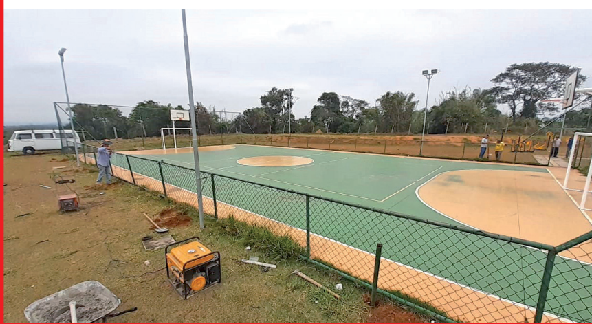
Quadra esportiva do Bem Viver recebe melhorias

Uma ação importante realizada pela Secretaria de Obras e finalizada pelo Departamento de Trânsito foi concluída na última semana: a entrada e saída de veículos do bairro Bela Vista para a Av. Nossa Senhora do Bom Sucesso (em frente à