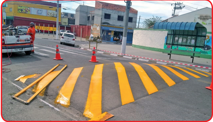
Lombadas são revitalizadas no Araretama