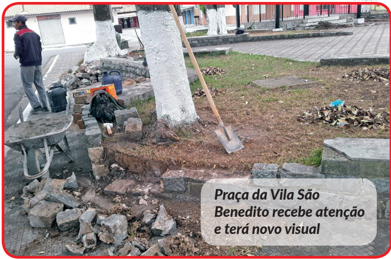
Praça da Vila São Benedito recebe atenção e terá novo visual

As ações de zeladoria também acontecem nos bairros Jardim Morumbi e Vila São Benedito. A passarela de acesso de pedestre ao bairro Moubi recebeu manutenção e pintura. A Praça Cícero Prado, na Vila São Benedito, também recebeu melhorias como recuperação de canteiros e limpeza e pintura do coreto central.