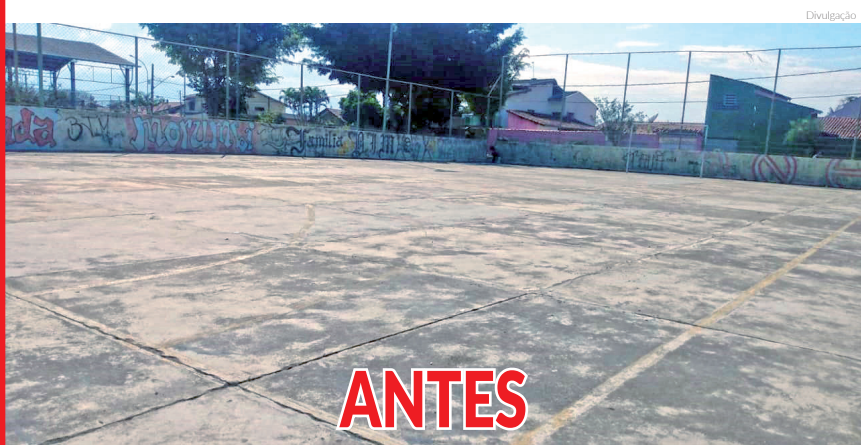
Quadra esportiva do Ipê