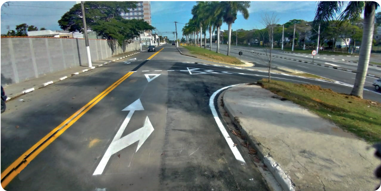
A saída do bairro Bela Vista deixa de ser feita na rotatória do João do Pulo: mais segurança para o local