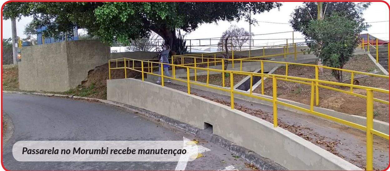
Passarela no Morumbi recebe manutenção