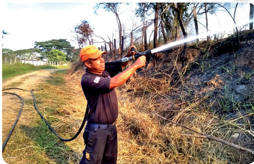
Servidores da Defesa Civil do município atuam na prevenção e no combate às queimadas

As queimadas trazem uma série de problemas ambientais e por isso a Prefeitura de Pindamonhangaba, por meio da Secretaria do Meio Ambiente, vem realizando a Campanha de Prevenção e Combate às Queimadas, com o objetivo realizar educação ambiental junto à população e reduzir o número de ocorrências no município.