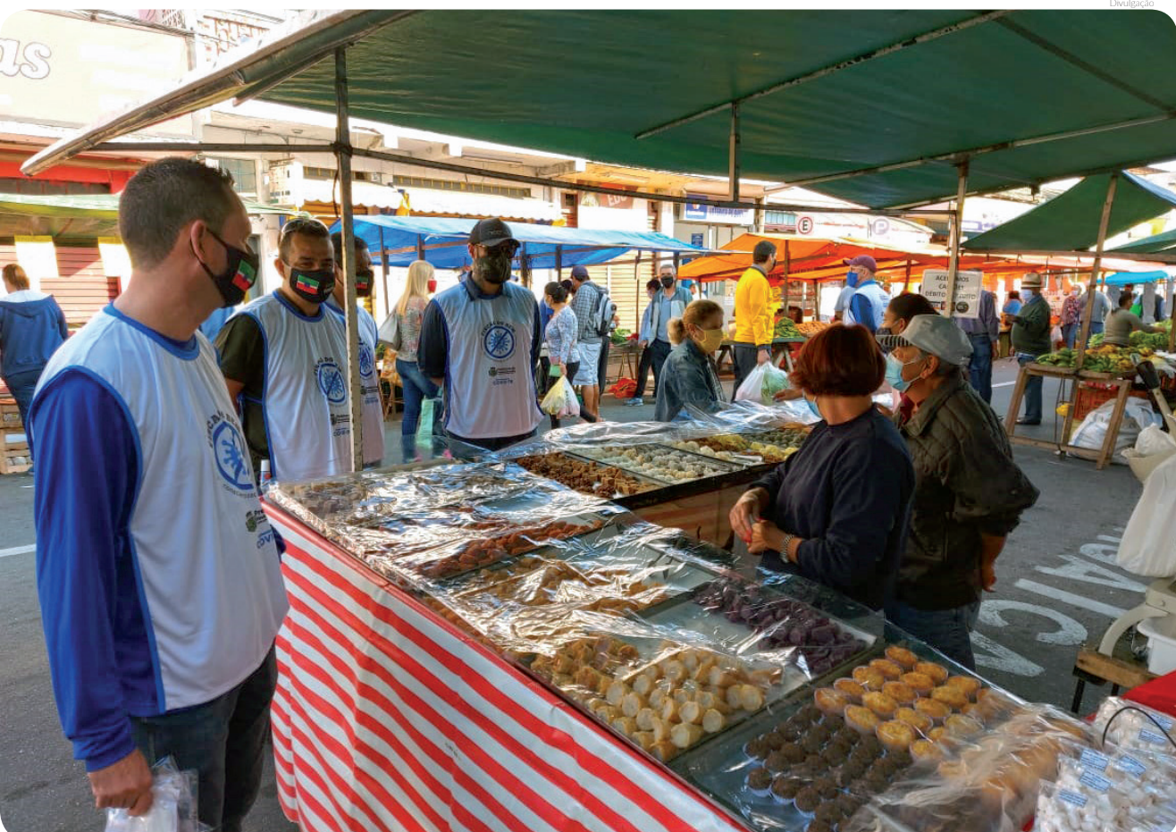
Os voluntários orientaram feirantes e lojistas quanto ao uso de máscaras e outros procedimentos