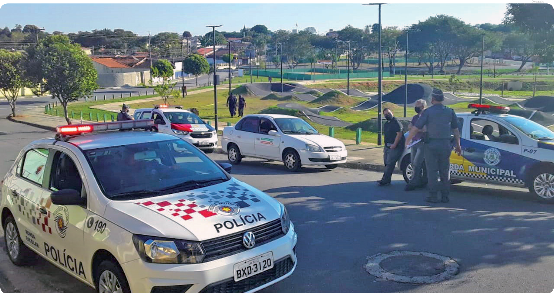
Participaram da operação além da PM e GCM, representantes da equipe do Departamento de Fiscalização e Posturas, Fiscalização de Rendas e Vigilância Sanitária