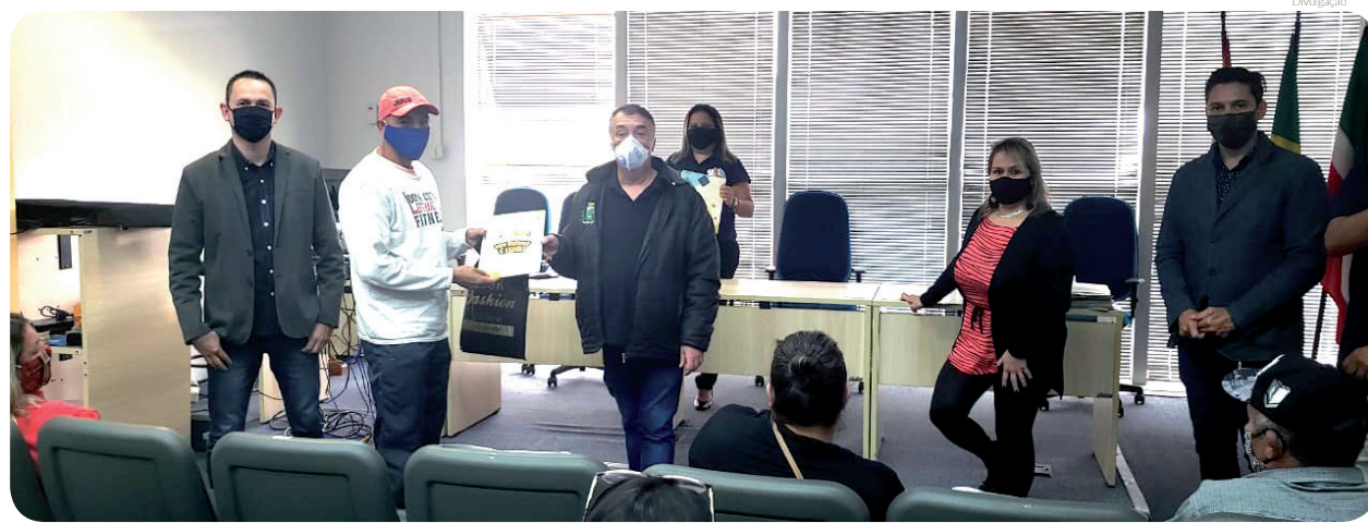
Essa foi a primeira vez que a Prefeitura efetuou a Regularização Fundiária de um bairro consolidado e irregular

Emoção e alegria marcam a entrega da documentação de regularização fundiária para 91 famílias do Loteamento Paulino de Jesus, em Moreira César. Implantado em 1982, o bairro aguardava há mais de vinte anos por essa ação da Prefeitura de Pindamonhangaba.