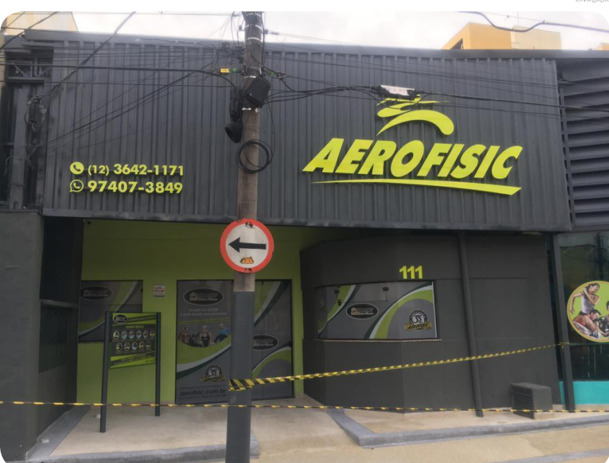
Fachada da academia Aerofisic, que completa 35 anos em Pinda