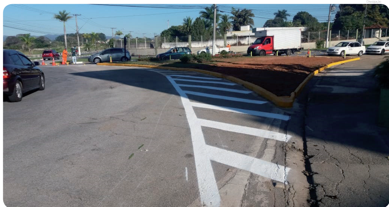
A rotatória, que dá acesso ao shopping, recebeu novos dispositivos de segurança e espaço para jardinagem

Após a retirada das malhas de concreto, os canteiros dos trevos ao entorno da rotatória receberam extensão e novo espaço de jardinagem e a rotatória ganhou novos dispositivos de segurança, melhorando a trafegabilidade e organizando melhor o trânsito do local.