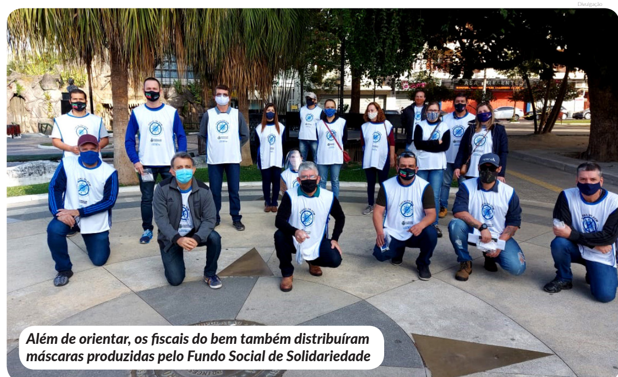
Além de orientar, os fiscais do bem também distribuíram máscaras produzidas pelo Fundo Social de Solidariedade

A próxima ação dos fiscais do bem será nesta terça-feira (7), junto aos comerciantes do centro da cidade.