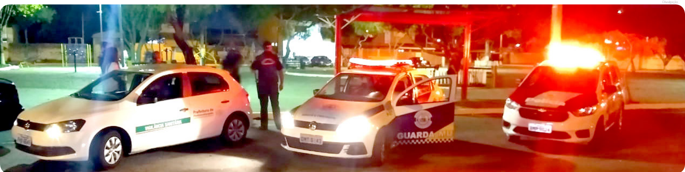
Participaram da operação além da PM e GCM, representantes da equipe do Departamento de Fiscalização e Posturas, Fiscalização de Rendas e Vigilância Sanitária

A Polícia Militar e a Guarda Civil Metropolitana da Prefeitura de Pindamonhangaba realizaram, novamente, no último final de semana, a “Operação Fica em Casa”, objetivando percorrer os locais públicos de maiores movimentações e desestimular as aglomerações.