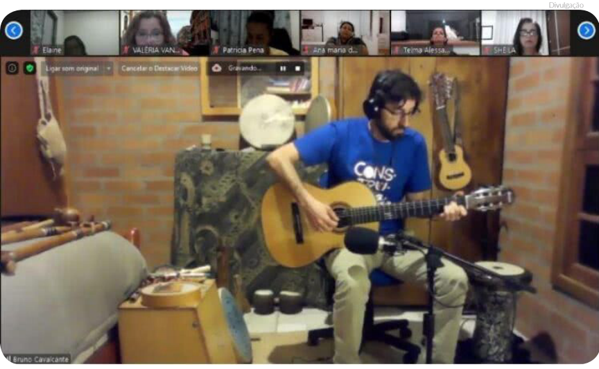
O projeto segue até novembro e conta com 3 músicos educadores