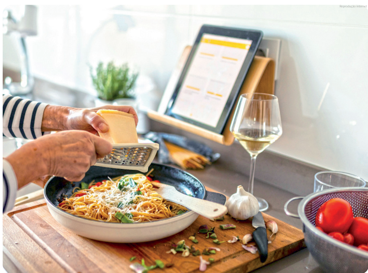
Entre os sete cursos oferecidos nas oficinas do projeto Reinvente está o de culinária

O Fundo Social de Solidariedade abriu nova rodada de inscrição para sete cursos das Oficinas do projeto Reinvente. As inscrições estão abertas até o próximo dia 2 de novembro e os cursos disponíveis são: maquiagem, manicure, culinária, elétrica básica, eletroeletrônica, manutenção de computador e inclusão digital.