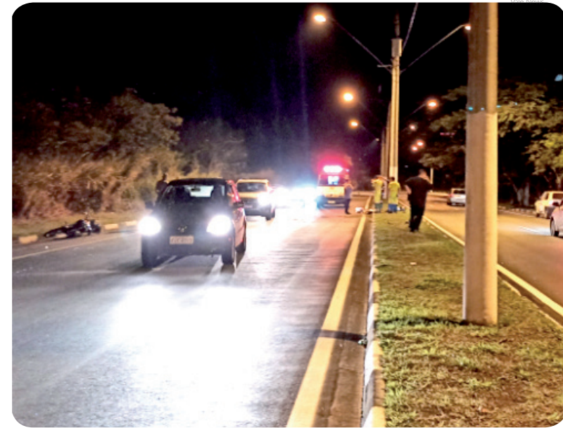
Um motociclista morreu após se envolver em um acidente próximo ao Parque da Cidade, no Anel Viário

Dois acidentes graves nos últimos dias deixaram uma pessoa morta e outra gravemente ferida em Pindamonhangaba.