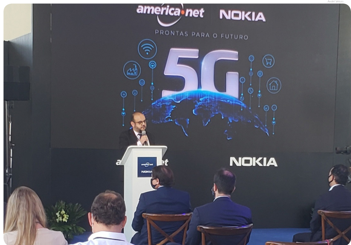
A operadora promoveu um showcase para convidados no pátio da Prefeitura de Pindamonhangaba

O projeto segue até novembro e conta com 3 músicos educadores para formação de 40 professores na cidade, beneficiando aproximadamente 800 crianças de 12 escolas públicas de Pindamonhangaba.