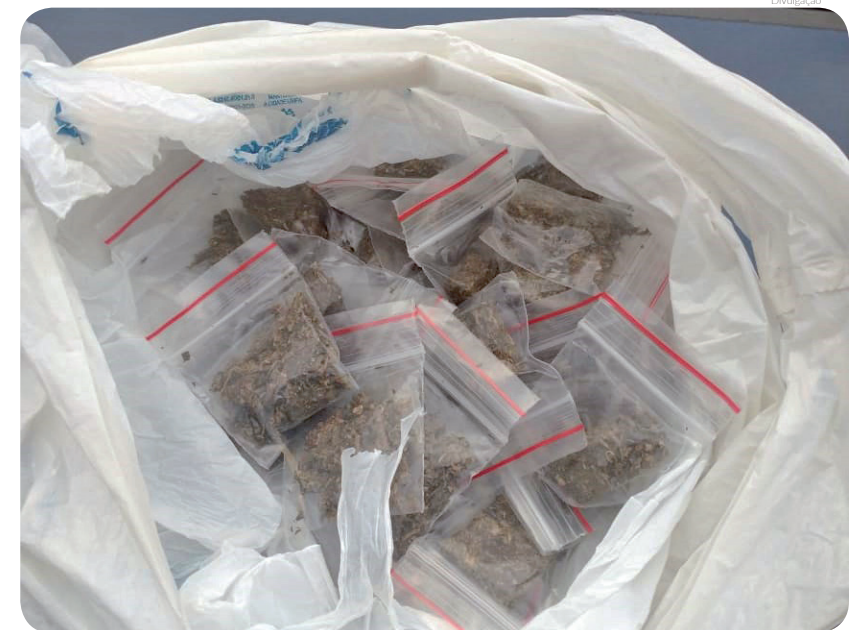
Com a ajuda da cadela Aine, a GCM encontrou 26 porções de maconha