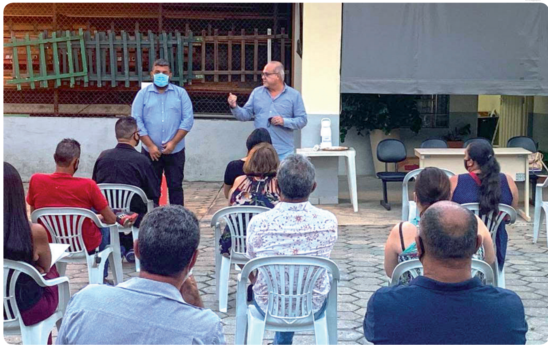
Piorino aproveitou o encontro para informar que assumiu também a área de Serviços Públicos em sua secretaria