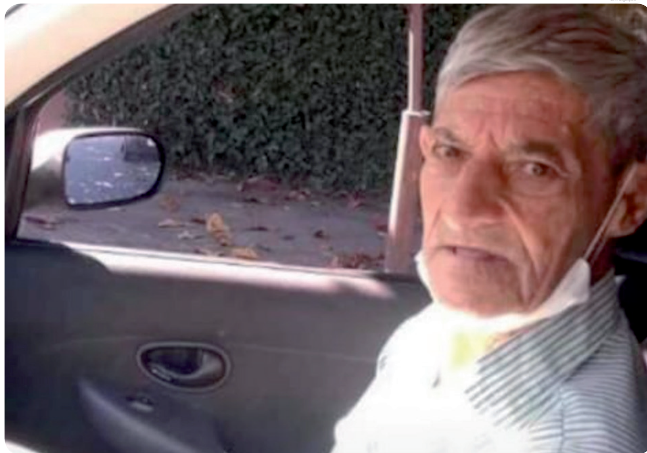
Qualquer informação, avise a família pelos telefones: (12) 99104-1202 e (12) 99103-5202 ou a polícia