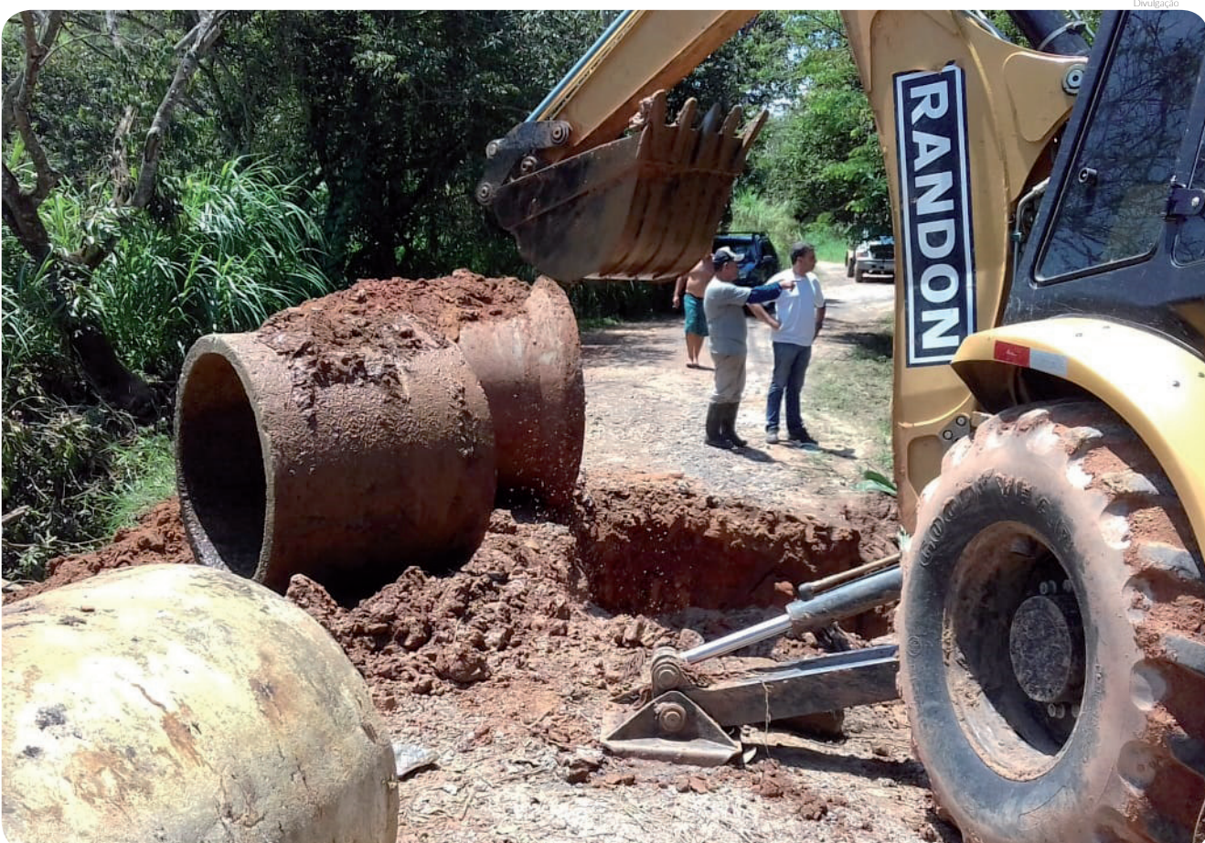
Atendimento realizado na quarta-feira, dia 13, no Pinhão do Borba