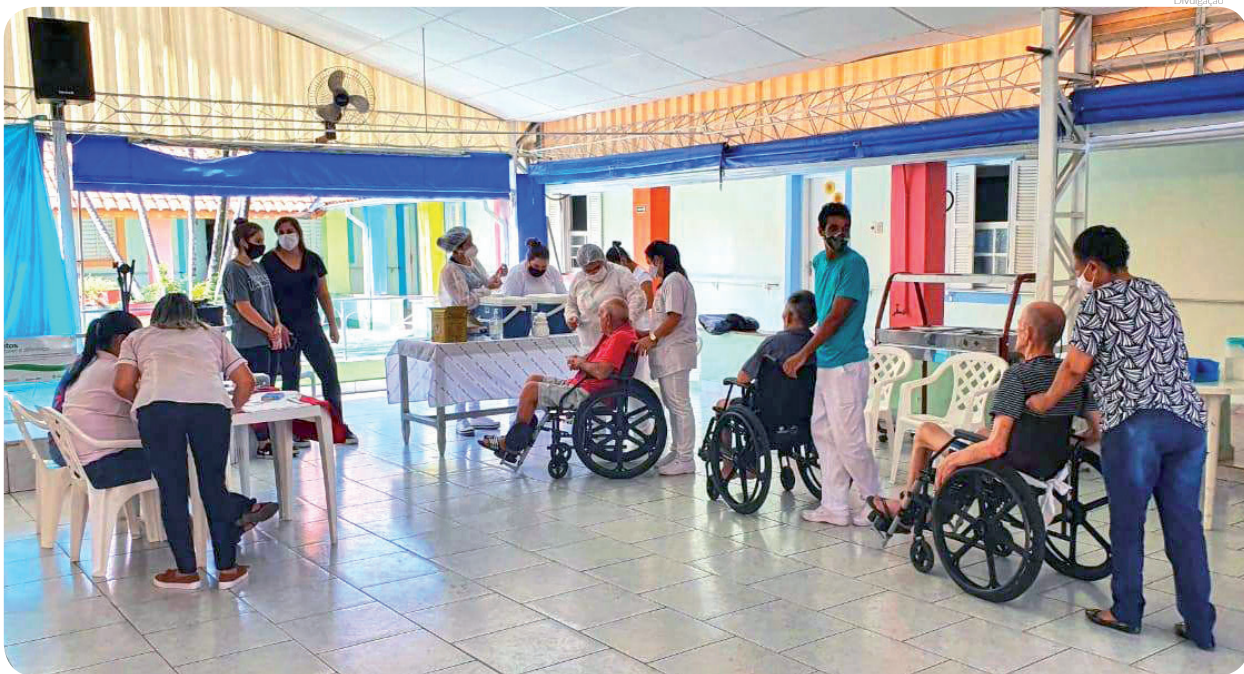
Idosos de lares assistenciais receberam a primeira dose da vacina