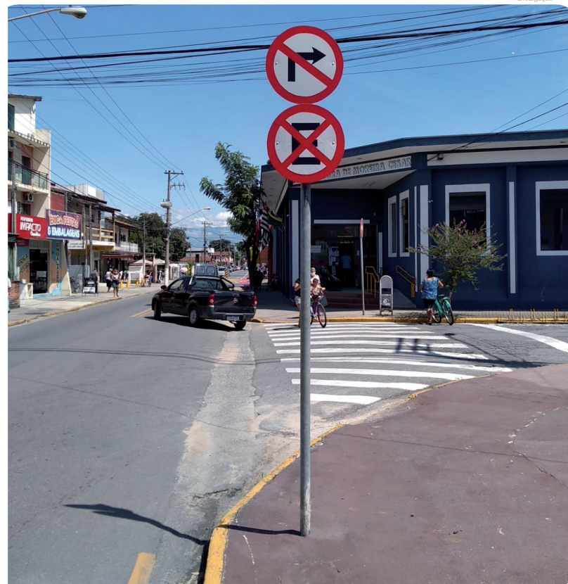
Novas placas colocadas em Moreira César

Moreira César – Outra região que também recebeu a pintura foi o Distrito de Moreira César, com a realização de serviços próximo à Subprefeitura, Praça São João e Praça do Cisas. Além da revitalização na sinalização horizontal (ciclofaixa, lombadas, etc), diversas placas de Pare, Proibido Parar ou Estacionar, entre outras, foram colocadas nas esquinas e cruzamentos de Moreira César.