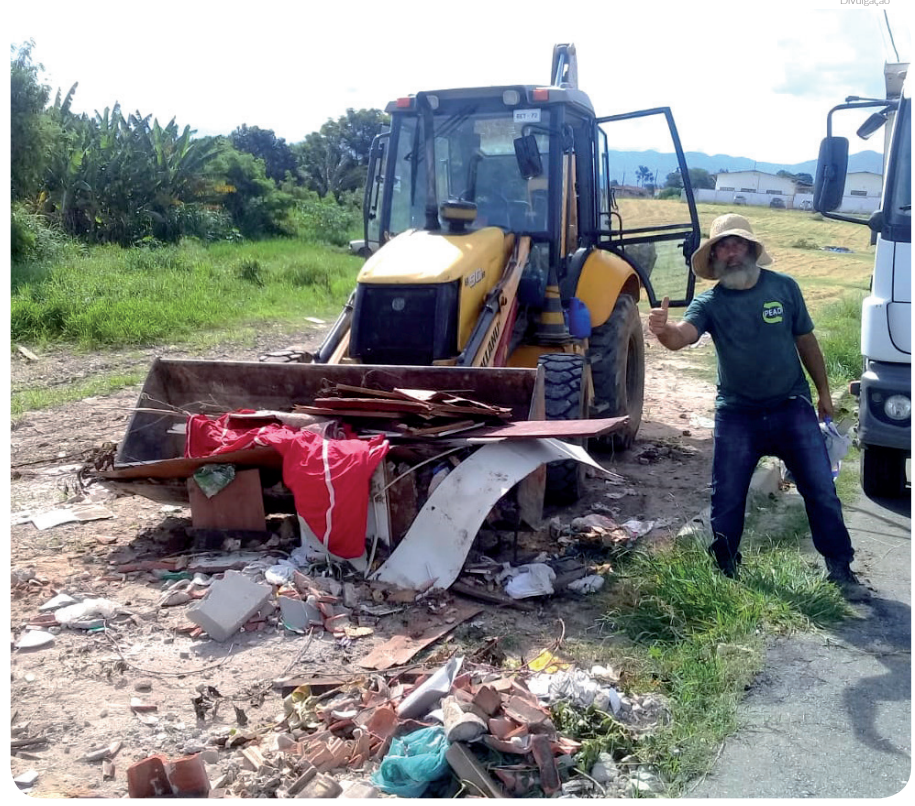
Região do Araretama recebeu limpeza realizada pelos funcionários do DLP

O depósito irregular de resíduos em espaço público pode ocasionar alto índice de proliferação de ratos e animais peçonhentos, além de proporcionar o aumento de foco para criação do mosquito transmissor da Dengue.