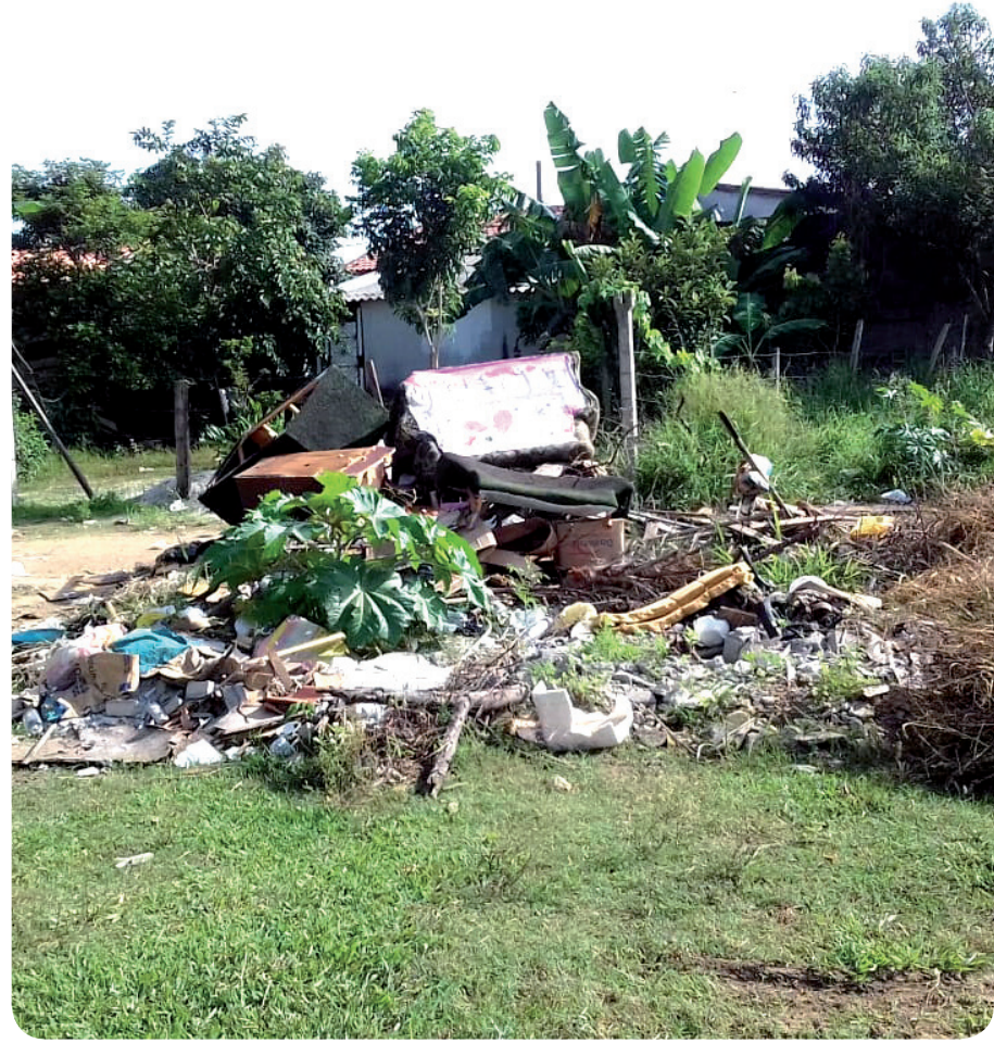
Grande quantidade de lixo e resíduos é retirada no bairro Karina