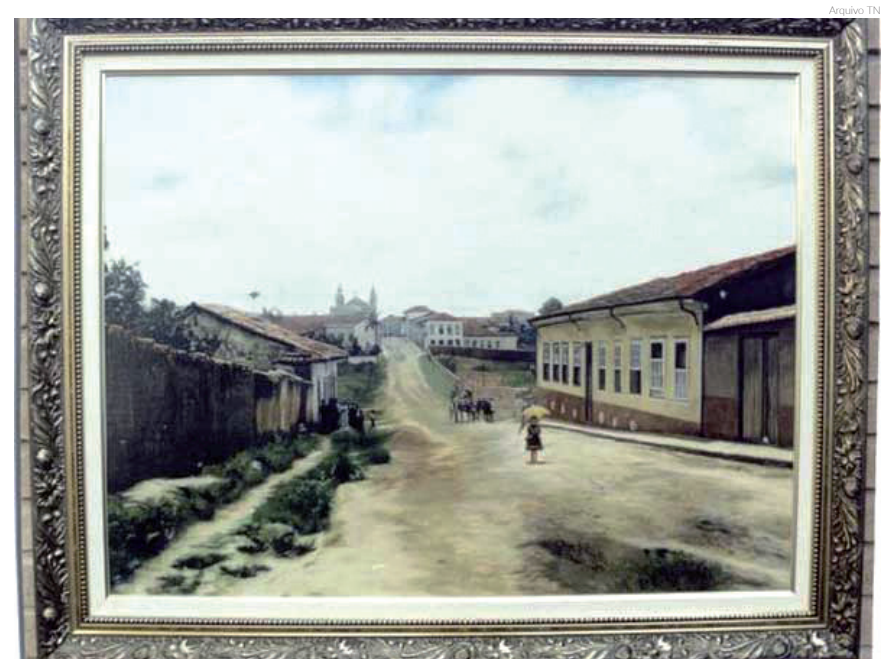
Trecho no qual a "Prudente de Moraes" e a "São João Bosco" se encontram (óleo sobre tela do artista Hélio Hatanaka retratando a histórica foto do início do século XX, de autoria de Malaquias Marcondes Neto)

Malaquias Marcondes Neto era um farmacêutico muito dedicado à arte de fotografar, na época, 'tirar retrato'. Nascido em Pindamonhangaba em 17 de fevereiro de 1881, era filho de Benedicto Marcondes Monteiro e Ignacia Benedita de Castro. Casando-se em 31 de janeiro de 1903 com a também pinda-mo-