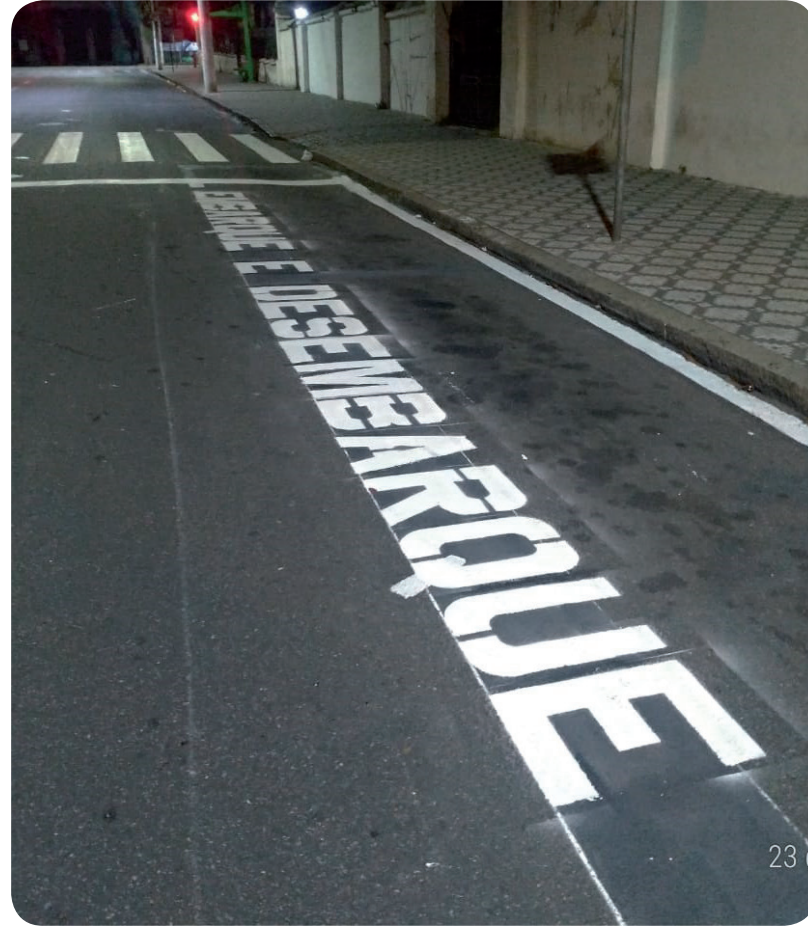
Pintura na rua Cel. Fernando Prestes região central Pinda

Região Central – Nos últimos dias a região central, como Rua Campos Sales, Travessa Guaianazes, Rua Martin Cabral e Cel. Fernando Prestes receberam reforço importante na sinalização de solo com a revitalização de faixa de pedestres, PARE e setas de indicação de sentido de direção. Nesses locais de maior movimentação, os serviços são realizados no período noturno, para não proporcionar transtornos ao tráfego. A rua Taubaté também recebeu sinalização para indicar melhor o sentido de trânsito para acesso ao bairro.