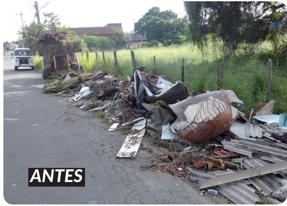
Limpeza no Distrito de Moreira César