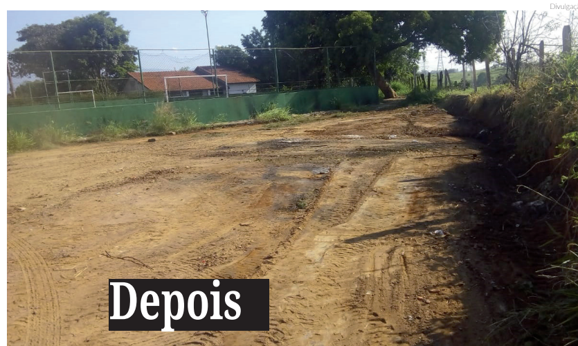
Proximidade do Vila Prado