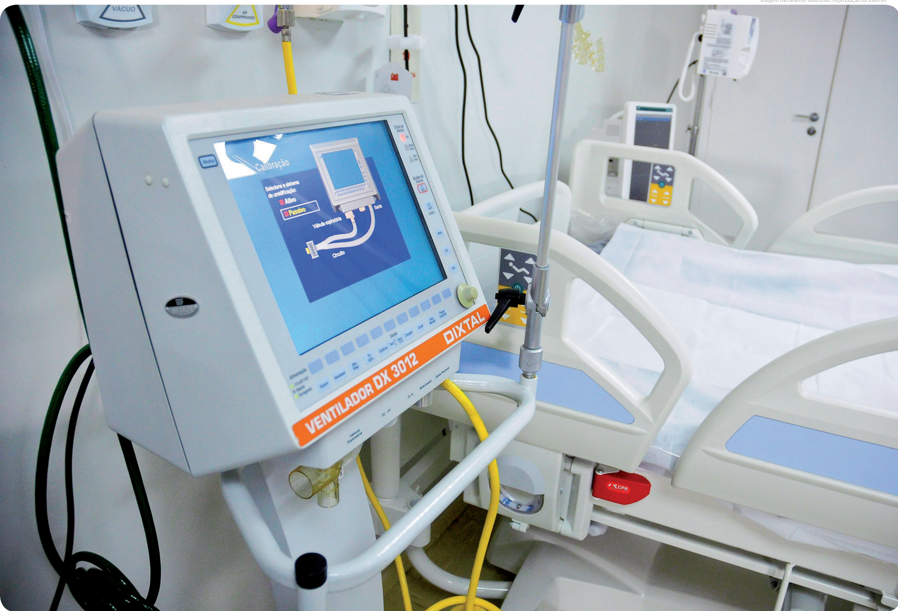
Imagem meramente ilustrativa

A Prefeitura de Pindamonhangaba anunciou, na sexta-feira (29), novas medidas que disponibilizarão mais leitos de UTI na rede pública para o enfrentamento da pandemia no município.