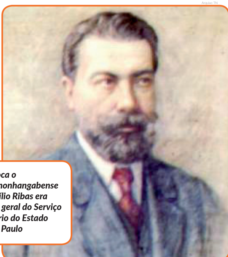
Na época o pindamonhangabense Dr. Emilio Ribas era diretor geral do Serviço Sanitário do Estado de São Paulo

Prosseguindo no relatório das condições que haviam assumido o governo, o intendente esperava que o chefe da Comissão Sanitária compreendesse a difícil situação em que se encontrava a administração municipal, por melhor disposição que tivesse para atender de pronto aos diferentes serviços enumerados pelo médico. Deixava claro que entre a natureza de tais irregularidades havia especial interesse pelo saneamento da cidade e que