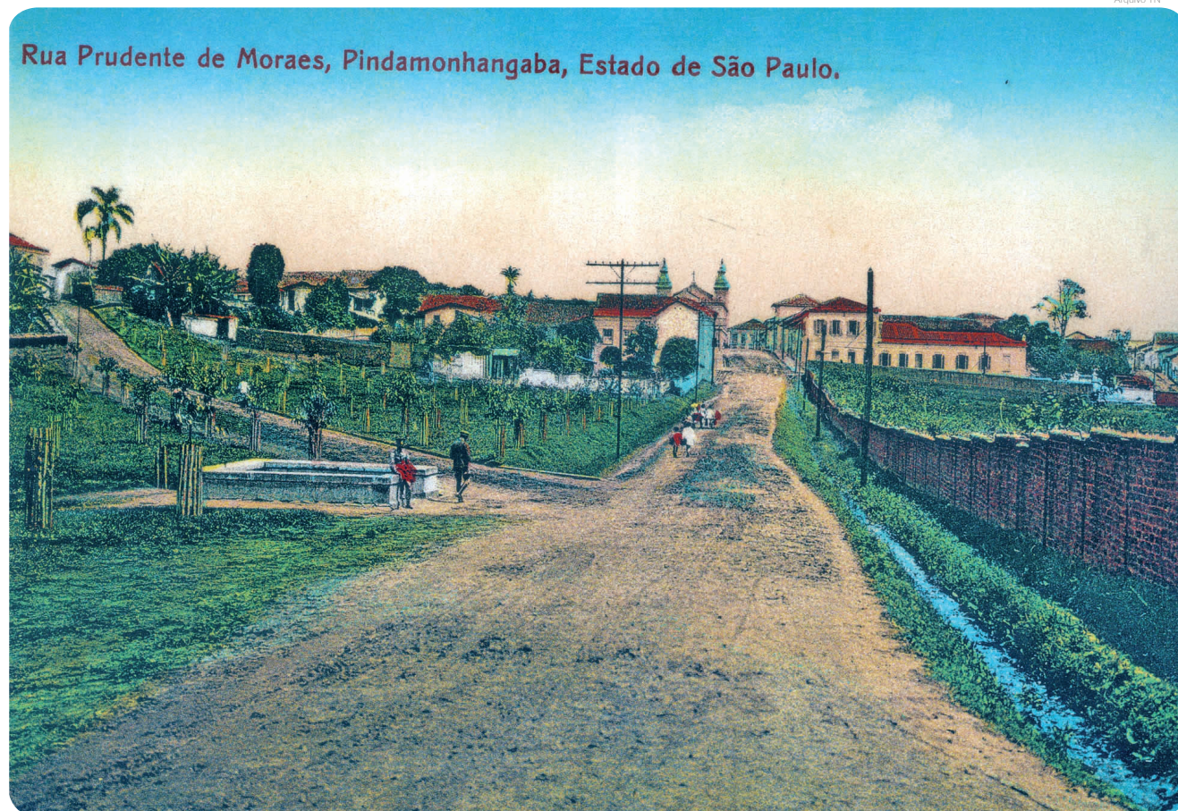
"...O mato crescido afeando até os pontos destinados a recreio da população, como os jardins e praças públicas..."

Alertava que o lixo abandonado e o mato crescido contribuíam para o aumento no número de ratos, considerados o maior perigo para a saúde pública naquele momento em que se verificava a luta contra a peste (referia-se à peste bubônica, uma das epidemias combatidas por Oswaldo Cruz no início do século XX). "Encontrando farto alimento no lixo acumulado nas ruas e seguro esconderijo na