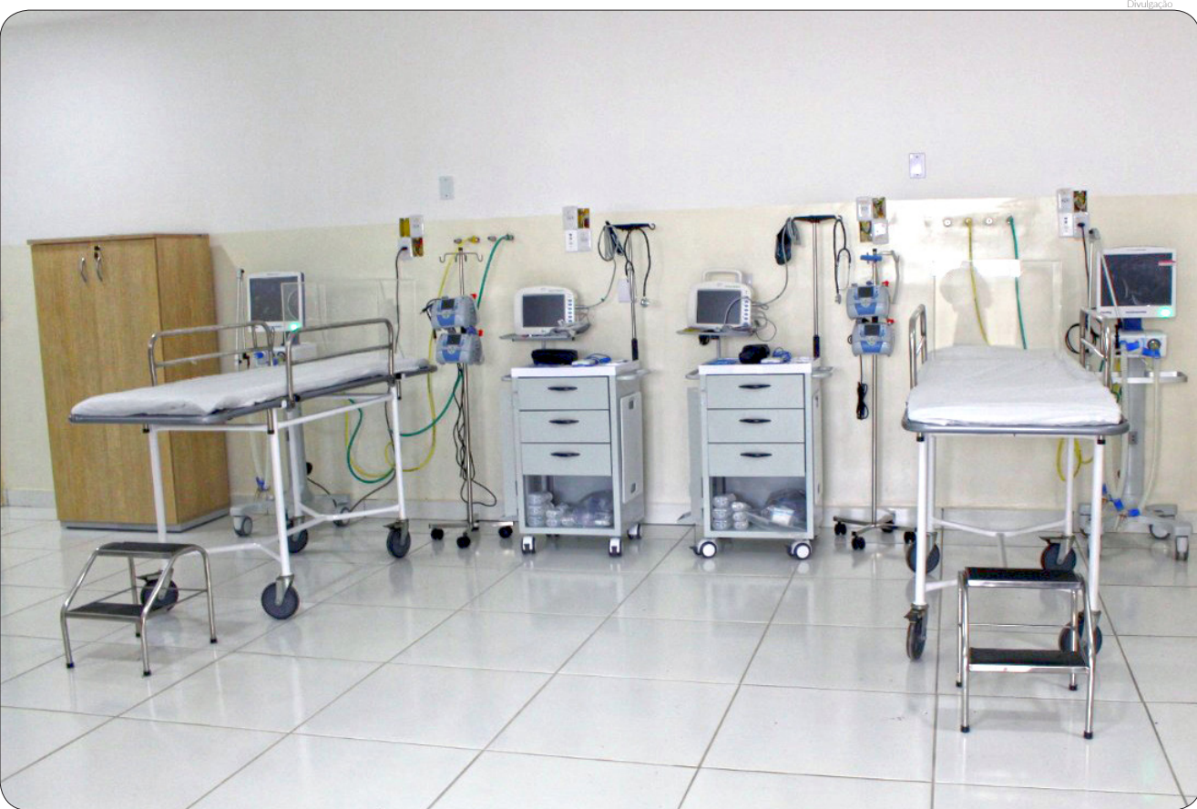
Ao todo, Pinda passa a contar com 33 leitos de UTI incluindo as redes de saúde pública e privada

Até dezembro o município registrava média de 60 novos casos e em janeiro chegou a atingir a marca de 180 novos casos.