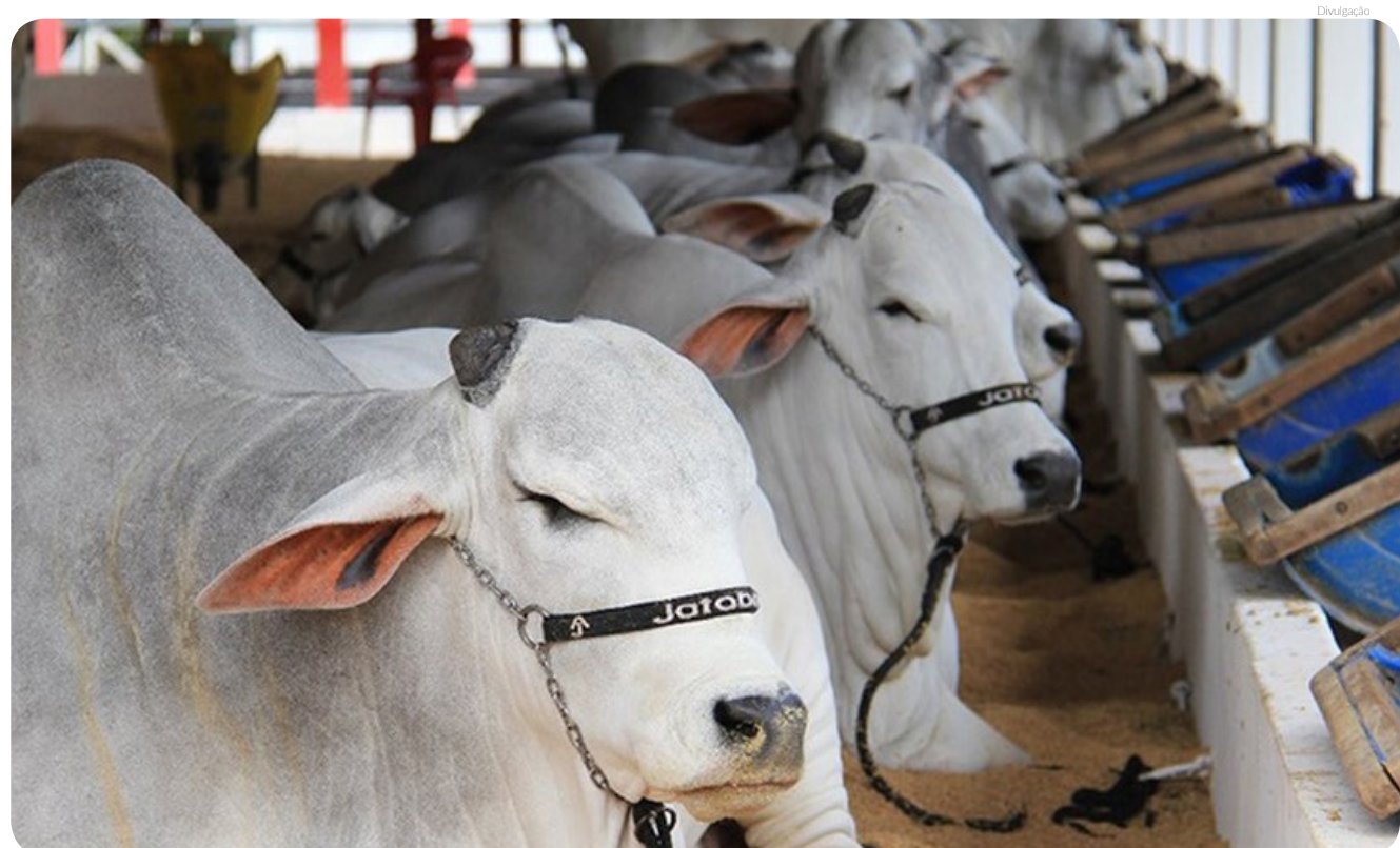
Crime ocorreu na quarta-feira (27). Animais eram utilizados em pesquisas sobre pecuária

Mais uma vez fazemos um apelo: saia somente o necessário! Use máscara o tempo todo em que estiver na rua! Evite aglomerações! Sejam cidadãos conscientes! Acreditem na ciência! Protejam-se e protejam os seus!