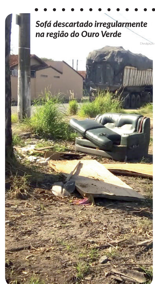
Sofá descartado irregularmente na região do Ouro Verde