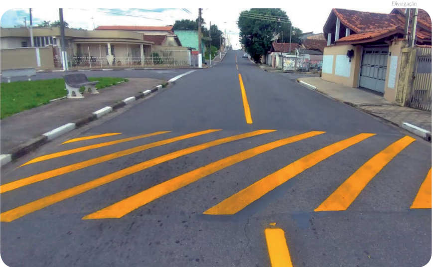
Sinalização horizontal no bairro do Campo Alegre