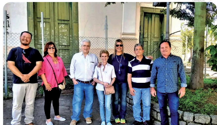
Parte do grupo que atua na preservação da história do município