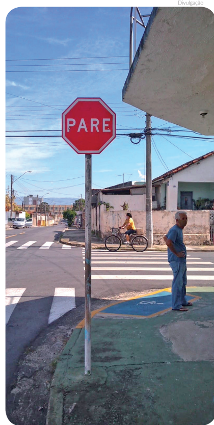
Ruas ganham placas de sinalização