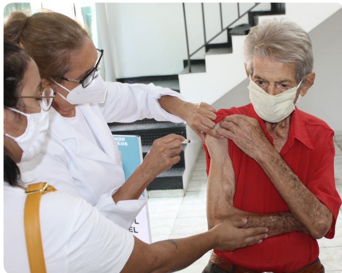
Faixa etária 85 anos: primeiro idoso a ser vacinado em Pindamonhangaba