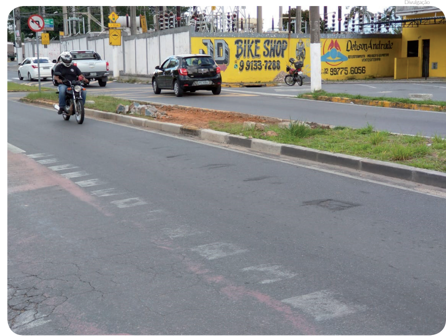
Correção do canteiro atendeu antiga reivindicação dos munícipes

Calçadas - A Secretaria de Governo e Serviços Públicos ainda vem realizando a correção das calçadas na rodovia Abel Fabrício Dias (SP 62) que estavam com piso de concreto estufado. Os servidores vêm finalizando a concretagem e devolvendo o espaço para o pedestre transitar com mais segurança.