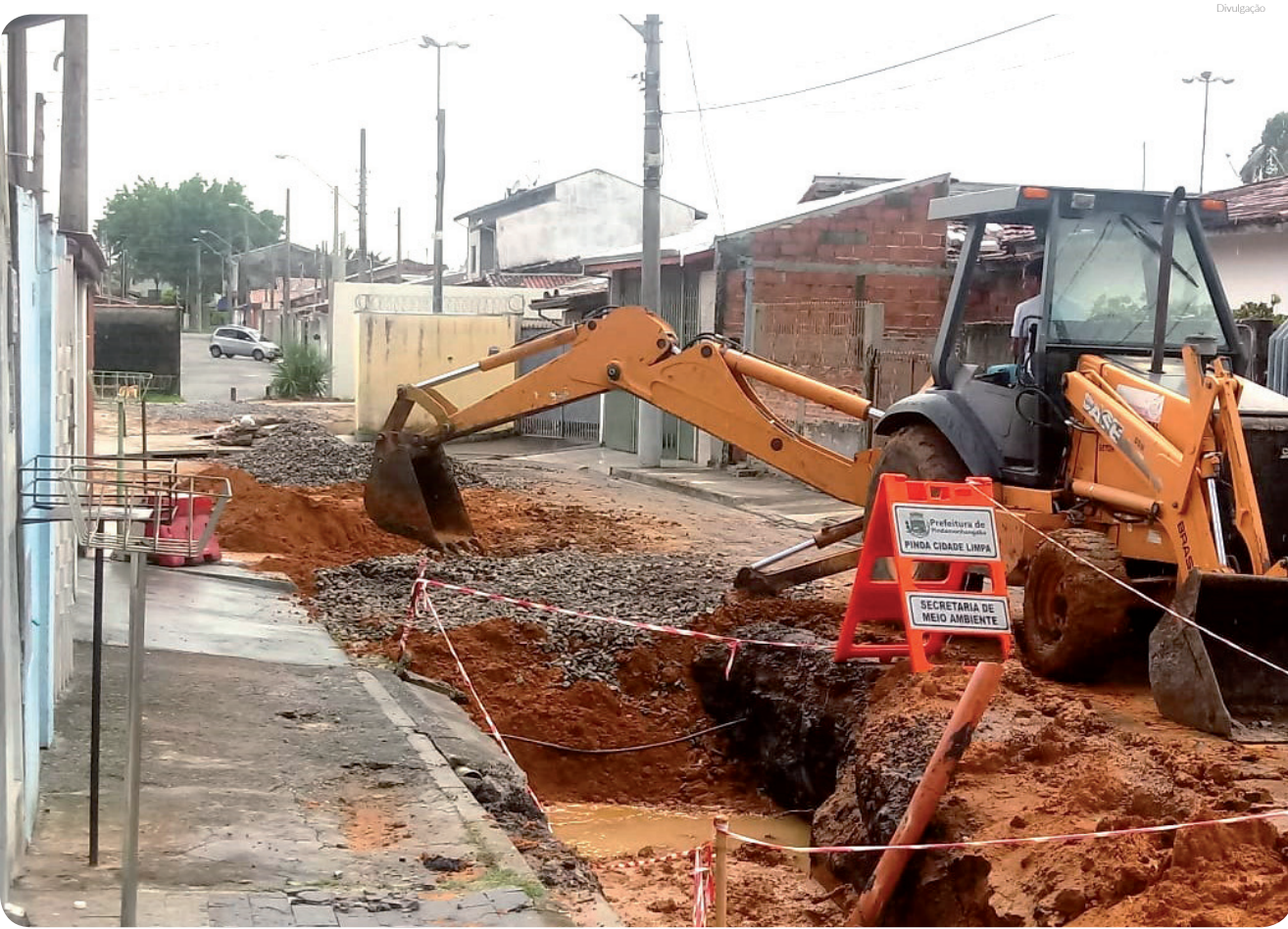
Servidores vêm realizando limpeza de 'boca de lobo'; troca de tampas e implantação de novas 'bocas de lobos' para sanar problemas

dos contemplaram ações nas galerias dos seguintes locais: rua Anacleto Rosa Junior (Cidade Jardim); avenida Teodorico Cavalcante (Boa Vista); rua Shiduca Yassuda (Jardim Morumbi) e diversos pontos no loteamento Castolira – bairro que registrou alagamento na última semana.