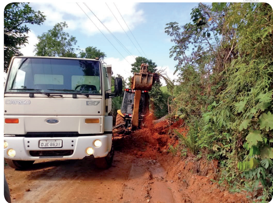
Em períodos de chuvas, atenção às estradas rurais é redobrada