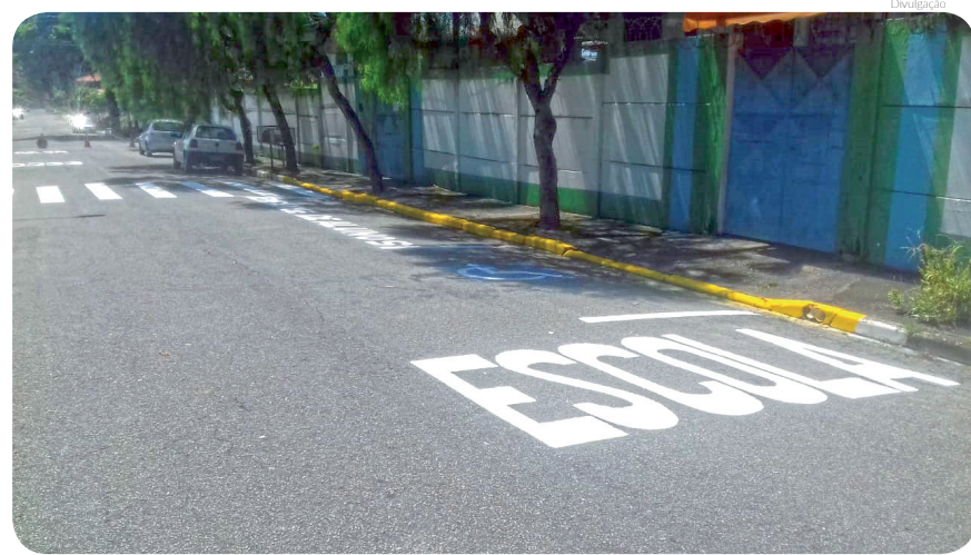
Zeladoria revitalizou sinalização próxima a escolas

Cícero Prado - Outro bairro que recebeu em sua totalidade