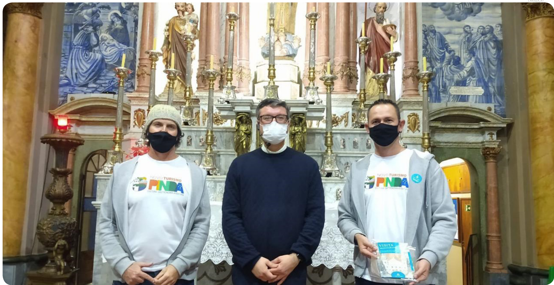
Visitantes puderam aprender sobre a arquitetura e a história da igreja, e também sobre o 'Projeto Restau'

religioso sobre o prédio; sobre a igreja; destacando as pinturas; o significado dos desenhos; a história de cada um dos altares, enfim, até chegarmos à imagem da Nossa Senhora do Bom Sucesso”, explicou o