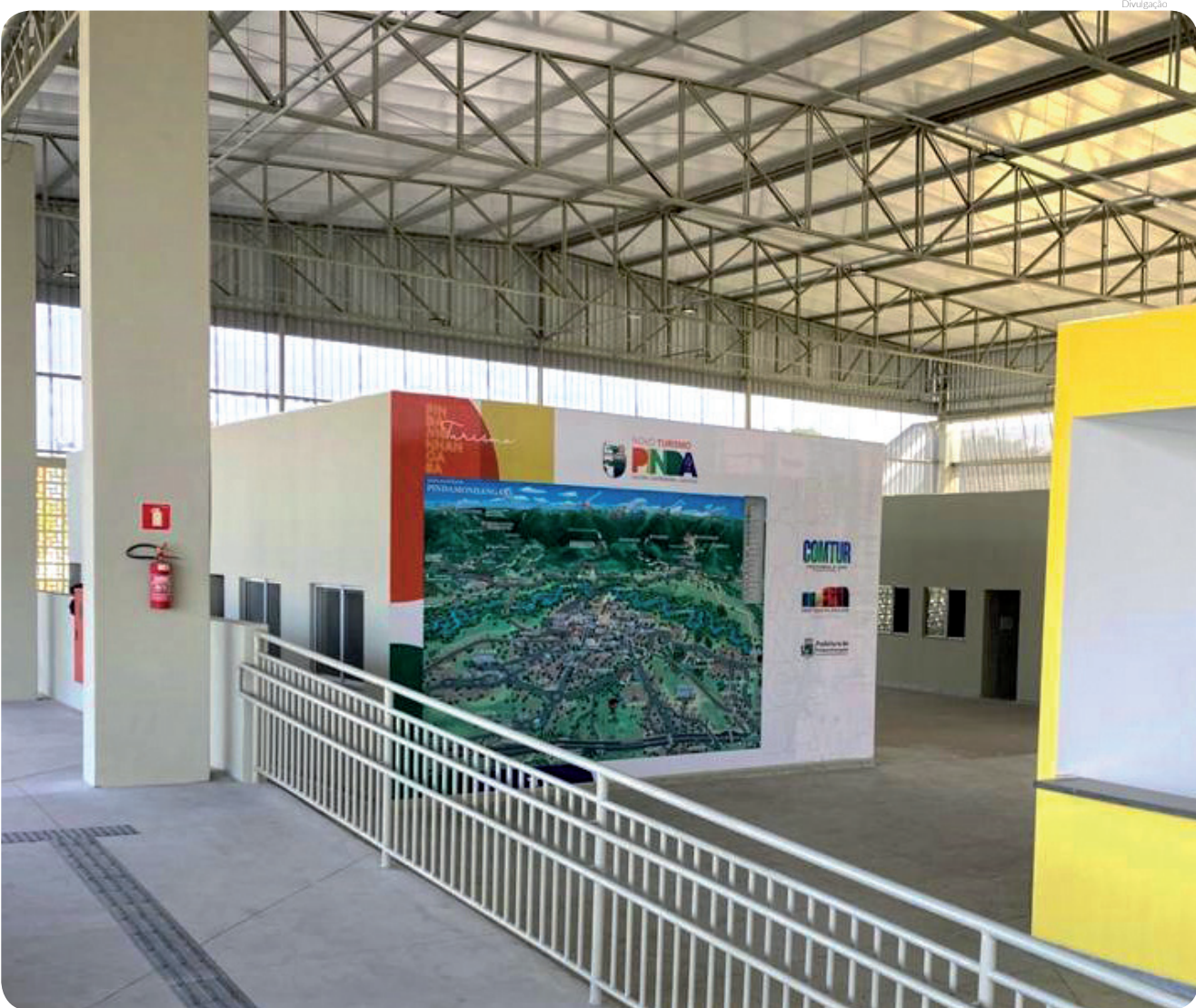
Instalação integra medidas que visam adequar a cidade para uma futura abertura do Turismo