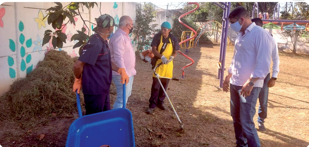
As 60 unidades escolares terão serviços de manutenção e zeladoria dos seus prédios públicos