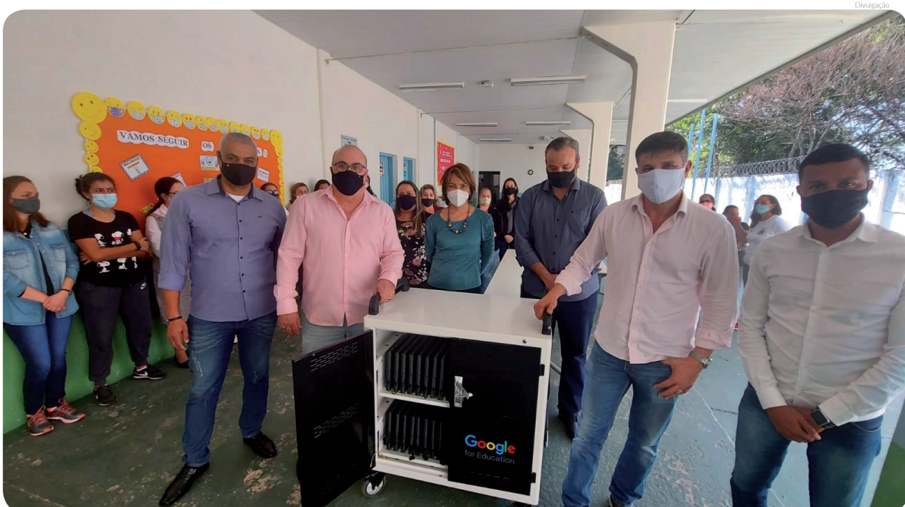
Ao todo, o município entregará 2.500 equipamentos de chromebooks para este novo semestre

Pindamonhangaba retomará de forma gradual as aulas na rede municipal de ensino com boas notícias para a comunidade escolar. Após realizar a entrega para professores no início do mês, a Secretaria de Educação iniciou nesta terça-feira (27) a entrega de carrinhos de chromebooks para uso compartilhado dos alunos nas 39 escolas que atendem alunos da educação infantil e ensino fundamental (anos iniciais).