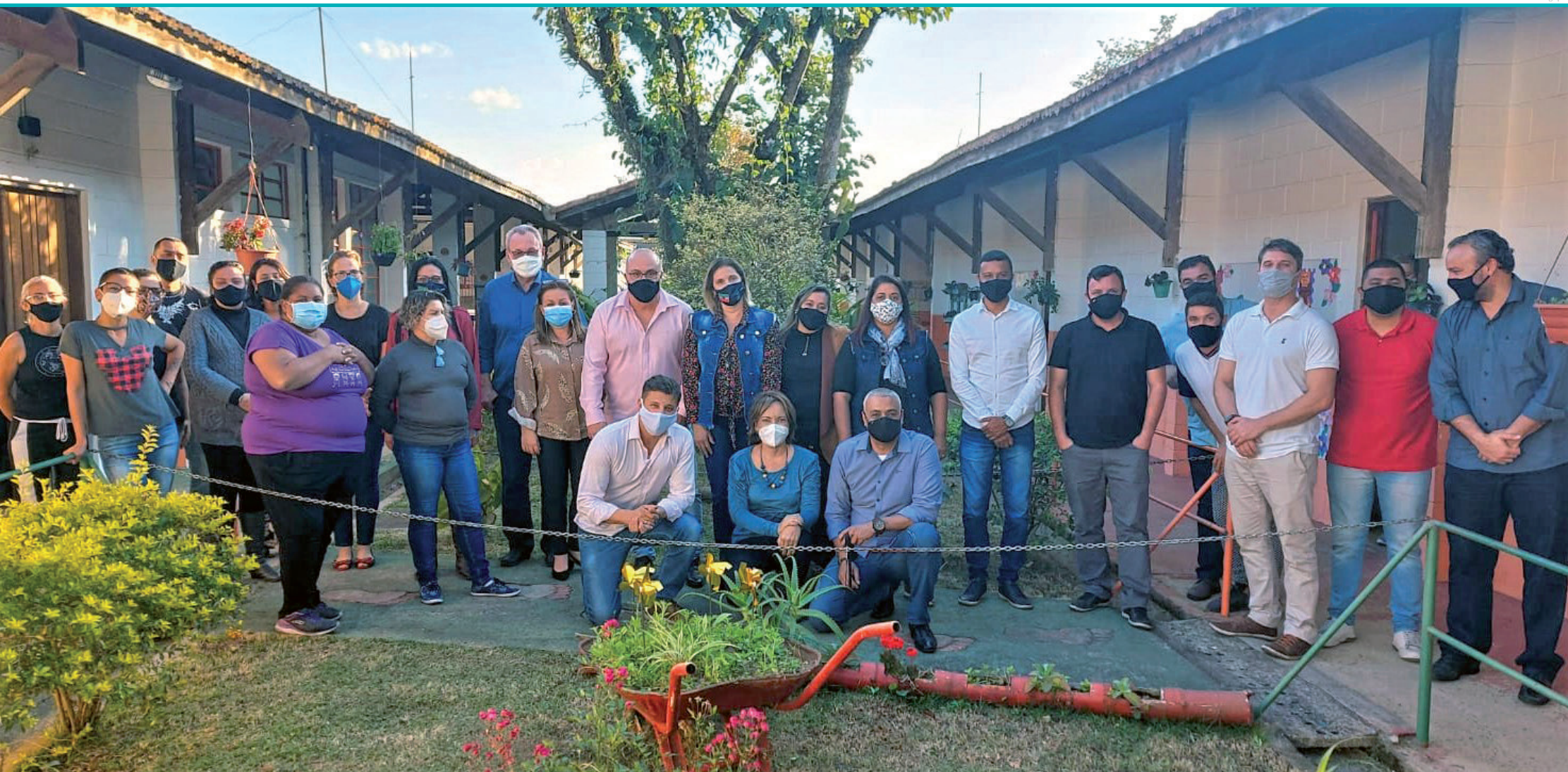
Estiveram presentes à cerimônia de entrega dos aparelhos diversas autoridades, professores, gestores e servidores da unidade -escolar de Pindamonhangaba