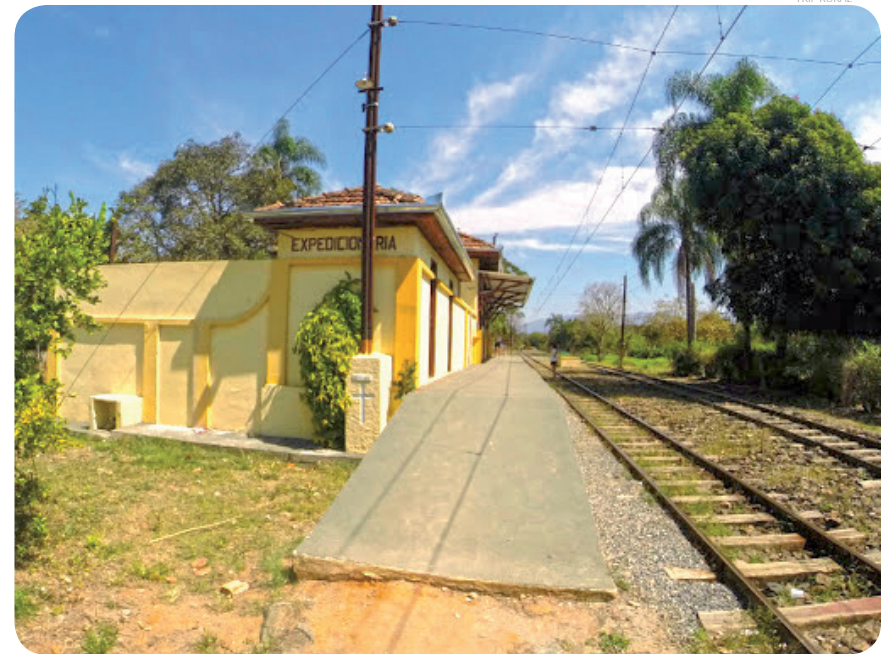
A Estação Bonsucesso foi aberta em 1916 e permaneceu com essa denominação até 1940, quando, em homenagem aos pracinhas da FEB - Força Expedicionária Brasileira, passou à Estação Expedicionária