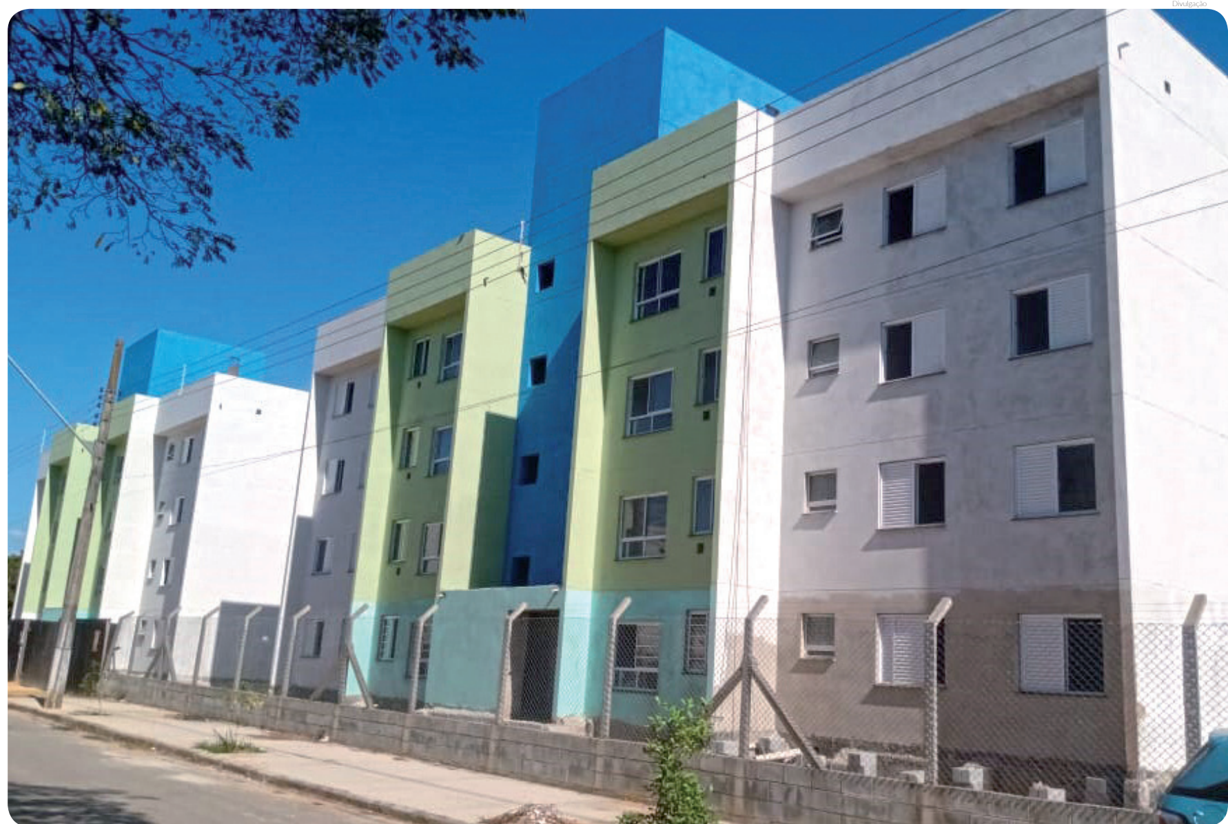
Foram realizados dois sorteios, transmitidos no Facebook Oficial da Prefeitura de Pindamonhangaba