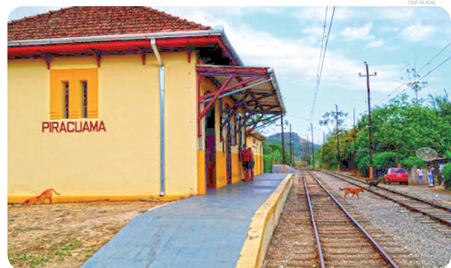
Estação Piracuama, também aberta em 1916