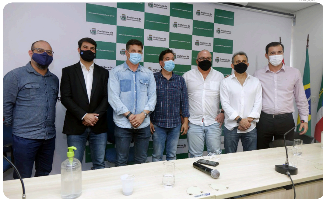
Programa direcionado ao ensino gratuito foi lançado no dia 24 de agosto