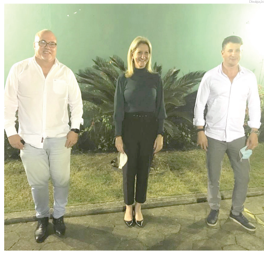
Estratégias para aquecimento do comércio de Pindamonhangaba estavam na pauta

radadores de rua que insistem em permanecer na rua, debaixo de marquises e portas de loja, bem como a permanência de pessoas próximas a semáforos e entre filas de veículos fazendo apresentações ou comercializando produtos. “Sabemos que é um problema social, temos que olhar com um carinho diferenciado, como já temos feito através da abordagem social e precisamos estender as mãos. Por isso estamos buscando um entendimento com nossos comerciantes para anunciar futuras medidas que possam sanar essa questão”, finalizou o vice-prefeito.