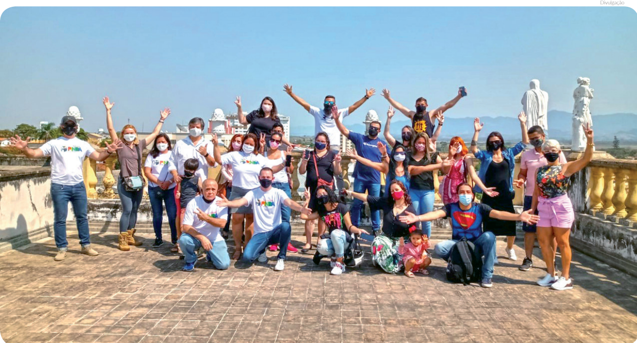
A segunda parada foi no Museu Histórico e Pedagógico Dom Pedro I e Dona Leopoldina