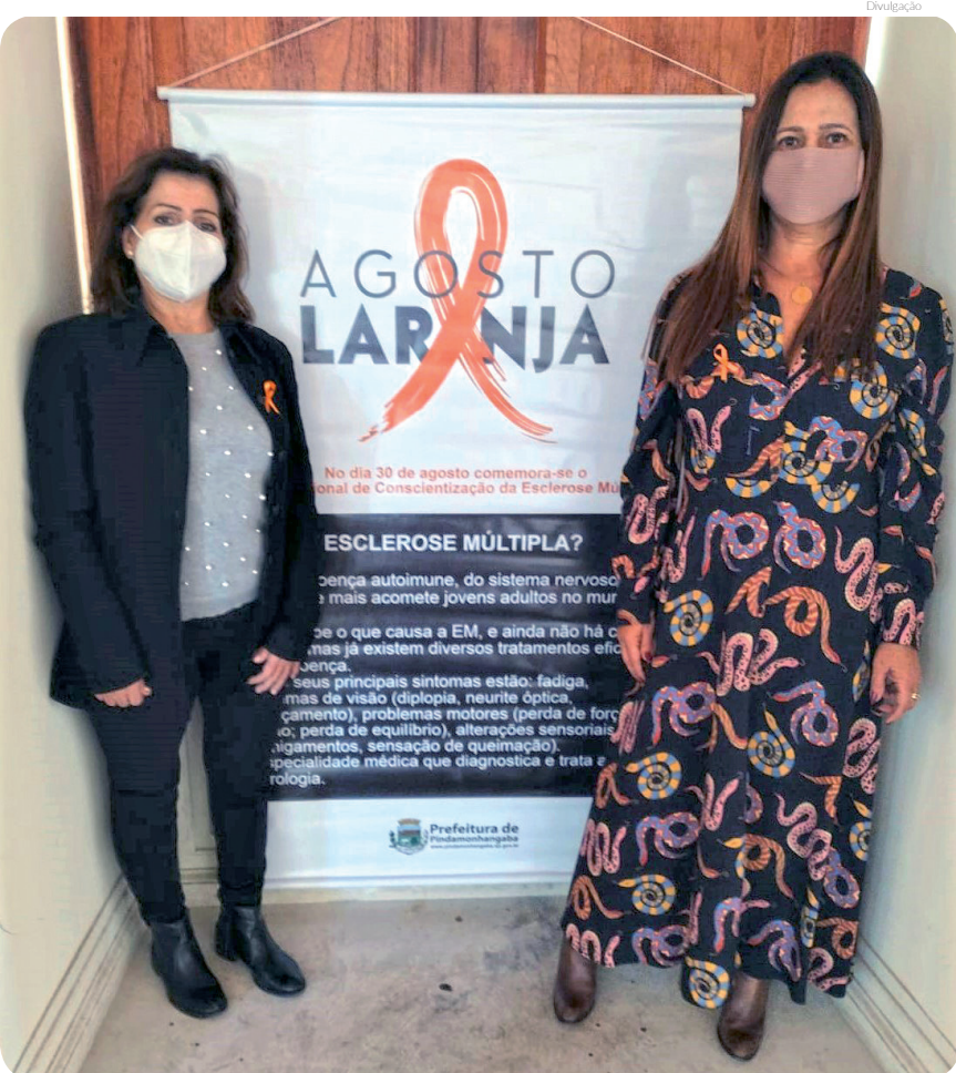
Em parceria com a Prefeitura, lançamento da campanha ocorreu no Museu – que ganhará iluminação laranja no próximo fim de semana