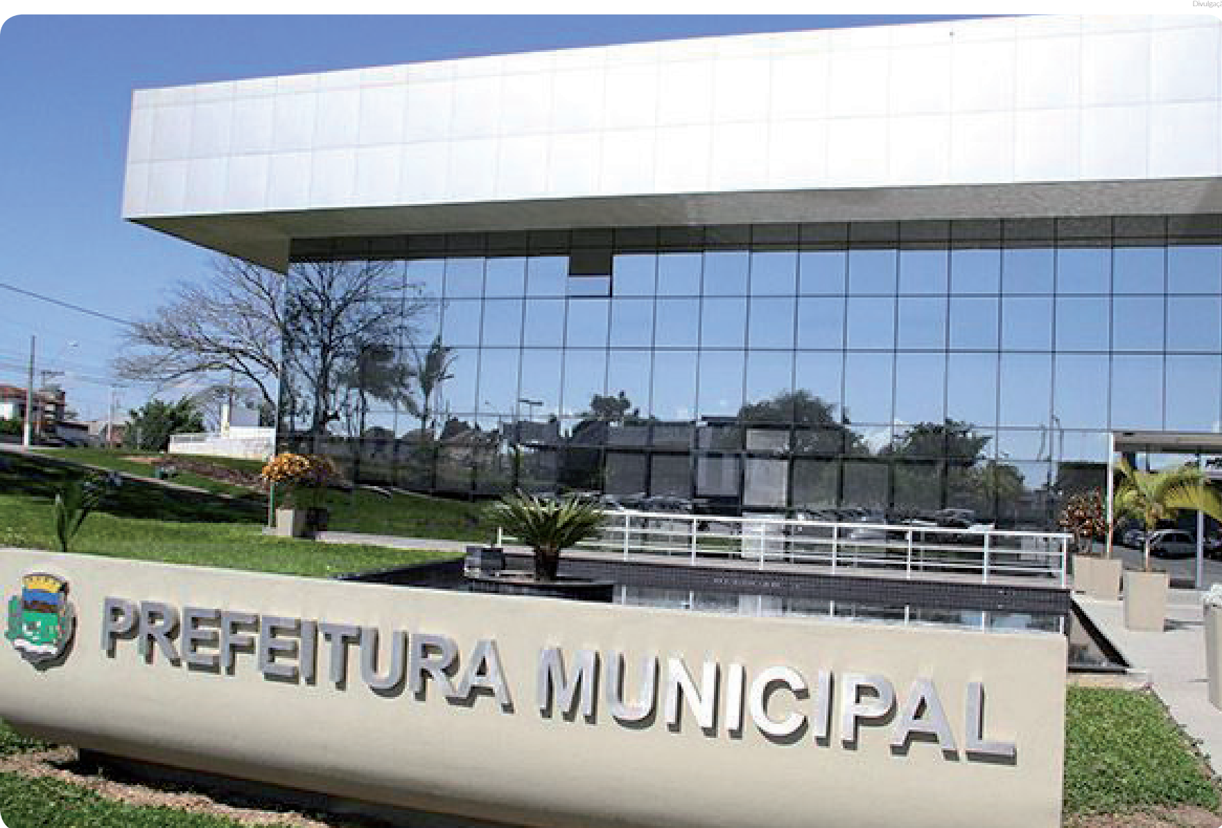
A convocação prevê a reposição de profissionais para preencher vagas de servidores que se aposentaram ou pediram demissão, por exemplo

A Prefeitura de Pindamonhangaba, por meio do Departamento de Recursos Humanos, está convocando 162 candidatos aprovados no Concurso Público 01/2019 para apresentação no período de 02 a 16 de setembro e ingresso no quadro de servidores públicos municipais.