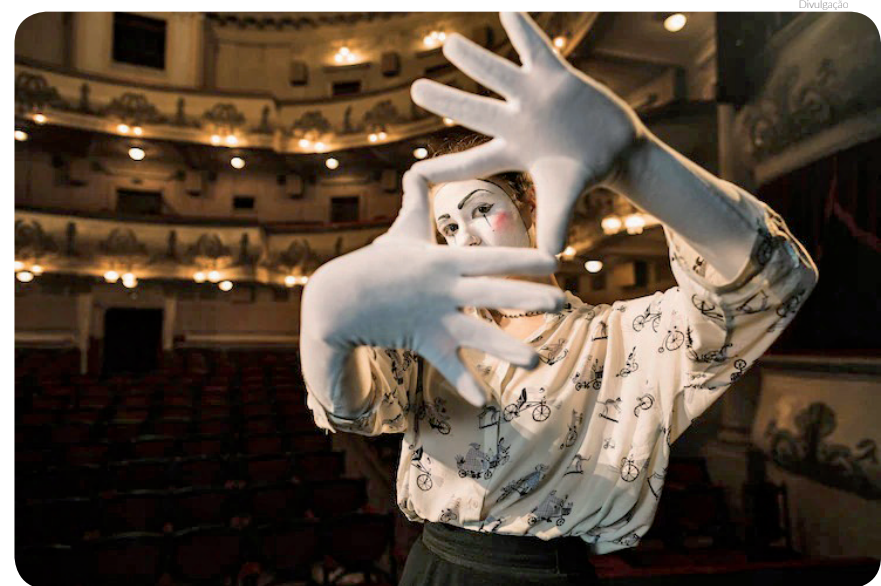
As inscrições vão até às 23h59 do dia 26 de junho de 2022

Para conferir o edital completo, acesse o site https://www.pindamonhangaba.sp.gov.br/secretarias/cultura-e-turismo e clique no botão "Linguagens Artísticas 2022".