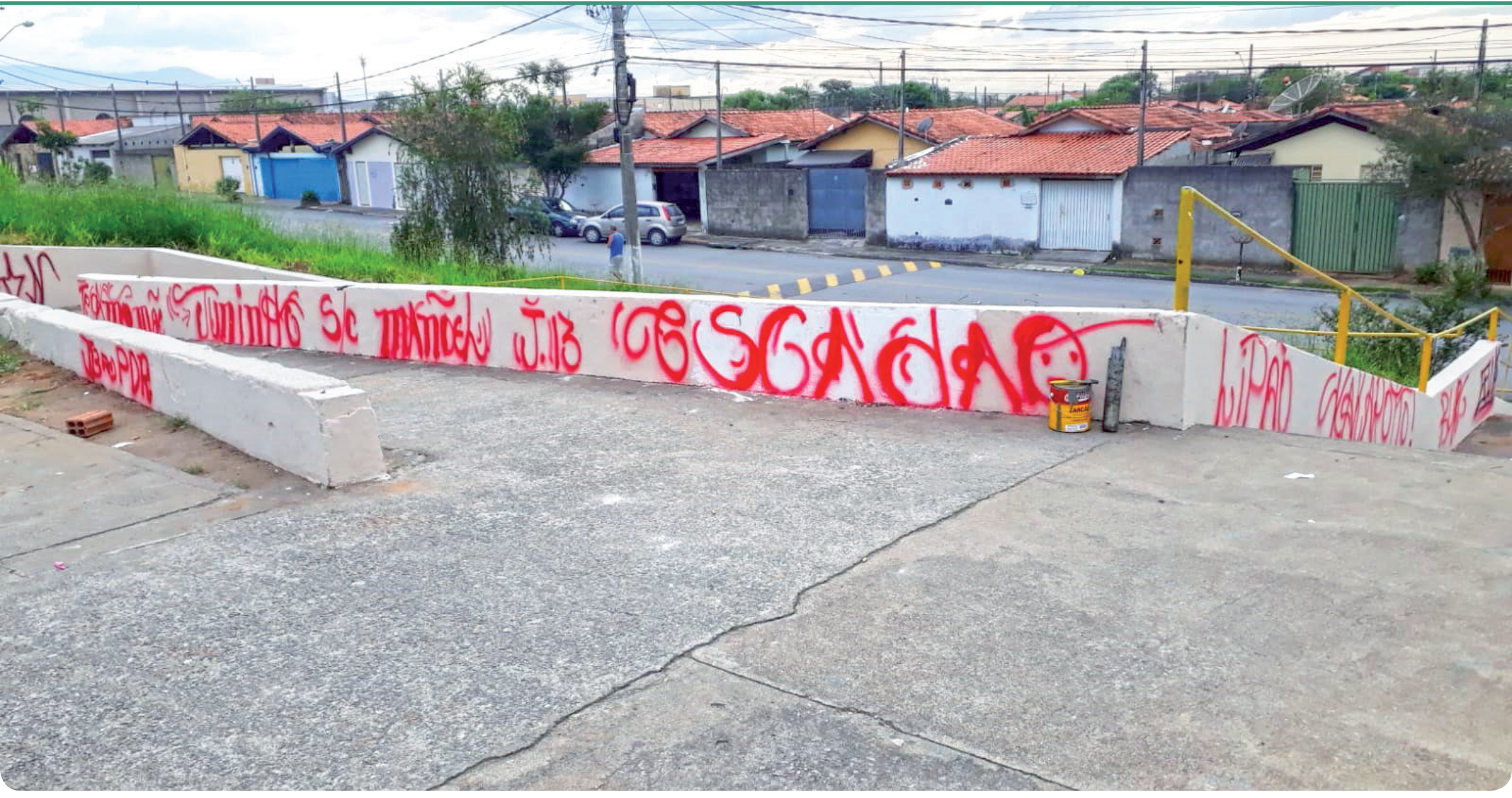
Passarela que liga o Castolira à Vila São Paulo foi objeto de pichação em todas as suas paredes; ato de vandalismo aconteceu uma semana depois do local ter recebido melhorias