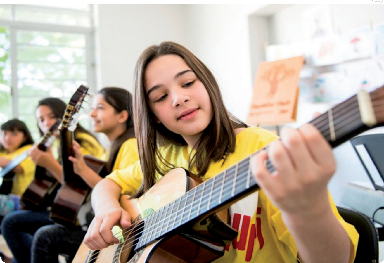
As aulas do Projeto Guri acontecem nos polos de Moreira César e Pindamonhangaba, no Araretama