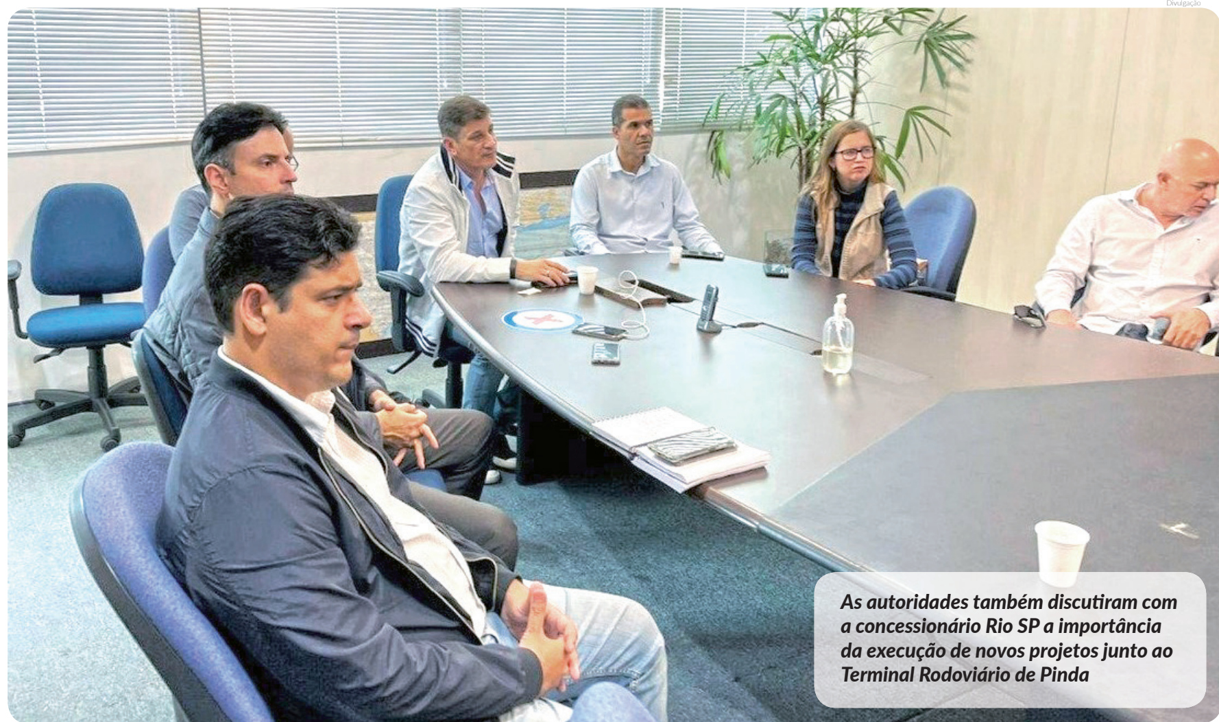
As autoridades também discutiram com a concessionária Rio SP a importância da execução de novos projetos junto ao Terminal Rodoviário de Pinda