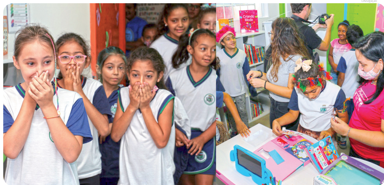
Projeto 'Biblioteca do Futuro' está em sua primeira edição e tem encantado alunos e educadores

O secretário Adjunto de Cultura e Turismo, Ricardo Flores, disse que o evento vai alinhar atividades esportivas e exposições. "É um evento longo, com oito horas de duração, permitindo que as pessoas possam vir no melhor horário. Também pensamos em oferecer uma diversidade de atrações, para que desta forma atraçades vários públicos", explicou.