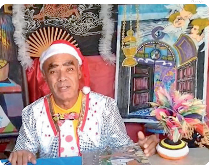
Evento no Parque da Cidade contará também com contação de histórias

Assinado pela Rede Educare, o projeto "Biblioteca do Futuro" está na sua primeira edição e nasceu com a proposta de oferecer a alunos e educadores um espaço de leitura com títulos que abordam temas relativos à sustentabilidade. São 850 exemplares, ambientação lúdica e informativa, jogos pedagógicos e instrumentos científicos. As paredes dialogam com os temas das publicações, como a parede azul que abriga conjunto de livros sobre reciclagem e coleta seletiva, a parede verde que traz acervo sobre energias renováveis e ciclo da água, entre outras soluções que garantem a ludicidade da biblioteca.