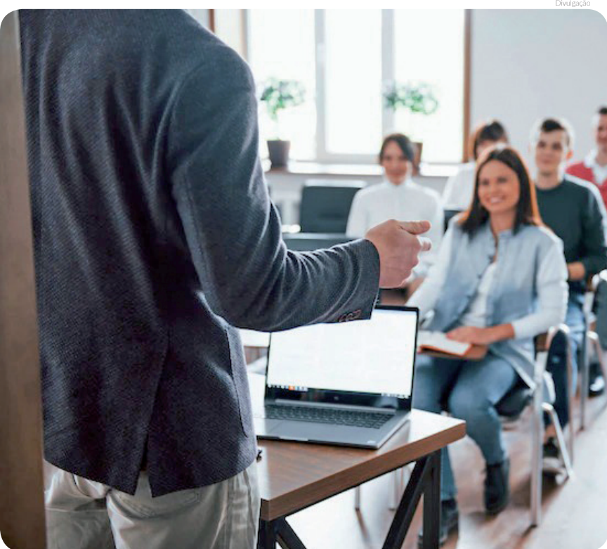
Aprimoramento faz parte do “Projeto Cuidar – Cuidando de Quem Cuida”