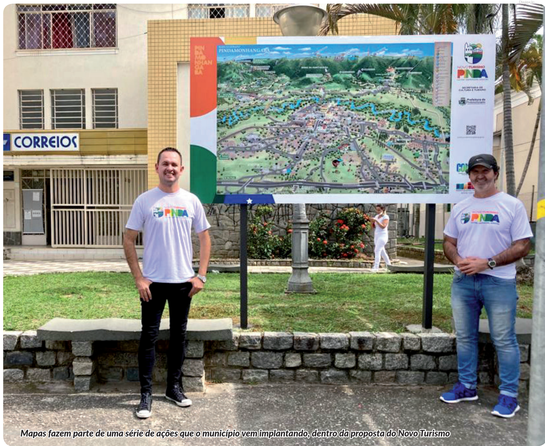
Mapas fazem parte de uma série de ações que o município vem implantando, dentro da proposta do Novo Turismo

Atualmente, possuem um mapa ilustrado instalado nas proximidades dos seguintes locais turísticos: Parque Pico do Itapeva, Barraca da Tônia, Café no Bule, Hotel Fazenda Pé da Serra, Restaurante Colmeia, Restaurante Edmundo, Fazenda Nova Gokula, Queijaria Boldeirini, Praça do Santana, Praça da Bíblia, Praça 7 de Setembro, Praça Monsenhor Marcondes, Praça dos Ferroviários (EFC), Bosque da Princesa, dois no Parque da Cidade, Restaurante Paizão e Praça São Benedito.