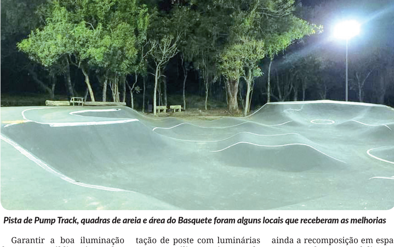
Pista de Pump Track, quadras de areia e área do Basquete foram alguns locais que receberam as melhorias

Garantir a boa iluminação dos espaços públicos é uma forma de melhorar a segurança pública e garantir a prática de lazer para a população. Com essa visão, a Prefeitura de Pindamonhangaba, através da Secretaria de Governo e Serviços Públicos, prossegue a realização dos serviços de melhorias e revitalização do sistema de iluminação pública em diversos bairros da cidade.