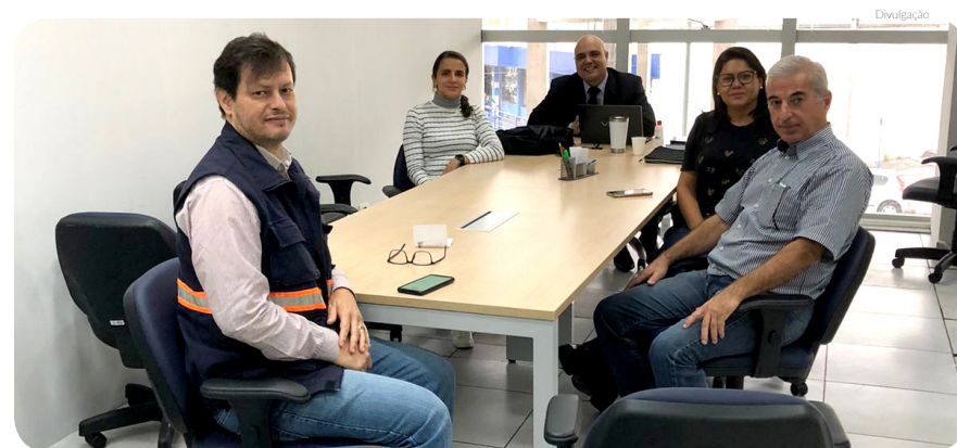
Reunião ocorreu na última segunda-feira, dia 16 de maio na Prefeitura de Pindamonhangaba