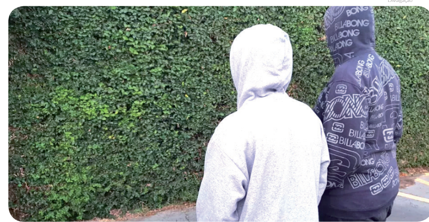
Medidas simples como se agasalhar adequadamente contribuem para evitar danos à saúde

A Defesa Civil Estadual recomenda que as defesas civis