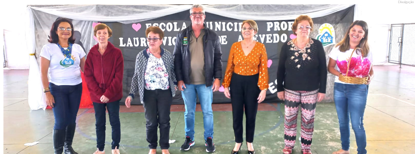
Filhos do homenageado participaram do evento