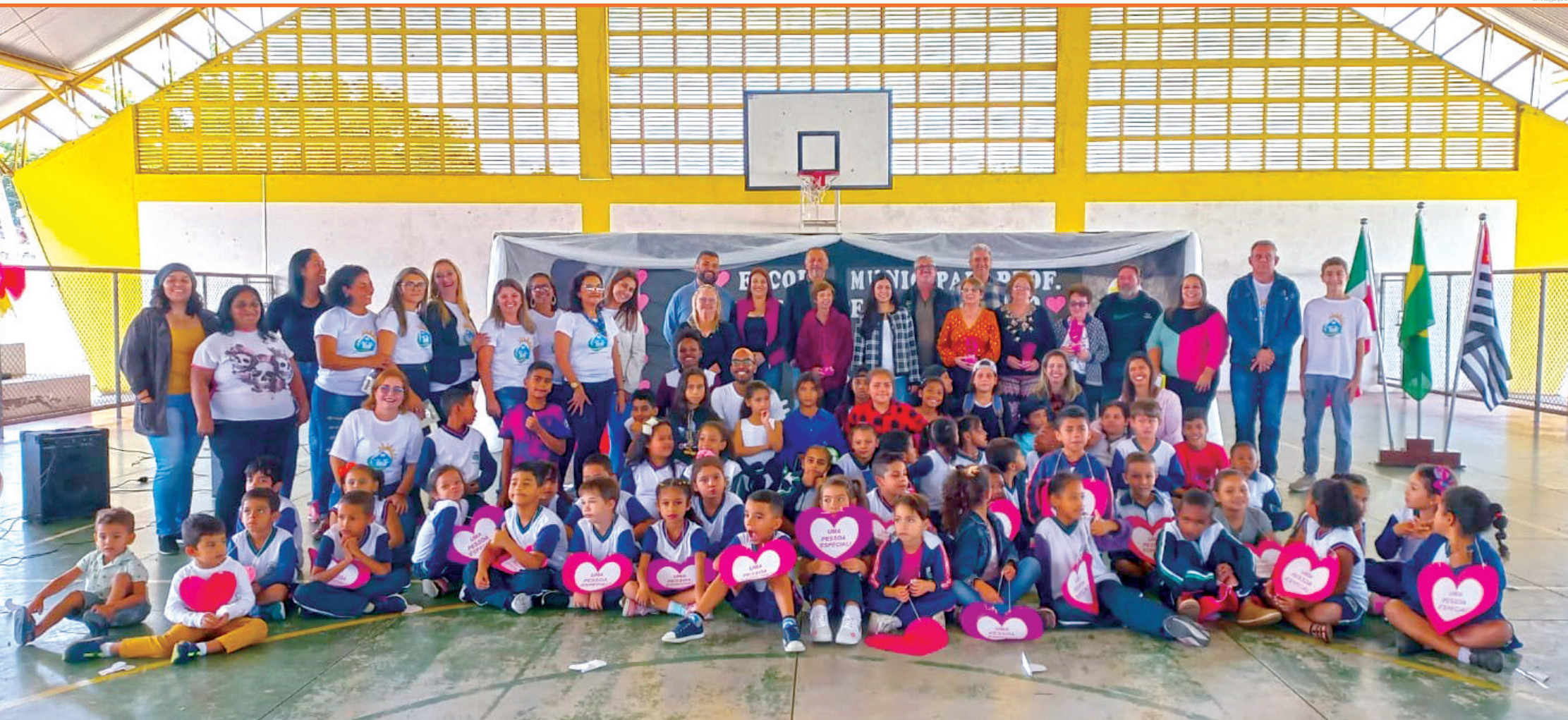
Localizada no bairro Cícero Prado, a escola aniversariante aproveitou a comemoração para celebrar também o "Dia da Família", reunindo familiares dos alunos