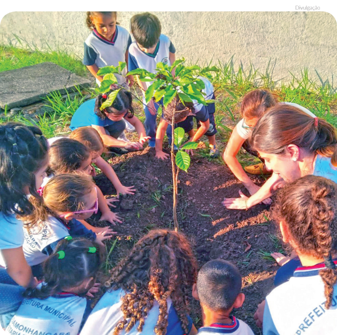
Além da nova sede no bairro do Lessa, o "Projeto Casa Verde" passa a contar com oito professores