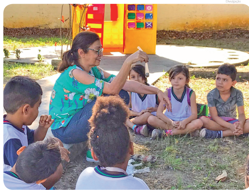
O projeto dobrou de quatro para oito o número de professores

Qualquer dúvida ou informação sobre o “Projeto de Educação Ambiental Casa Verde” pode ser obtida pelo e-mail: casaverde@pindamonhangaba.sp.gov.br ou pelo telefone 3637-4616. A população pode acompanhar as redes sociais do projeto pelo Instagram @projetoecasaverde e Facebook: Projeto de Educação Ambiental Casa Verde.