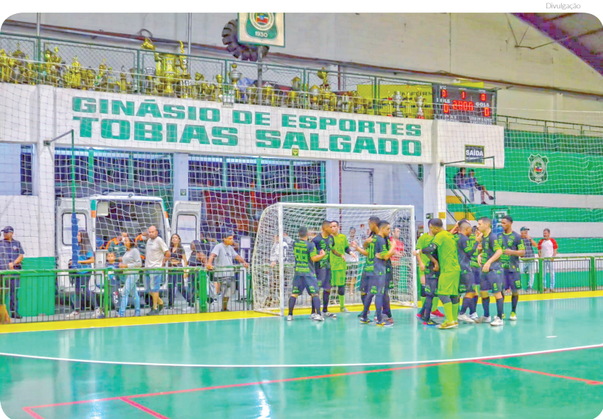
Time de Pinda é líder do seu grupo na Liga Paulista de Futsal