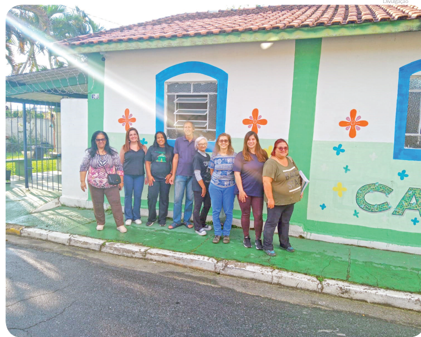
Agora o município conta também com uma nova sede na Emei Felix Adib Miguel, no bairro Lessa