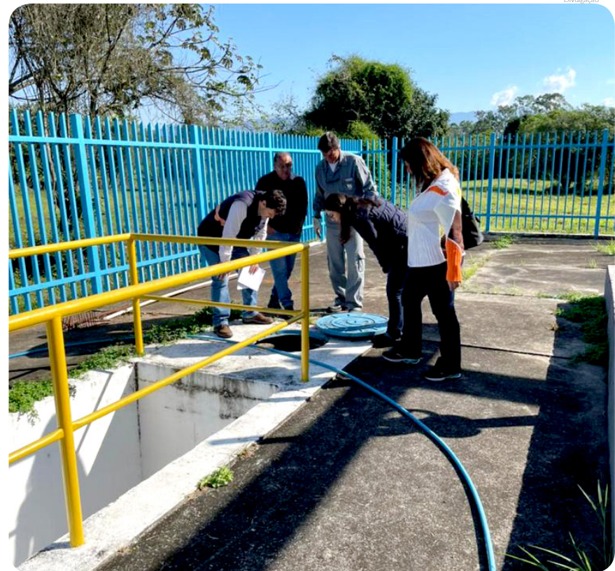
Trabalho conjunto entre a agência, a Sabesp e a Prefeitura viabiliza melhorias na qualidade dos serviços oferecidos à população

do falta de água, ligações de água e esgoto, ou qualidade de água, devem ser feitas pelos telefones 0800 055 0195 ou 195, canais diretos de comunicação da Sabesp.