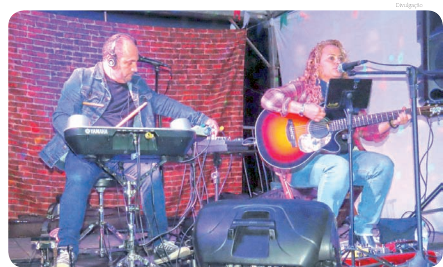
Além da culinária, festival conta com atrações musicais