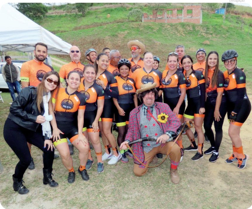
Evento vem recebendo presença de centenas de pessoas

Para conferir a programação do ‘II Festival Gastronômico de Inverno Piracuama e Ribeirão Grande’, clique https://pindamonhangaba.sp.gov.br/ii-festival-gastronomico-de-inverno .