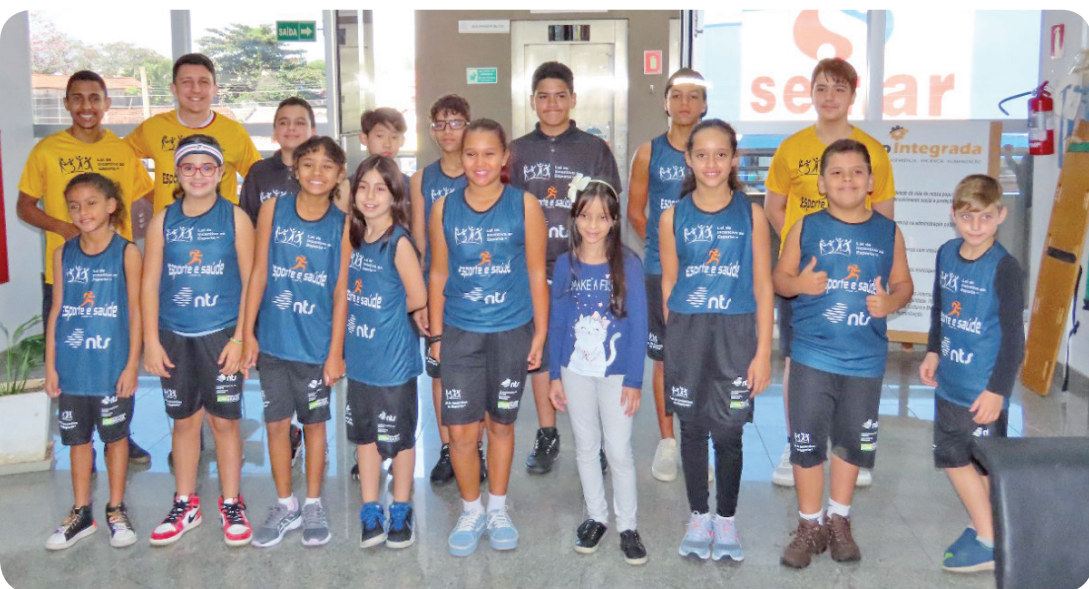
Durante a cerimônia, um atleta de cada categoria recebeu os uniformes

As equipes masculinas (foto) e femininas do vôlei adaptado estiveram disputando mais uma rodada da Super Liga de Vôleibol da Melhor Idade, em Guaratinguetá. Os times jogaram três jogos e obtiveram três vitórias. Agora as equipes estão focadas no "24º Jomi" - Jogos da Melhor Idade -, na final estadual, que será realizada em Pinda, a partir do dia 8 de julho.