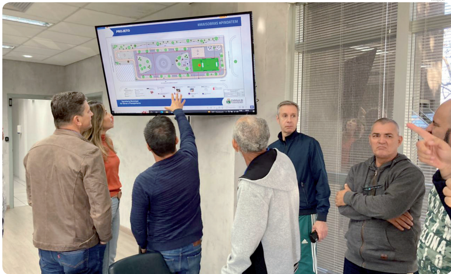
Participaram do lançamento da praça de lazer a ser construída no Araretama, diversos moradores e lideranças do bairro