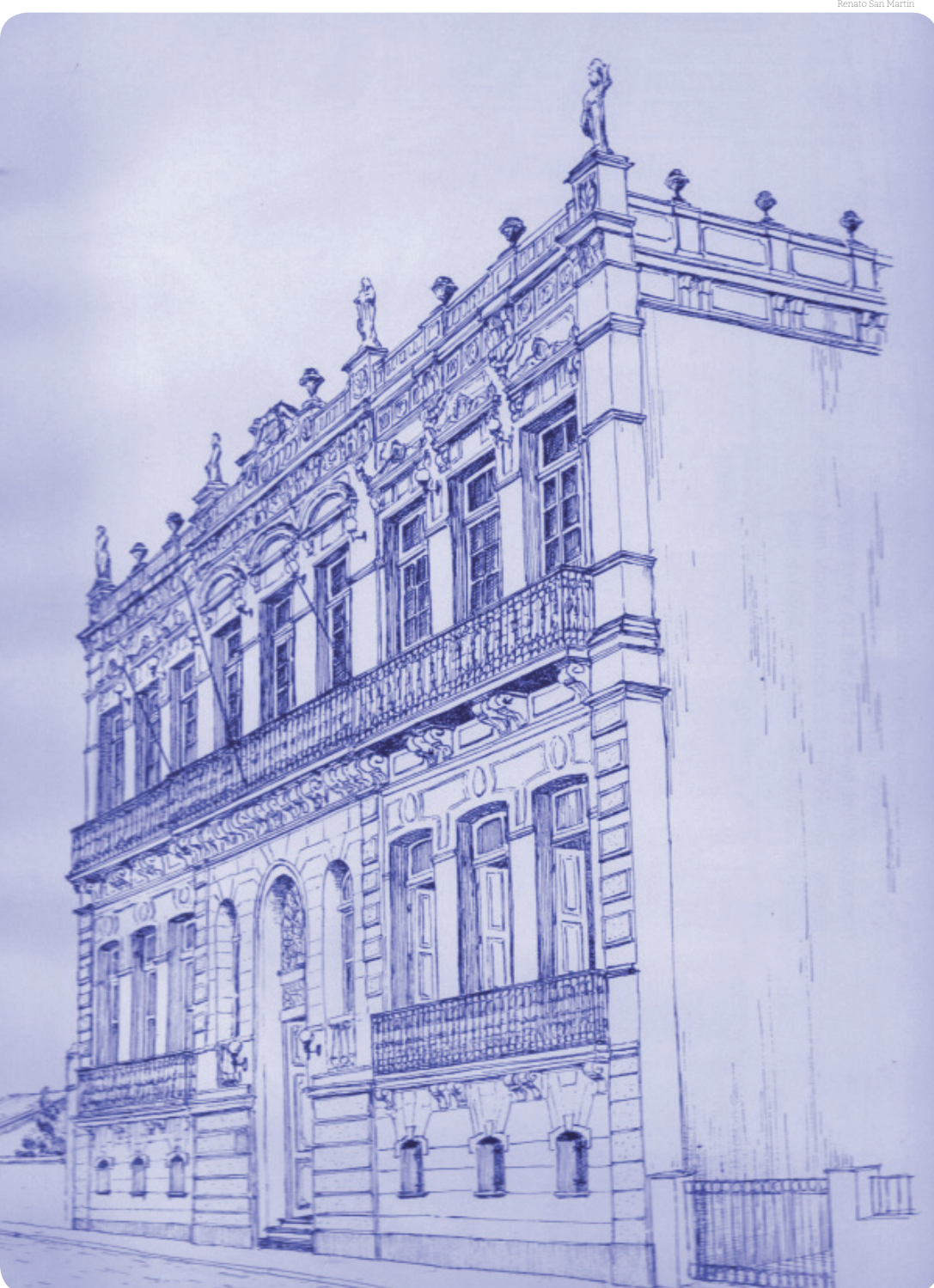
Solar dos Barões do Itapeva foi adquirido pela municipalidade em 1928

Aberto à visitação pública, atualmente abriga a Secretaria de Cultura e Turismo, a APL-Academia Pindamonhangabense de Letras e, no subsolo, o arquivo histórico do Centro de Memória Barão Homem de Mello e o Centro de Atendimento ao turista.