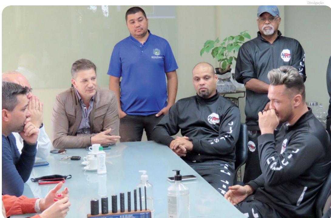
Prefeito anunciou investimento de R$ 1,2 milhão em ginásio esportivo

A Prefeitura investirá R$ 1,2 milhão para construção de um novo equipamen-