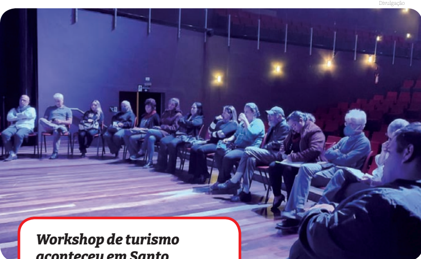
Workshop de turismo aconteceu em Santo Antônio do Pinhal na última quinta-feira (23)