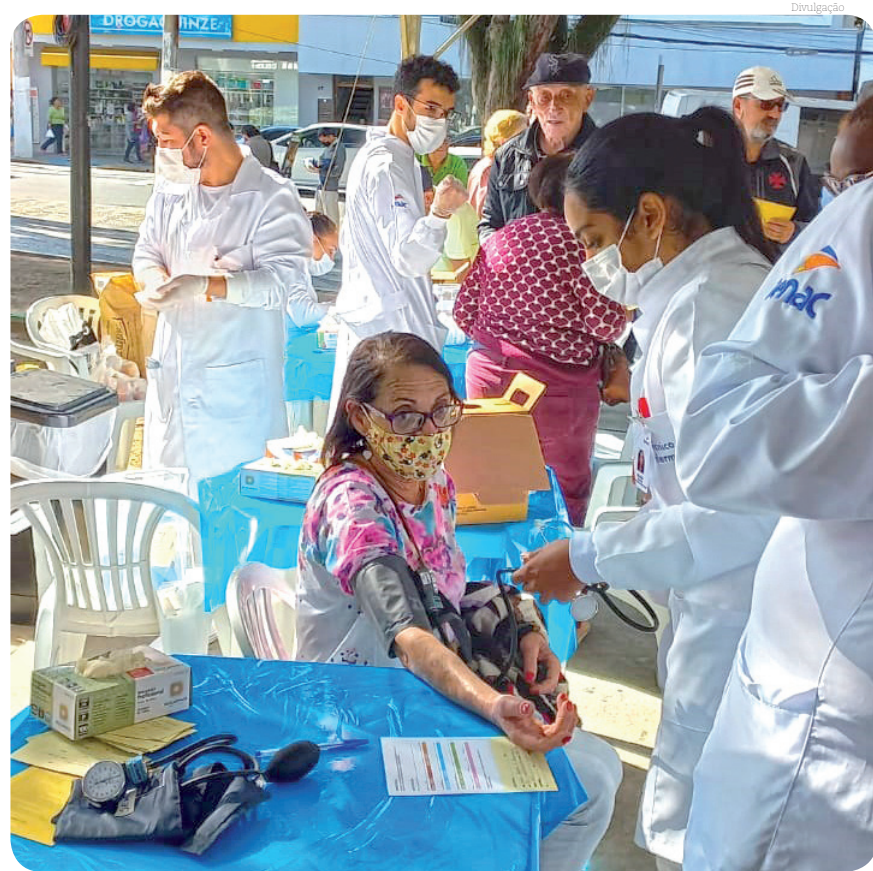
Houve aferição de pressão arterial em parceria com o Senac