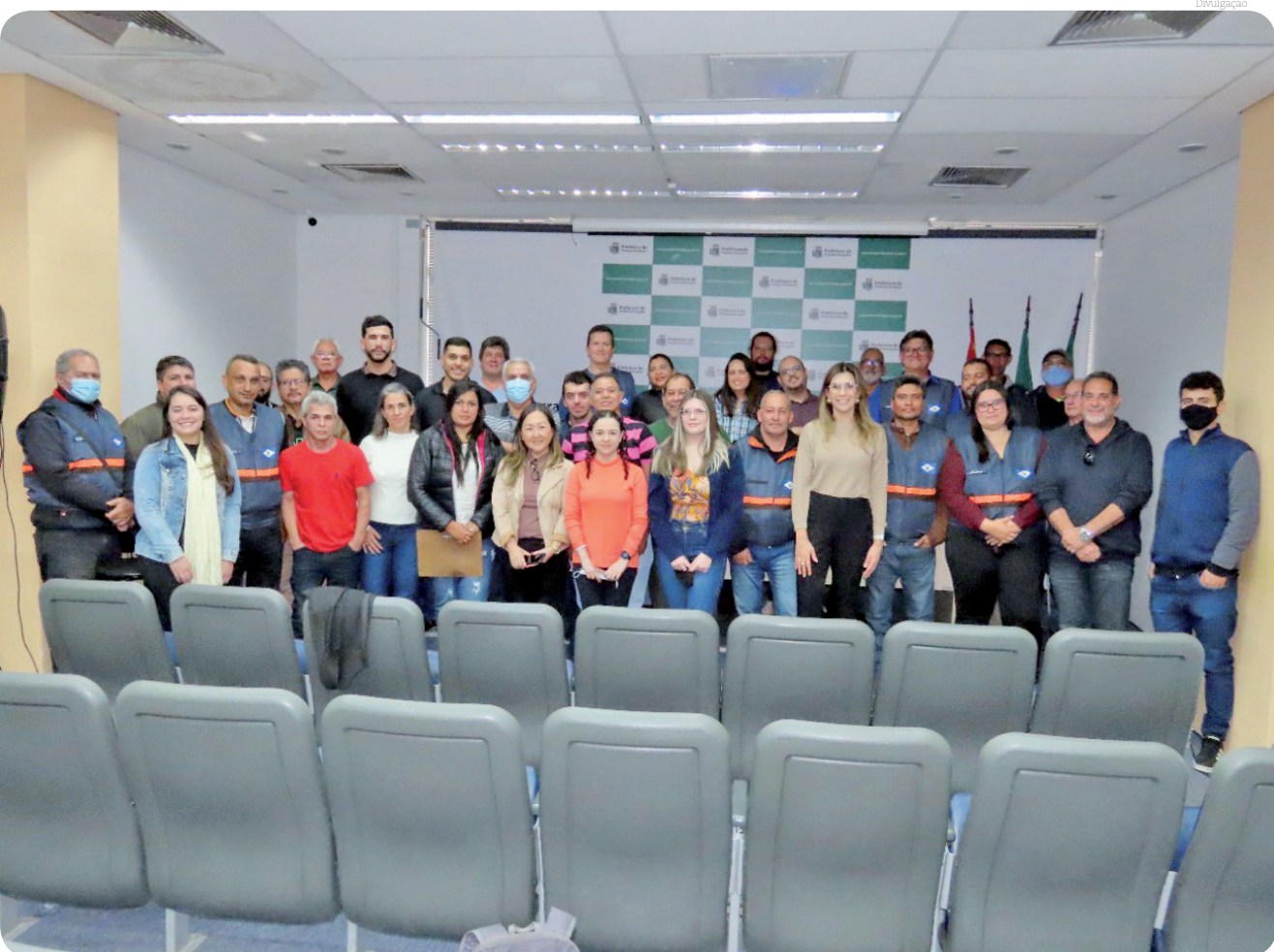
Encontro aconteceu no auditório municipal da sede da Prefeitura no dia 29 de junho