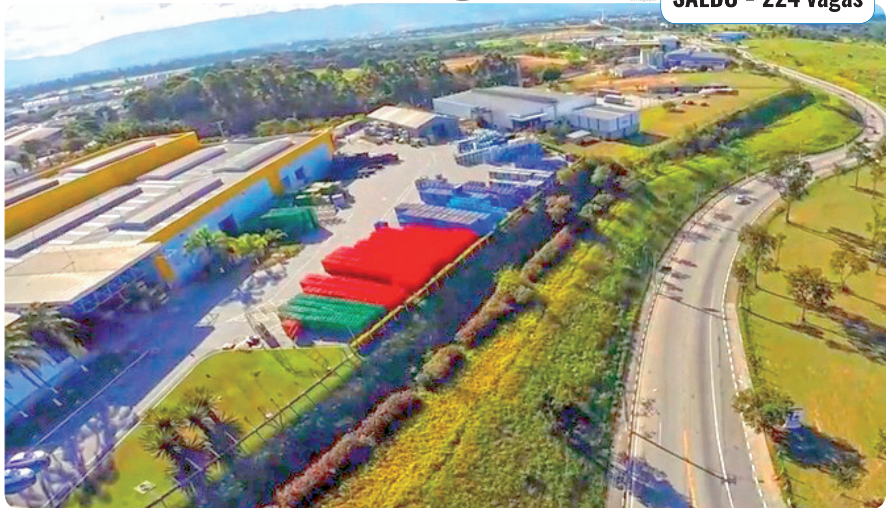
Em maio, Pindamonhangaba realizou 1.353 contratações e 1.129 demissões, gerando um saldo positivo de 224 novas vagas