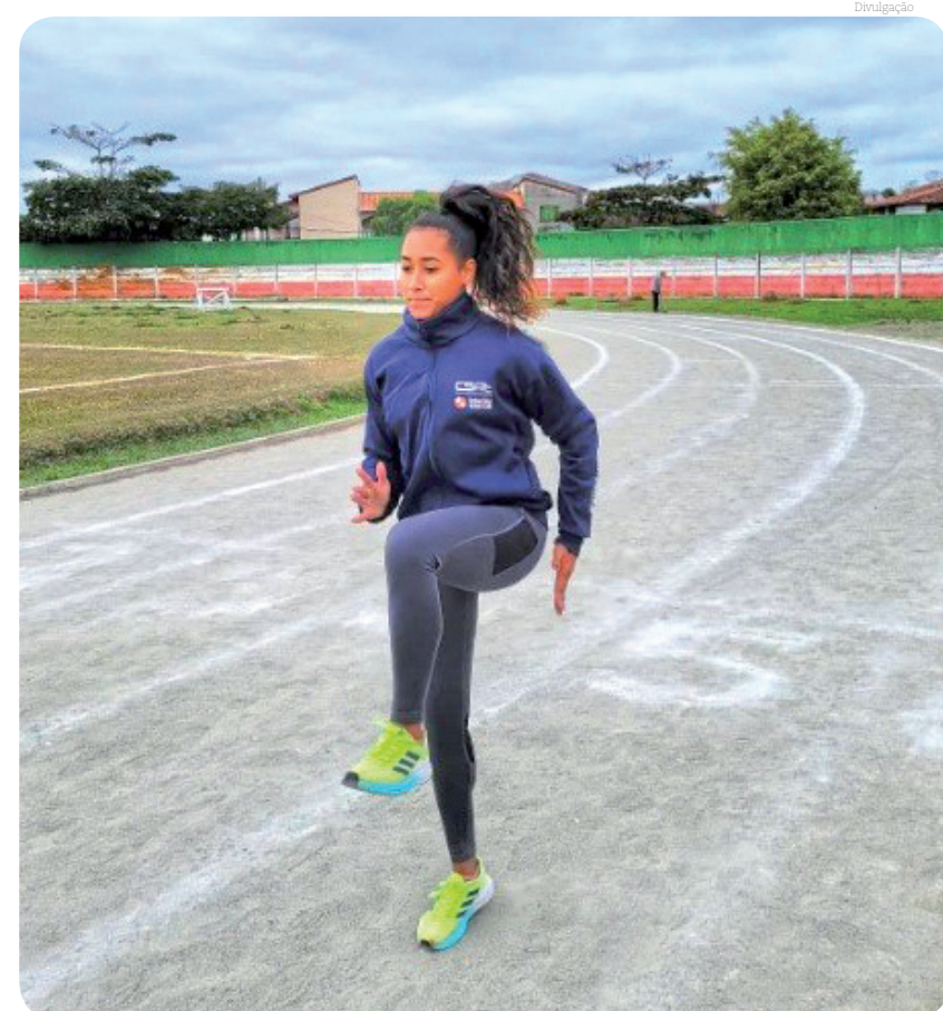
A atleta conta com o apoio do Exército e da Semelp de Pinda