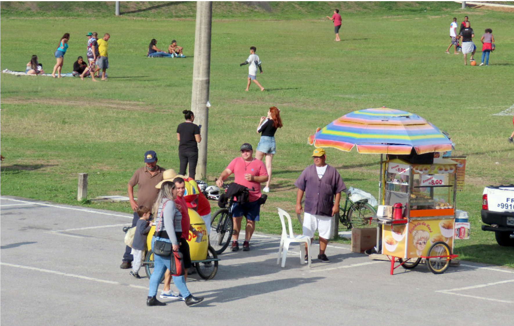
‘Domingo no Parque’: shows, praça de alimentação e atividades para a família inteira