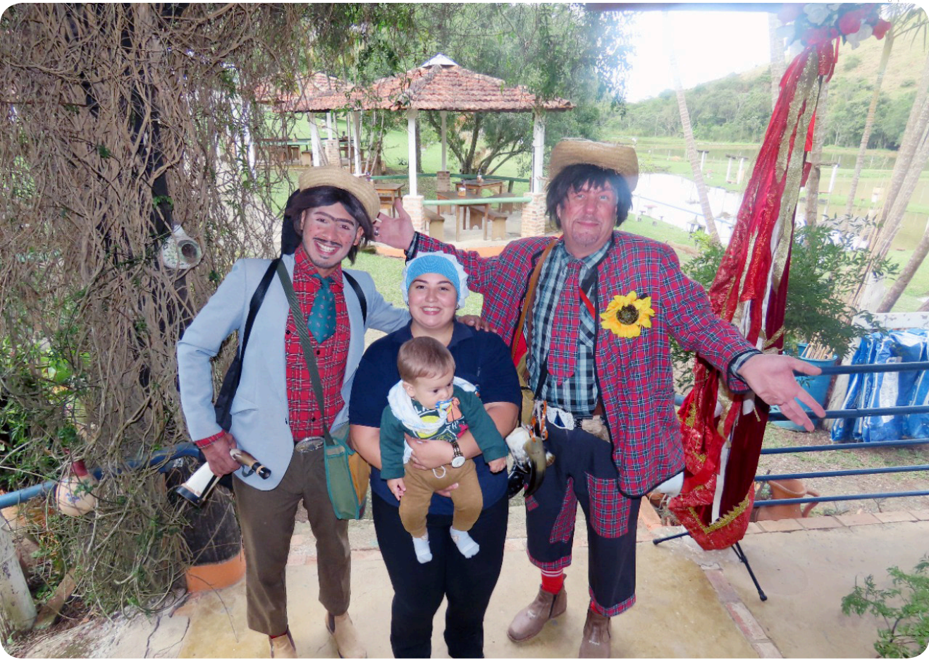
Evento reúne atrações musicais, feiras e exposições em restaurantes do Rib. Grande e Piracuama