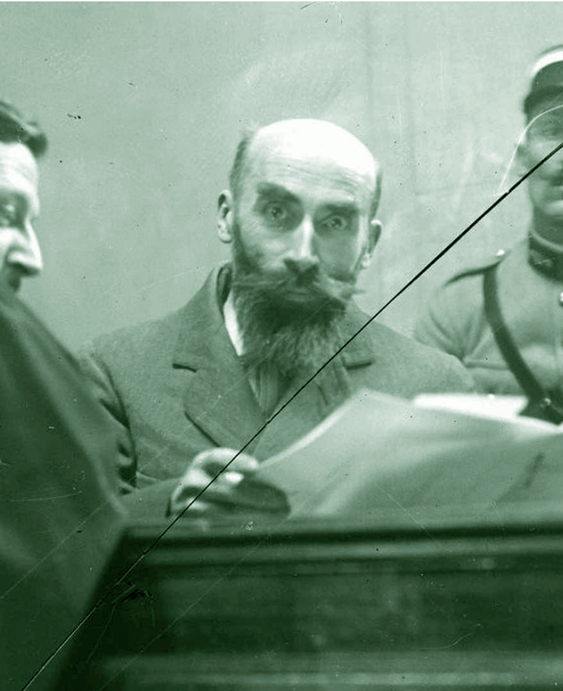
O assassino francês “Barba Azul” e prováveis vítimas