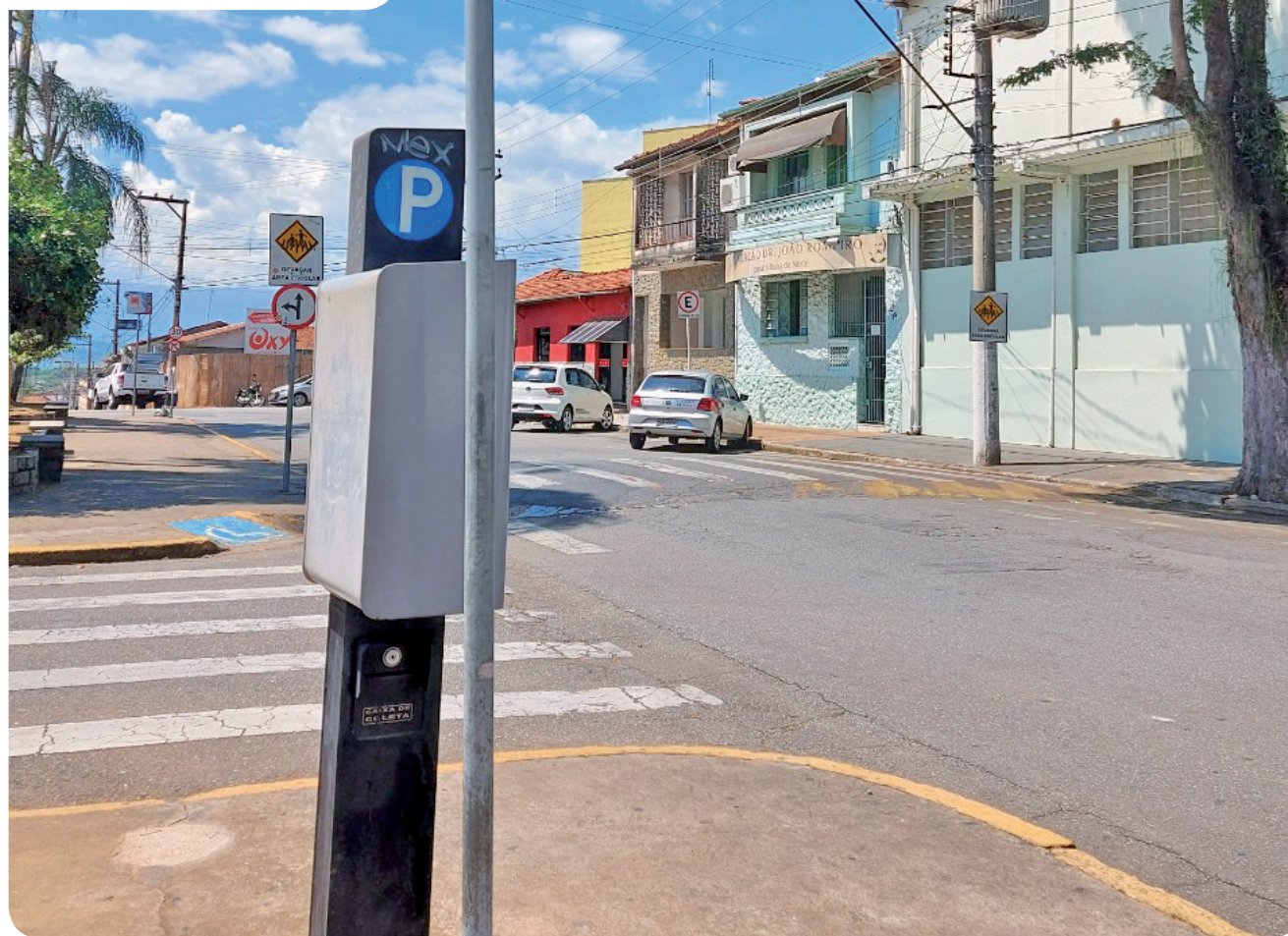
O estacionamento rotativo pago é um importante instrumento de ordenamento do uso do solo