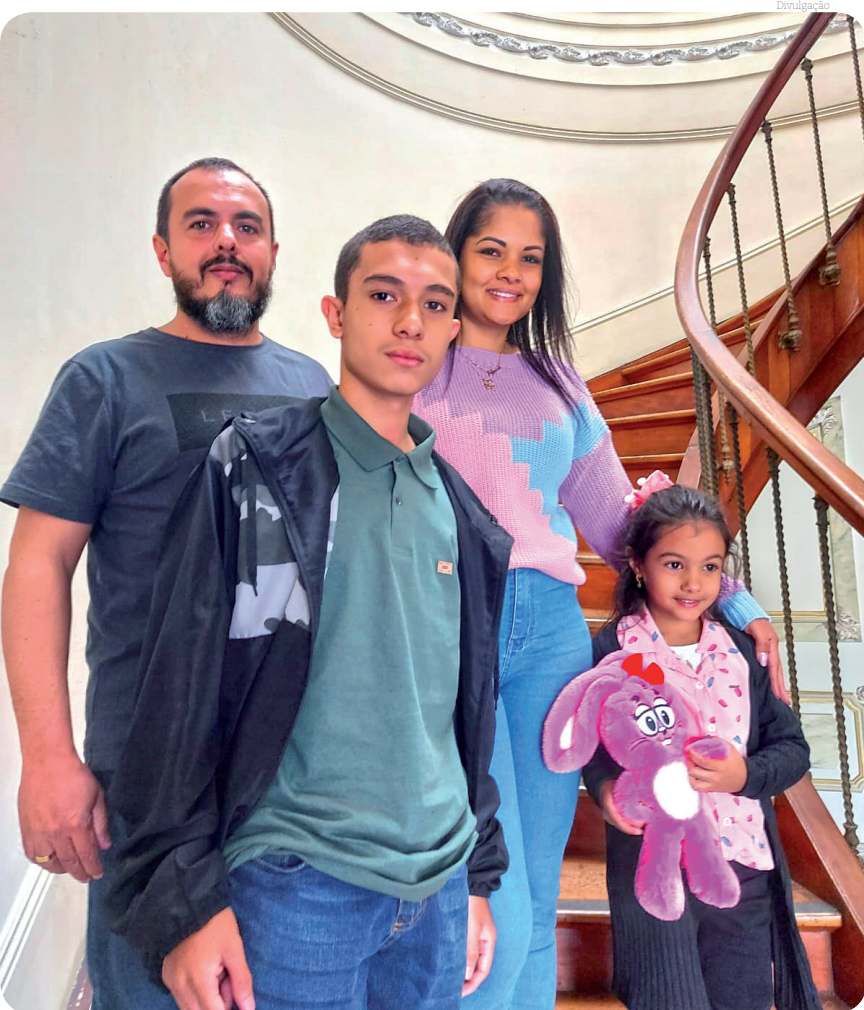
Famílias aproveitaram o 'Dia dos Namorados' para ir ao Museu