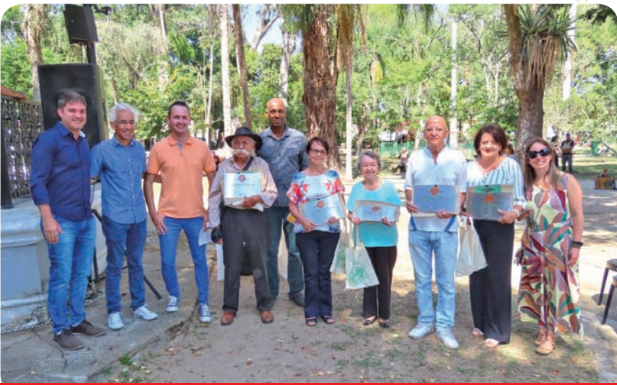
“Mestres Cultura Viva 2022” recebem prêmios