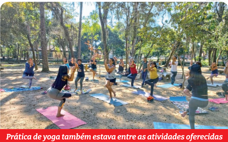
Prática de yoga também estava entre as atividades oferecidas

Aos Mestres da Cultura, com muito carinho