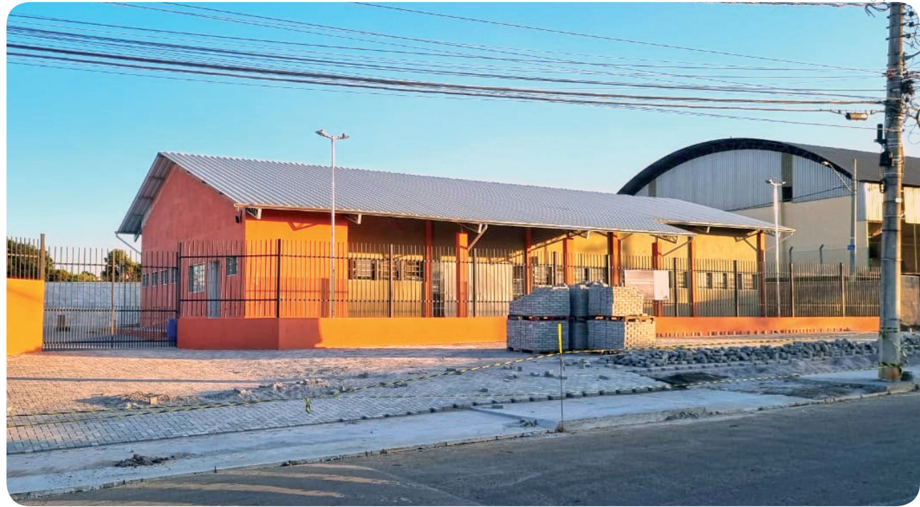
A construção do equipamento público recebeu ao todo um investimento de R$ 967 mil