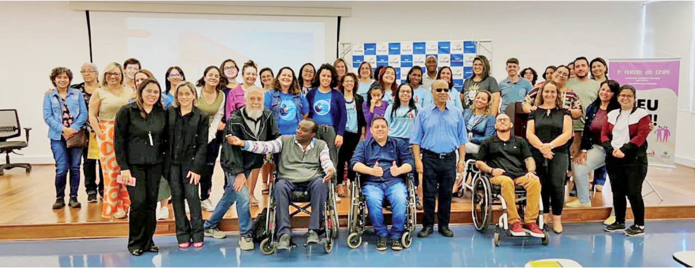
DIREITOS DA PESSOA COM DEFICIÊNCIA. O fórum do CMPD (Conselho Municipal da Pessoa com Deficiência) aconteceu no último sábado (27), no auditório do Senac Pinda