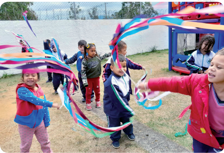
Crianças vivenciaram atividades folclóricas de forma lúdica