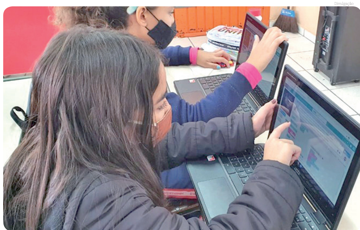
As atividades de produção de texto estão sendo compiladas em um Blog