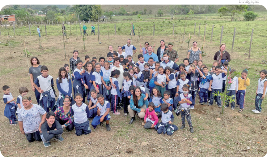
Ações em comemoração ao "Dia da Árvore" ocorreram na Escola Profª Maria Aparecida Camargo de Souza no Ribeirão Grande

Na última quarta-feira, dia 21 de setembro, Pindamonhangaba comemorou com diversas ações o "Dia da Árvore". As Secretarias