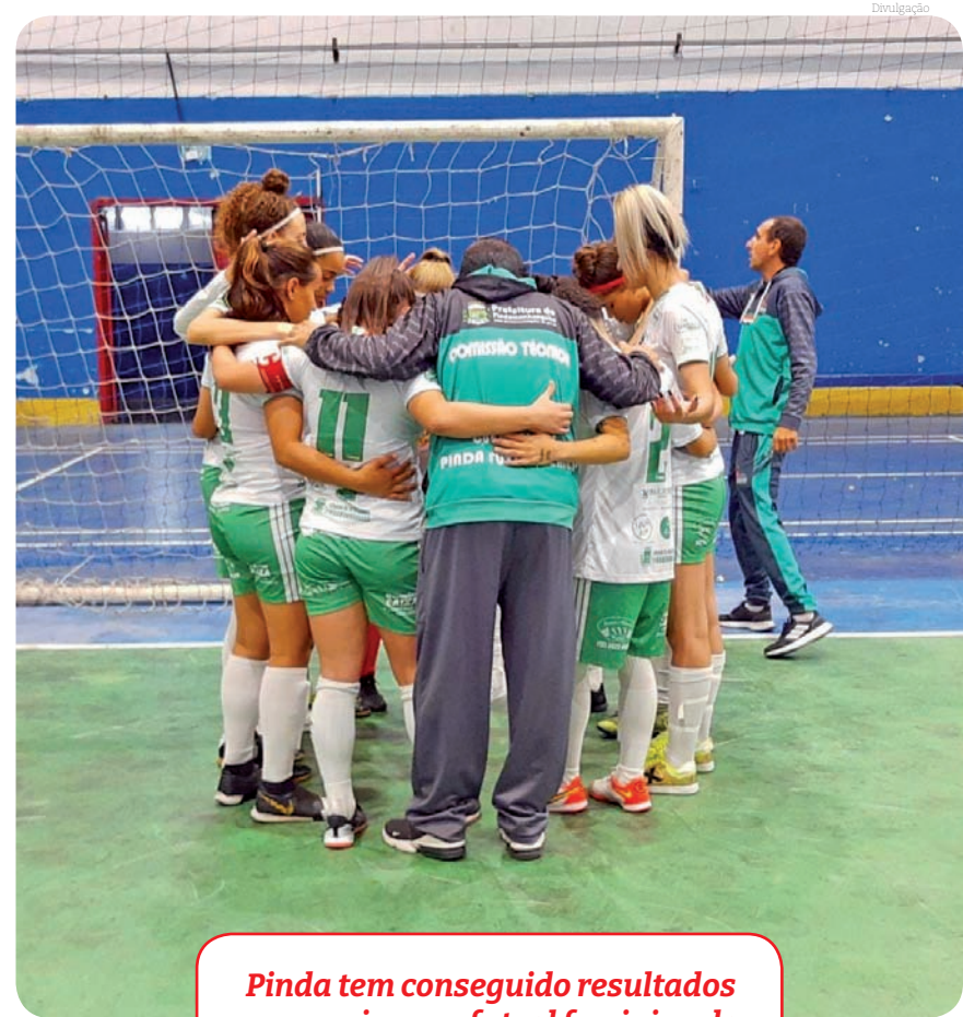
Pinda tem conseguido resultados expressivos no futsal feminino da categoria Adulta e do Sub-16

A equipe Sub 16 de Pinda se prepara para a "Copinha de Futsal do Estado".